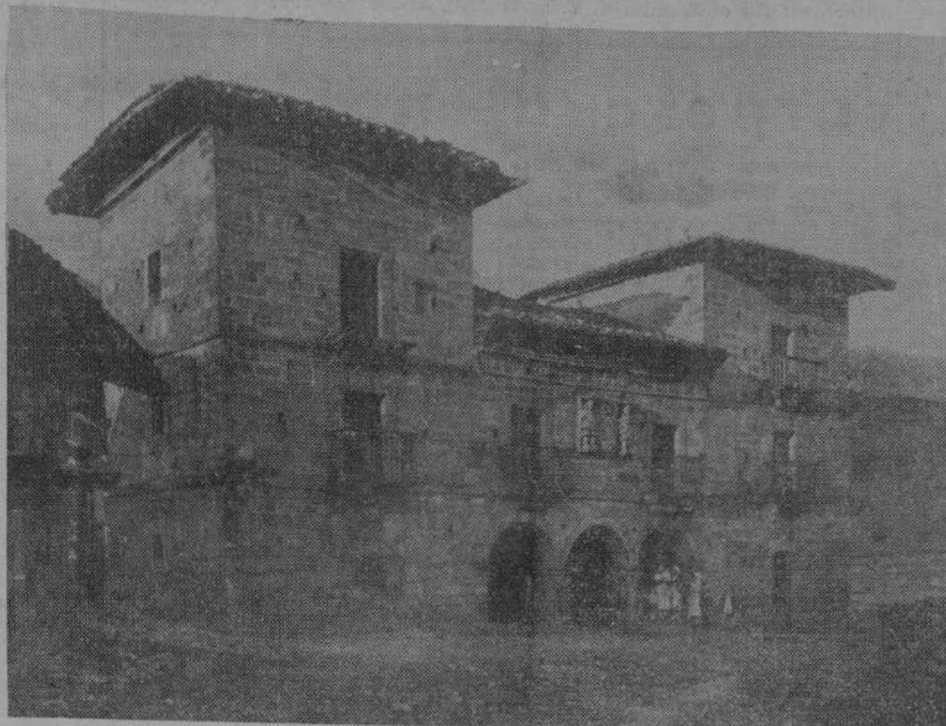
LA MONTAÑA TURISTICA.—El famoso Palacio de las Torres, en Carmona (Cabuérniga), uno de los más interesantes de la provincia.

Huesos y articulaciones. Cirujía — RADIOLOGIA — Consulta de 12 a 2 y de 3 a 5 Plaza de J. Estrafá (Escuelas), 6 Teléfono 1032.