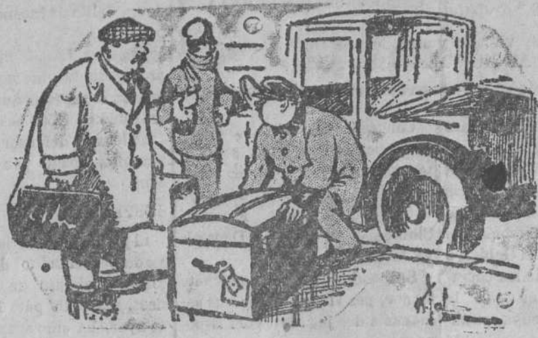
—¡Como pesa el baulito! —Como que son las frutas y los huevos que llevamos para vetanear en el campo.

El intrusismo es el arte de la enseñanza primaria lo que el curandero en la Medicina. Estas dos plagas que no espabilan el entendimiento, ni alivian los dolores del cuerpo con sus disciplinas, con sus sangrías, con sus emplastes, con sus aperturas, nacen de