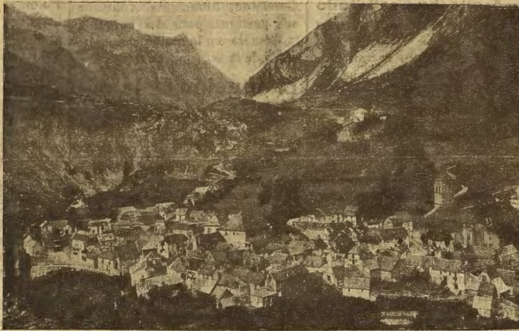
BIELSA Vista general

Cortado en Aínsa el paso de los árabes en su expansión hacia el Norte, la villa de Bielsa y su comarca no ocupa las páginas de la Historia aragonesa hasta que en 1311 se rebeló contra el man-