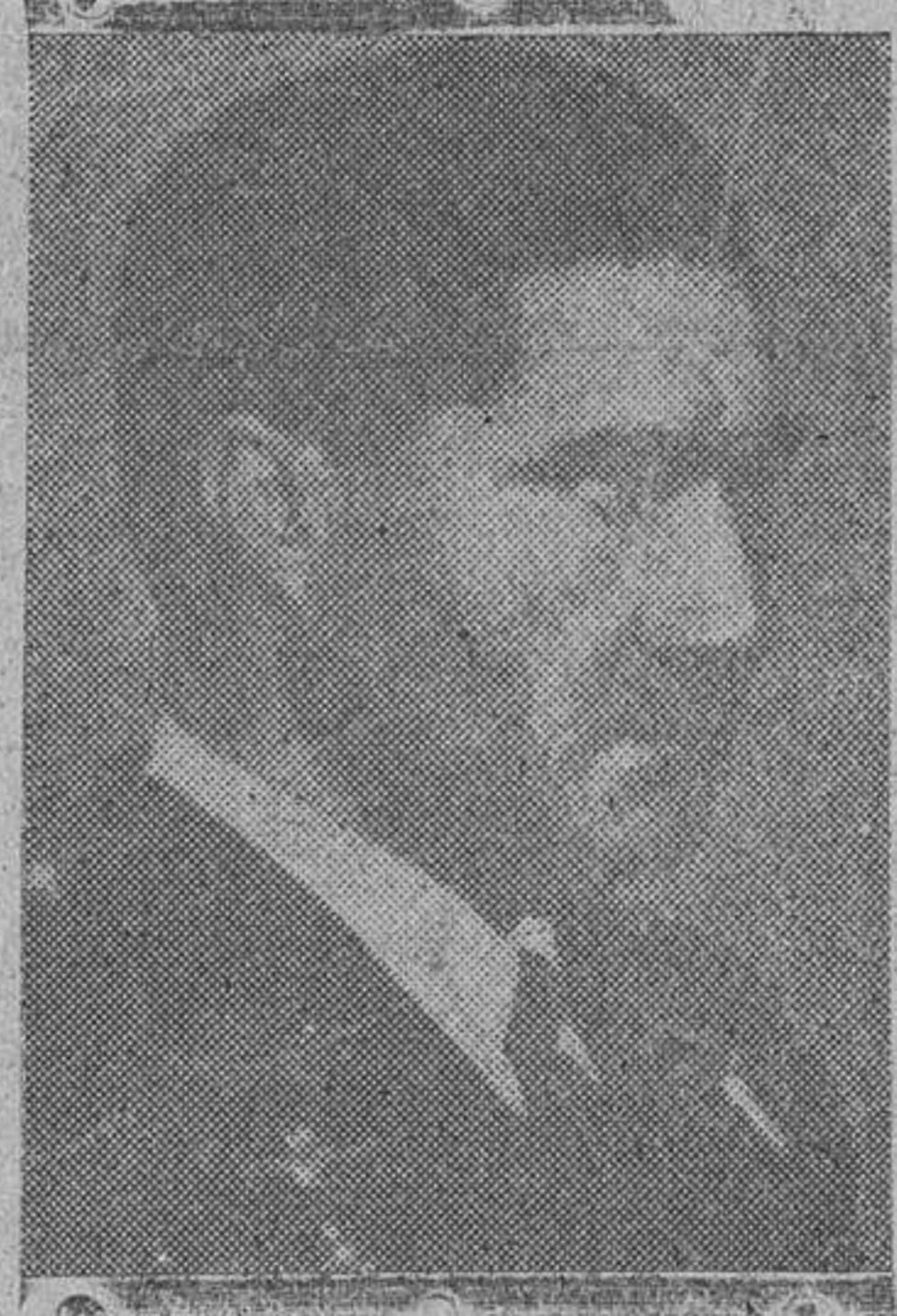
GALLARZA Ministro del Aire