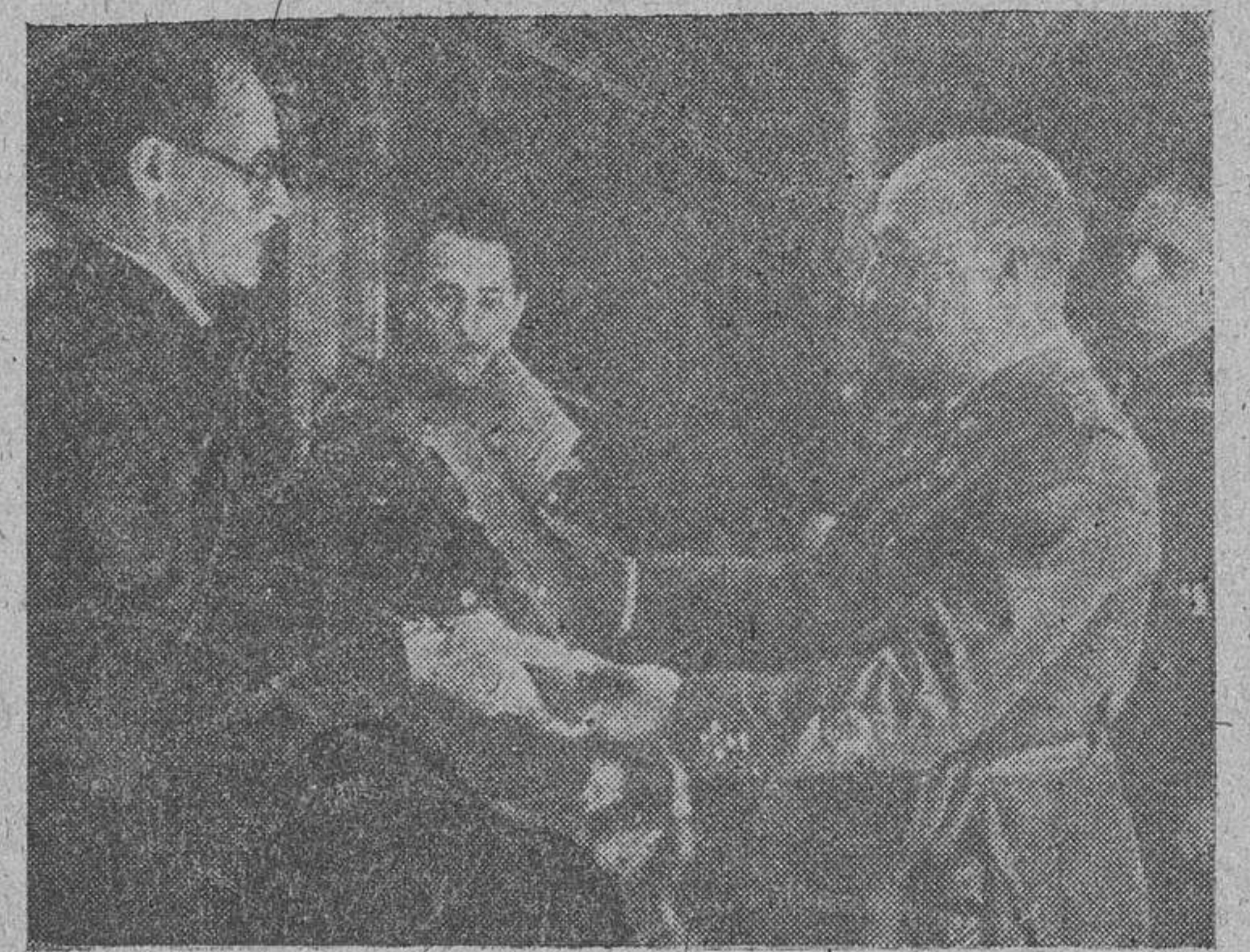
Una comisión del personal de los astilleros Echevarrieta, de Cádiz, que, presidida por el gobernador civil, hizo entrega al Caudillo de una placa de bronce, como homenaje de gratitud debido al interés que, en favor de la capital gaditana, demostró S. E. con motivo del siniestro del 18 de agosto pasado.