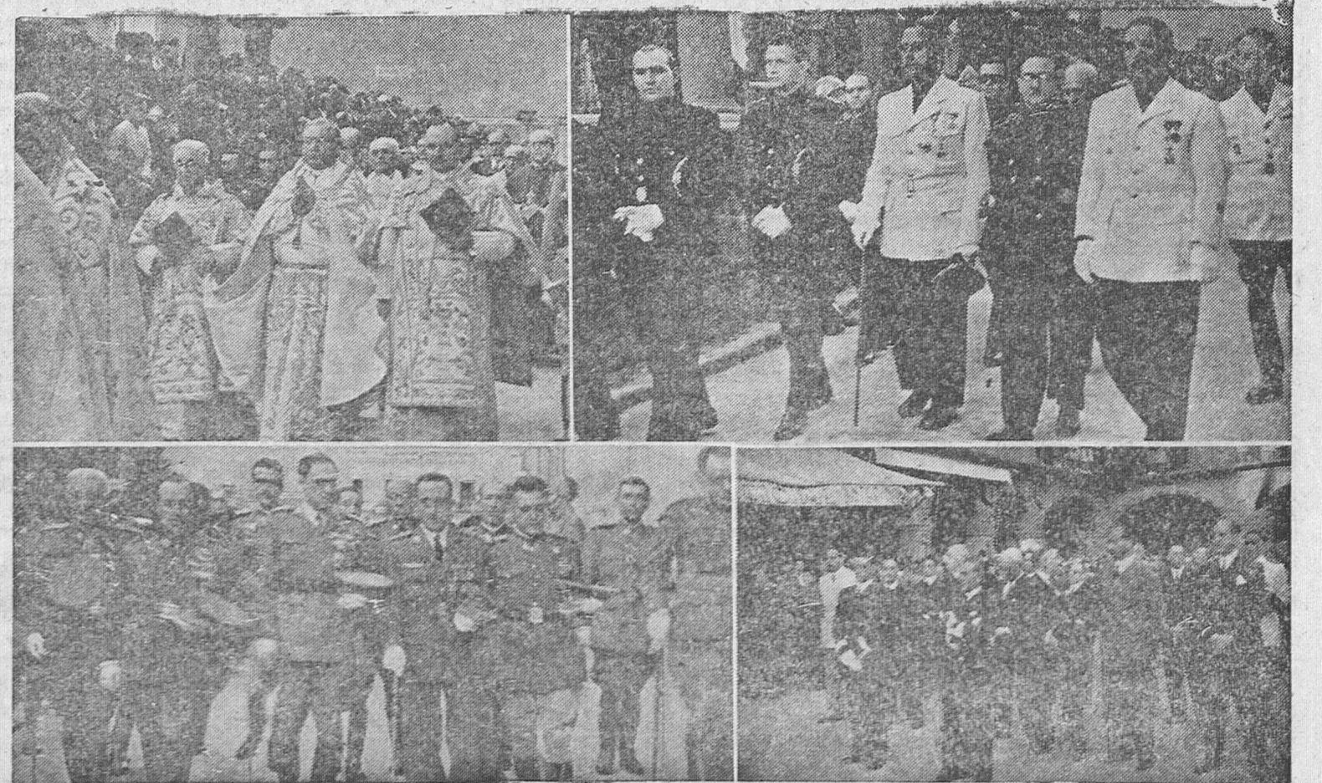
Arriba, a la izquierda, presidencia eclesiástica: Monseñor Cicognani acompañado del Cabildo salmantino, arriba, a la derecha, presidencia de jerarquías de Falange Española Tradicionalista y de las JONS.—Abajo, a la izquierda, presidencia militar. (Fotos Amalio Gombau). Abajo, a la derecha, presidencia de autoridades civiles. (Foto Buxaderas)