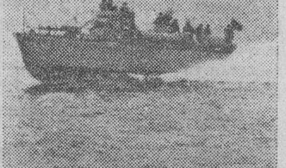
Torpedero rápido rumano de servicio en el Mar Negro. (Orbis foto.)

Washington.—El presidente Roosevelt ha dirigido un mensaje al pueblo francés con ocasión de la fiesta de la República francesa, en el que, después de exponer los principios por los que luchan actualmente las naciones unidas, expresa su convicción de que los países oprimidos recobrarán su libertad. (Efe.)