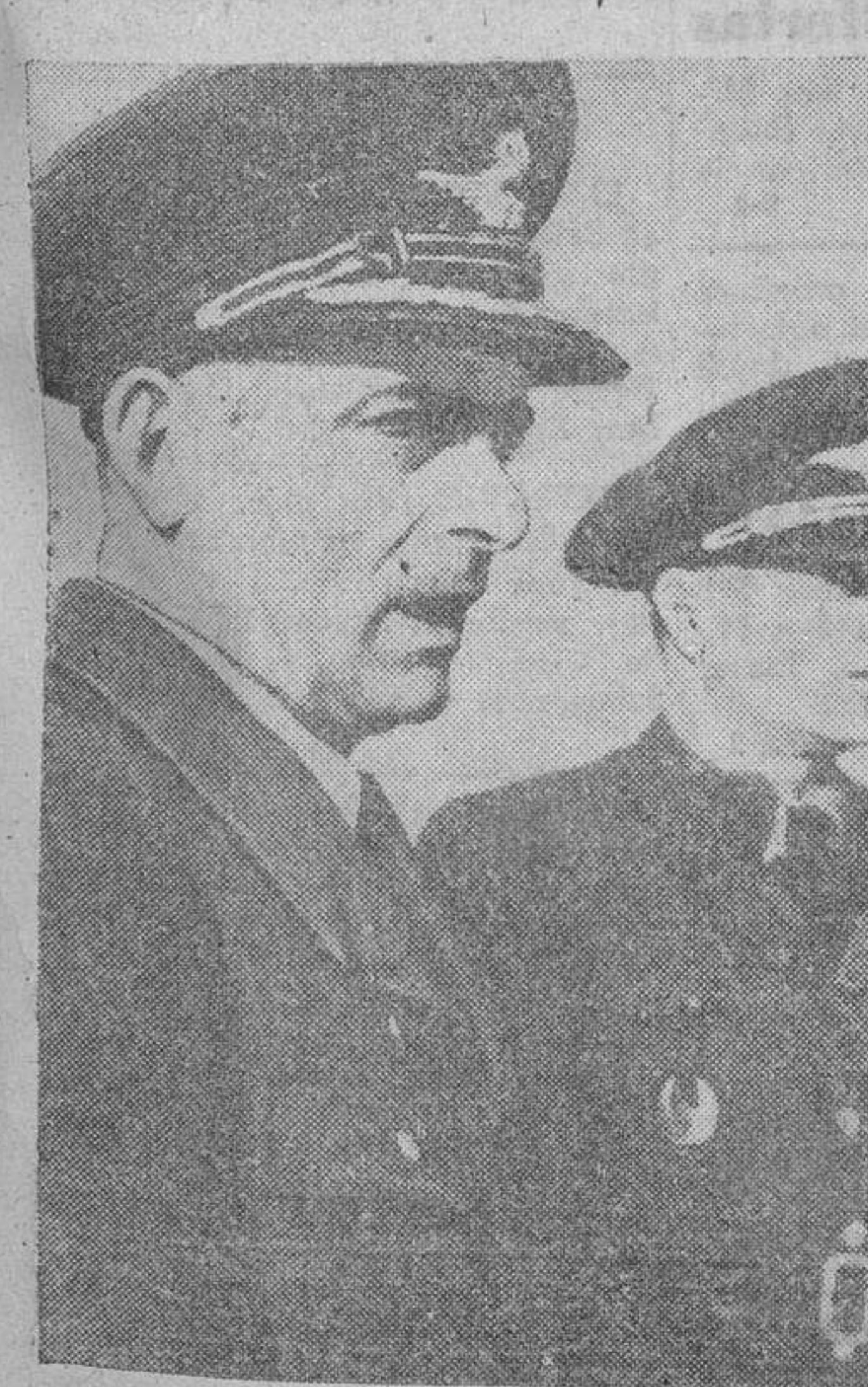
Oficiales de un navío rumano en el puesto de mando.