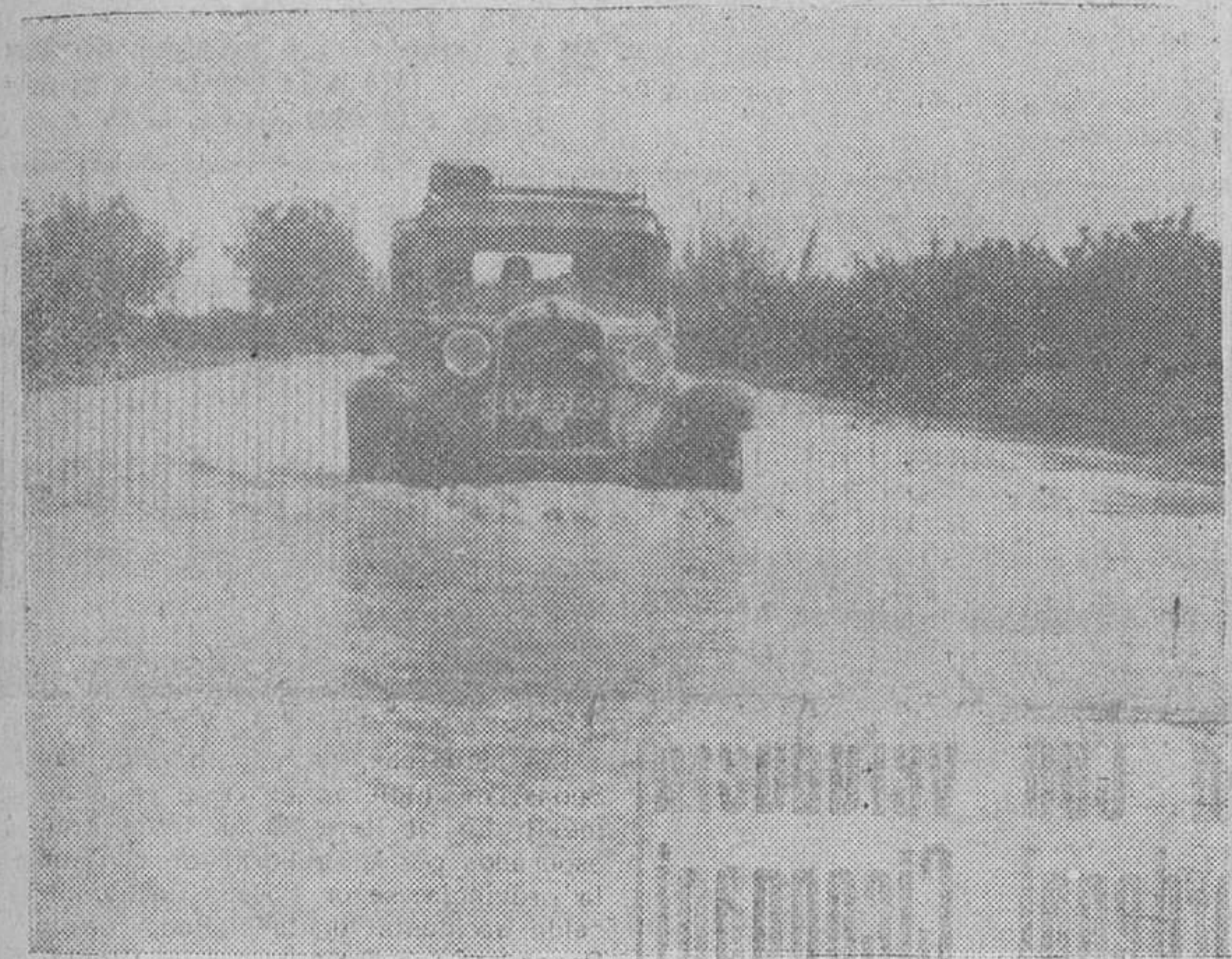
Pego. — Aspecto que ofrecía la carretera de Alicante - Silla - Valencia, totalmente cubierta por las aguas desbordadas del río Gallinera, como consecuencia de las recientes lluvias.