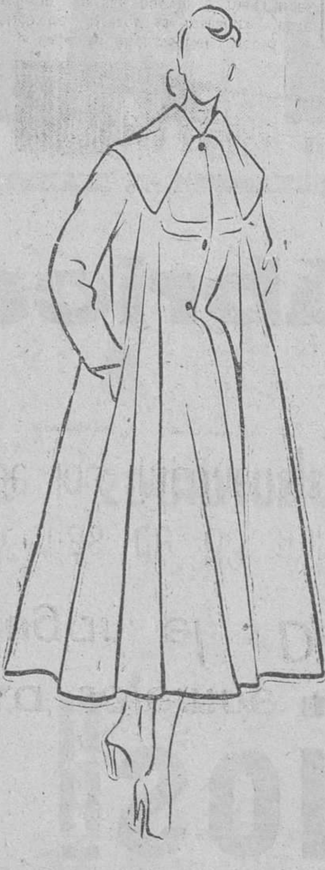
Abriego ceñido por delante (Creación Gres).

do; y esta fuerza de inspiración, que va sostenida por una ciencia y una práctica del oficio que únicamente tuvieron mujeres como madame Vionnet, las injustamente olvidadas hermanas Callot, o