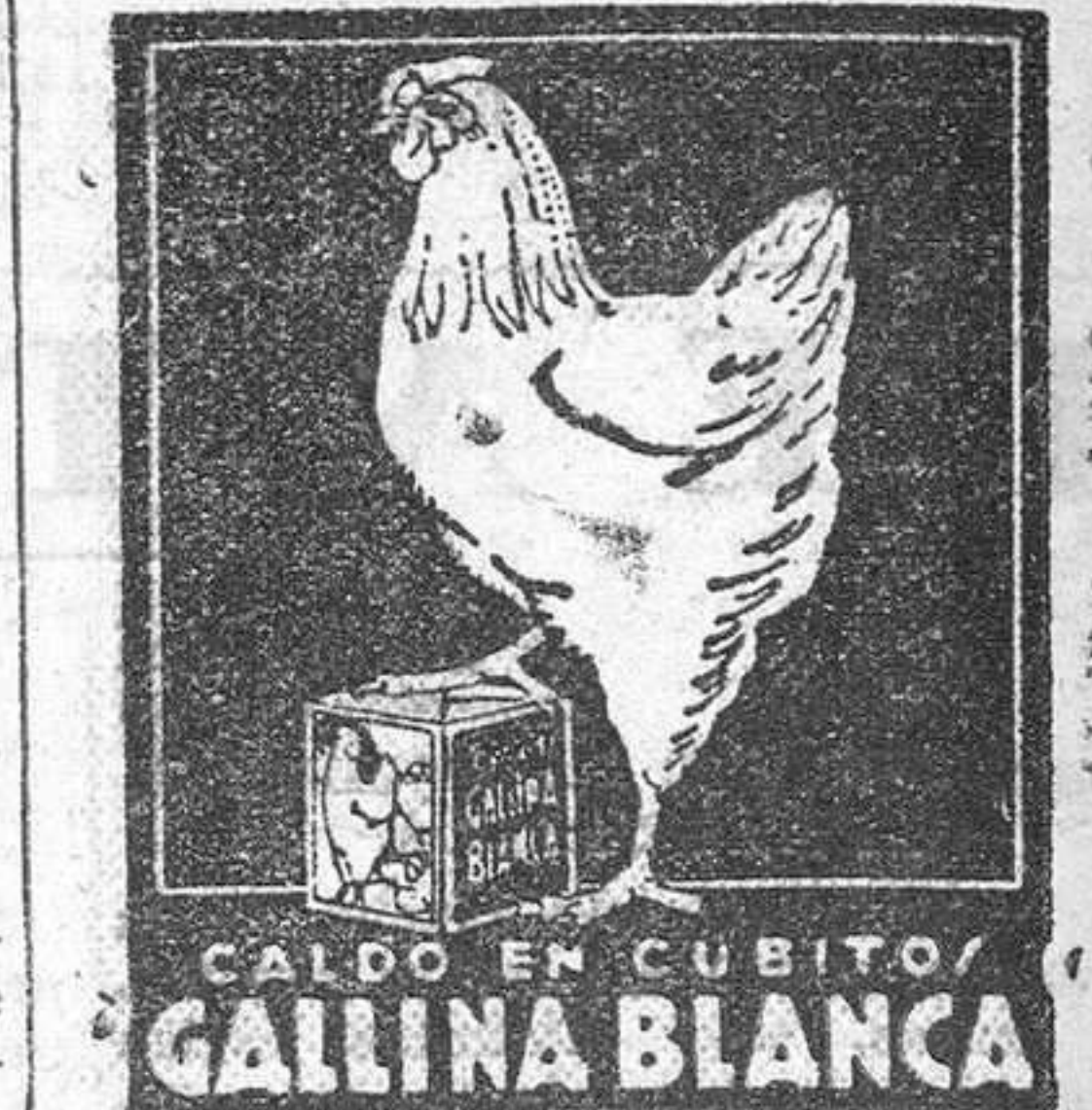
CALDO EN CUBITO GALINA BLANCA