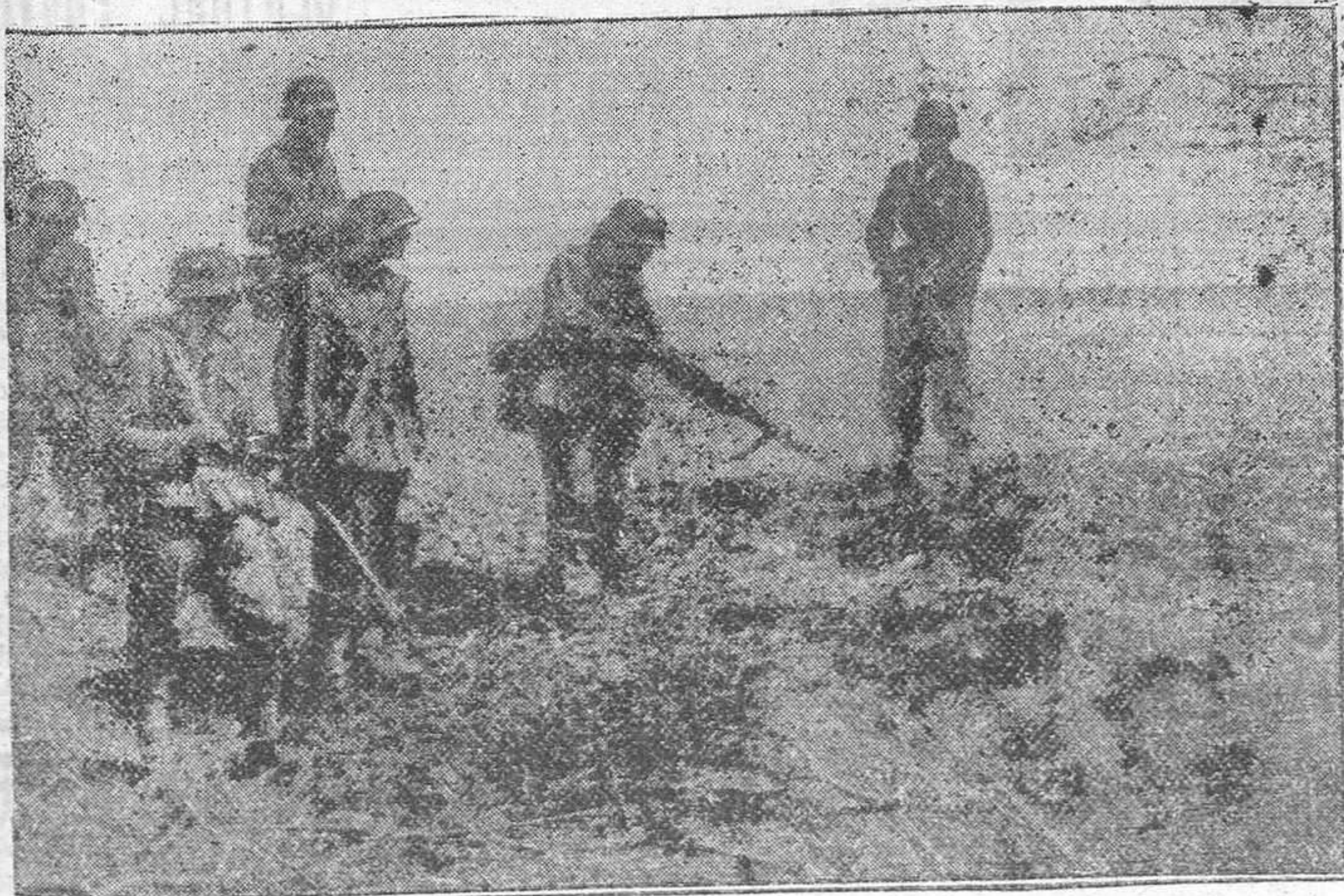
A punta de bayoneta como alimañas, han de ser sacados de su escondrijo los rojos bolcheviques. Estos que se esconden son sobre los que pesan siempre los rehdimientos de asesinatos y atrocidades cometidas. Temen que los soldados alemanes sean como ellos.