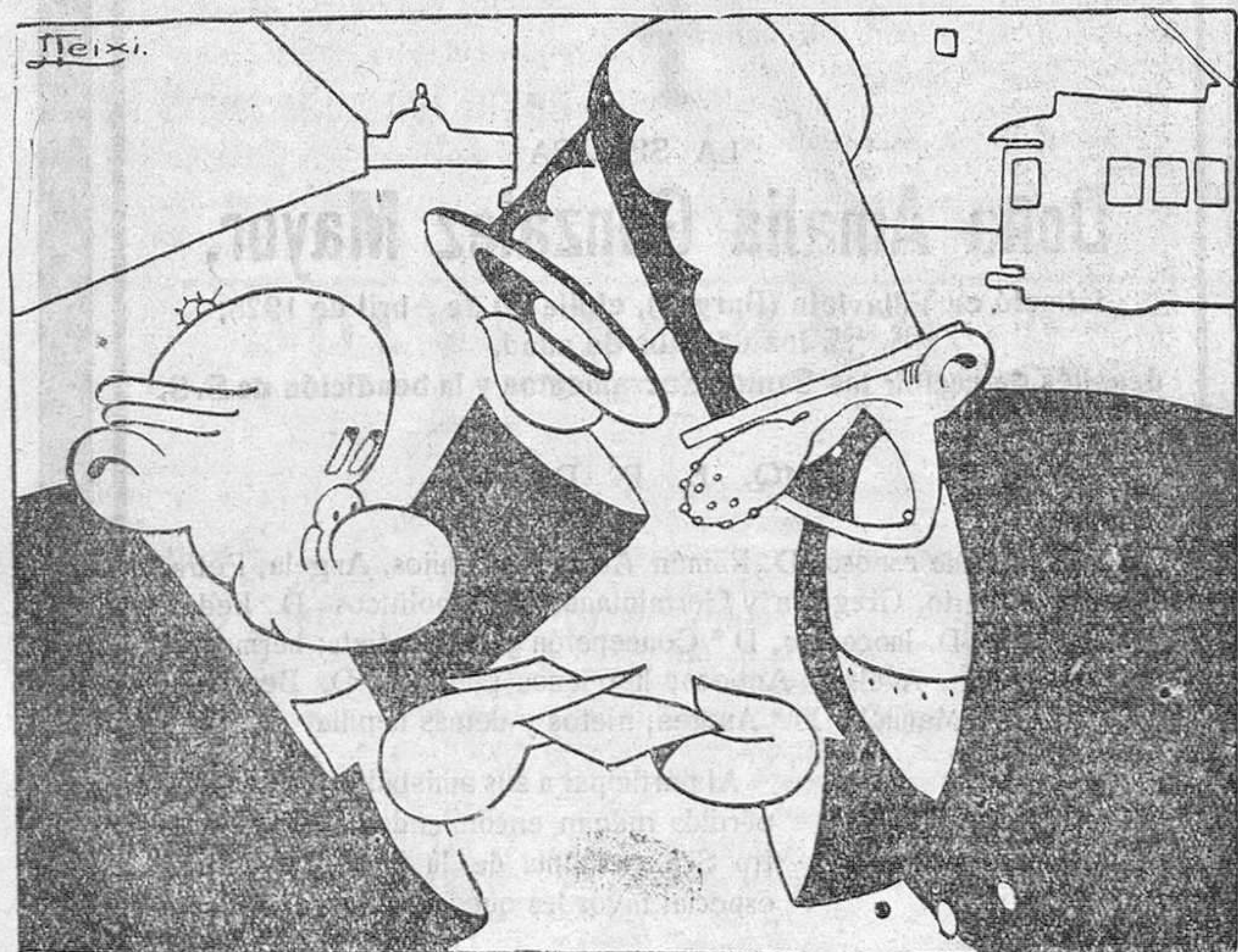
A MI, CHANTAGISTA, NO

Tome cinco duros y así podrá usted dev lverme aquellas valenticino pesetas que le presté.