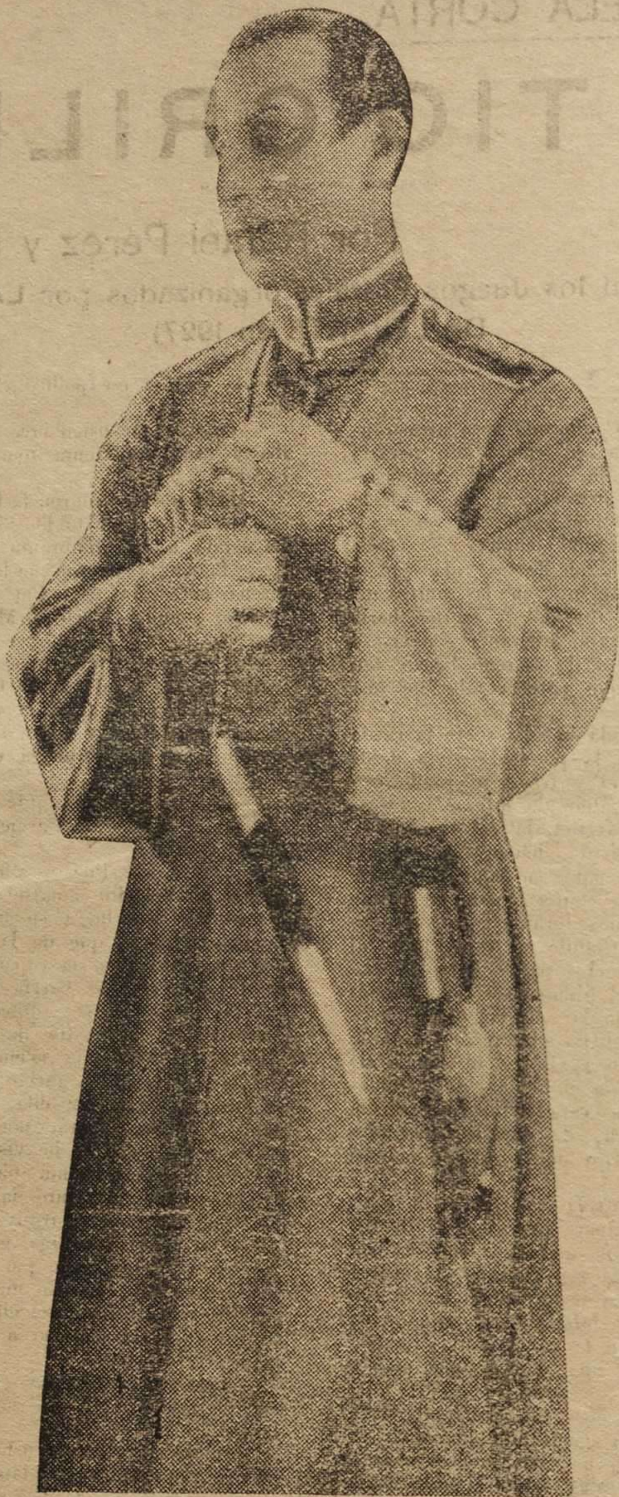
Ivan Mousjonkine que en la película ¡Rendición! obtiene un señalado triunfo juntamente con Mary Philbin