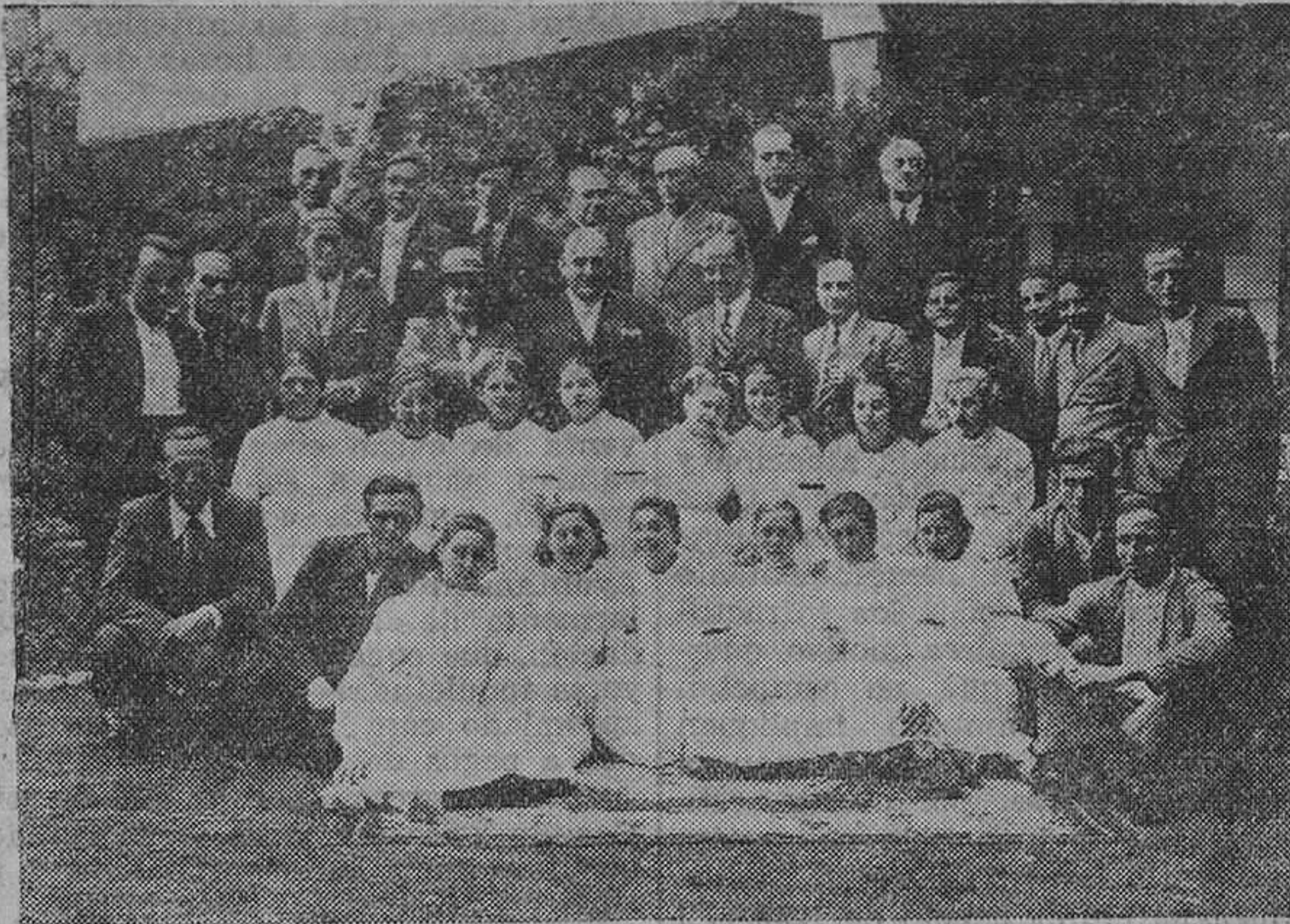
SANTONA. - Autoridades y personal en su visita al Hospital de Sangre de esta villa.