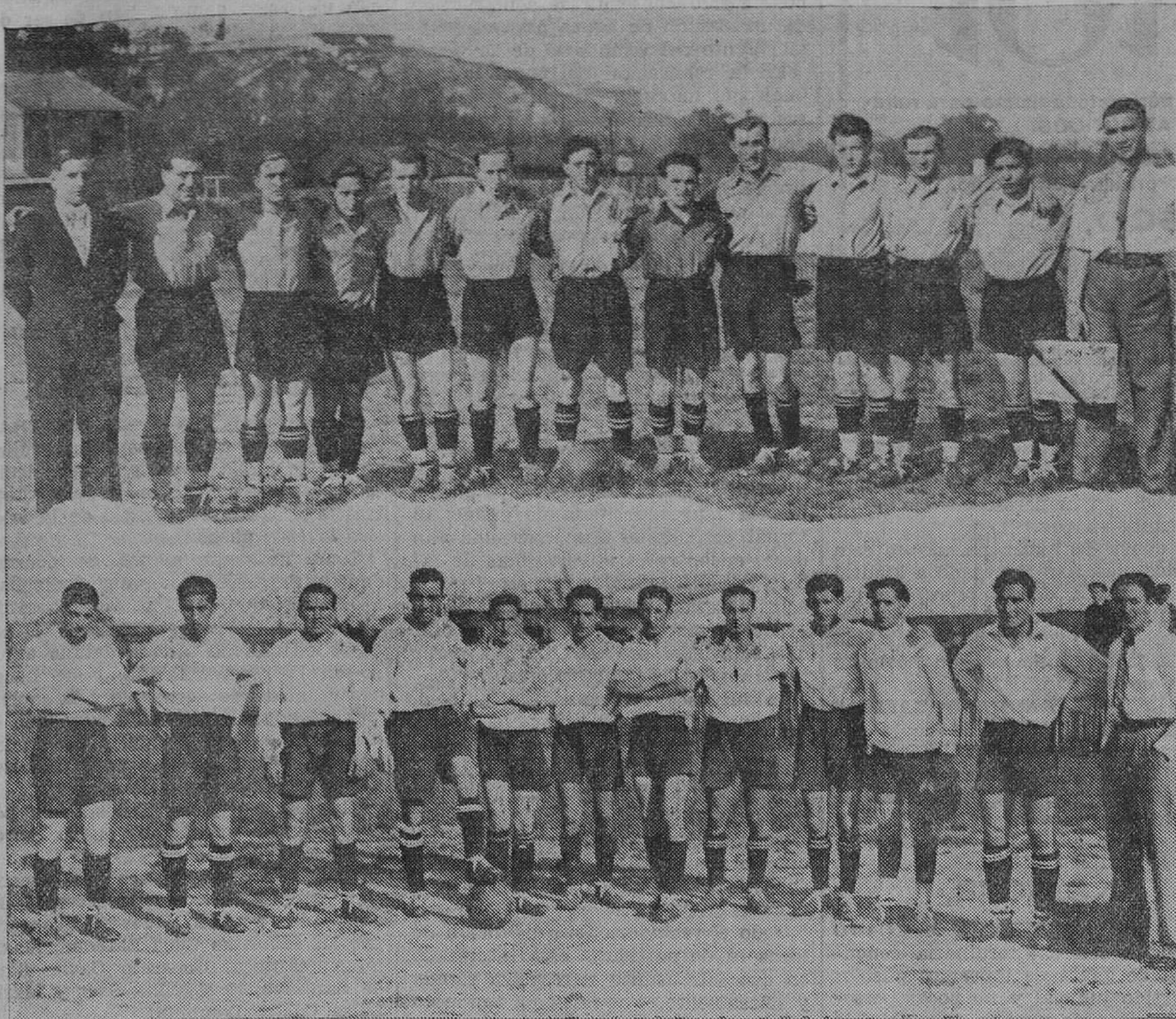
FUTBOL REGIONAL. — El Suizo y el Rayo, que jugaron el domingo la final del campeonato regional de la C, venciendo el primero por tres tantos a dos, proclamándose campeón de Cantabria.

Después de la final de la Copa de España.