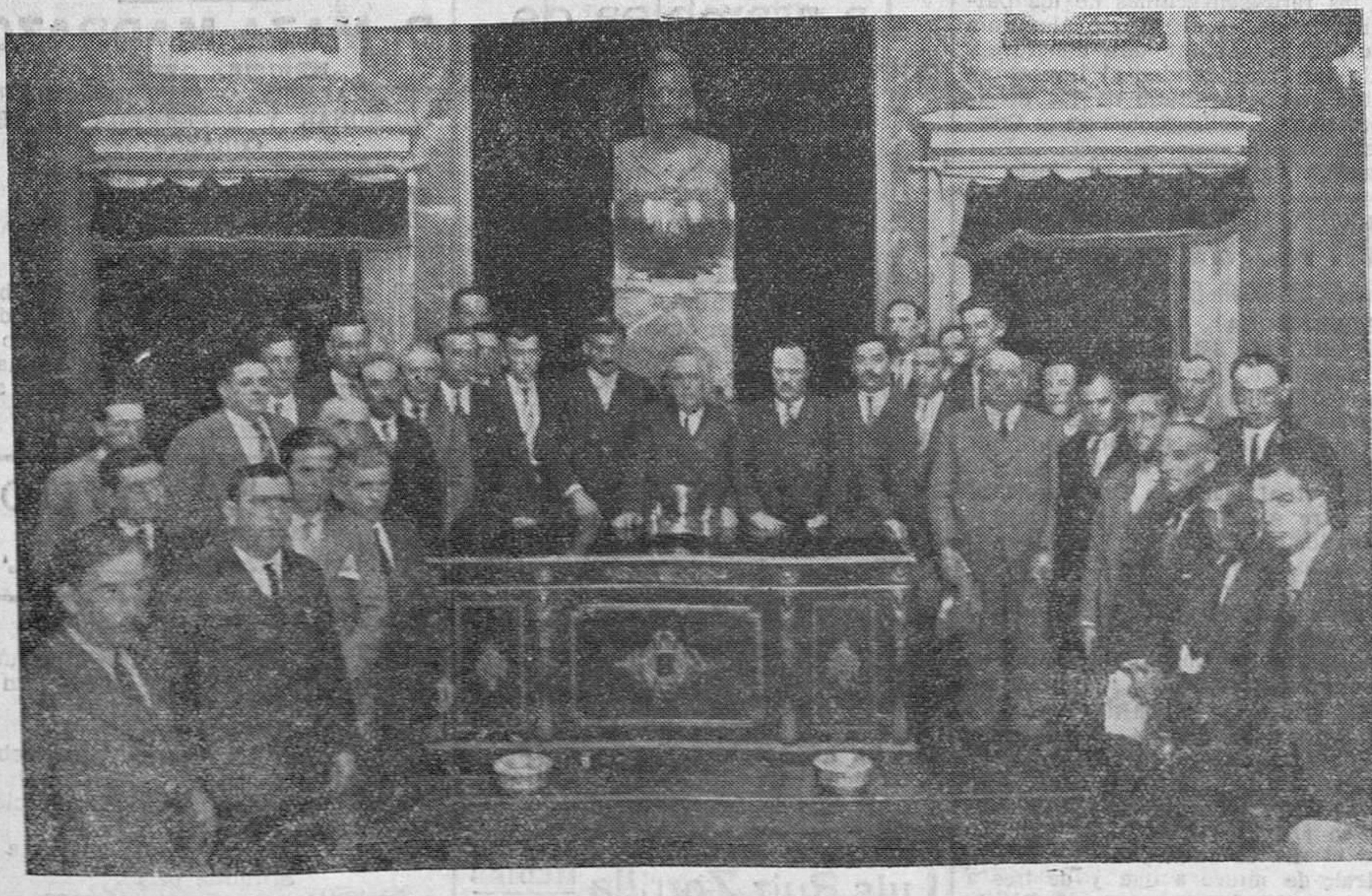
LA REUNION DE ALCALDES DE LA PROVINCIA. — El domingo último se reunieron en la Alcaldía de Santander varios alcaldes de la provincia para tratar del empréstito que desea hacer la Diputación. Hé aquí a los reunidos, presididos por el señor García, después del acto.