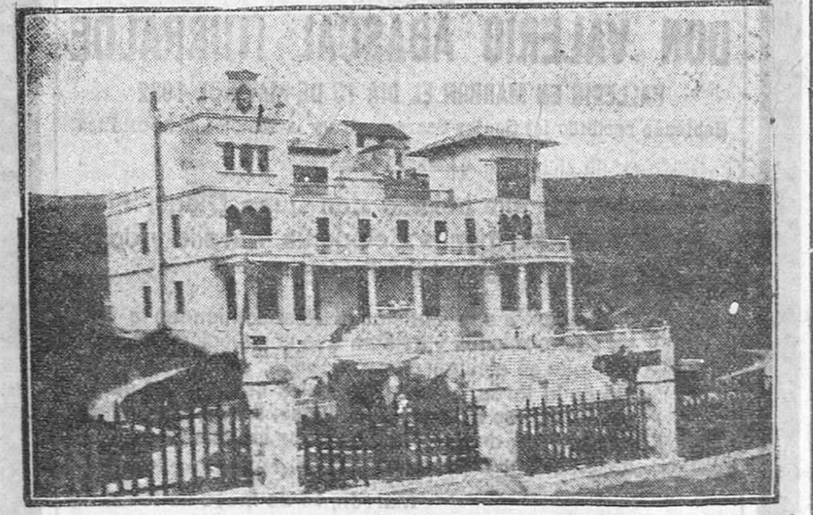
Este Sanatorio está principalmente destinado a las enfermedades de los huesos, articulaciones y articulaciones en sus afecciones tuberculosas, siendo de inmejorables resultados en los estados pre-tuberculosos, enfermedades de la nutrición, raquitismo, etc., etc. Su bella situación, hermosa instalación y confort lo hacen ser uno de los mejores de España.