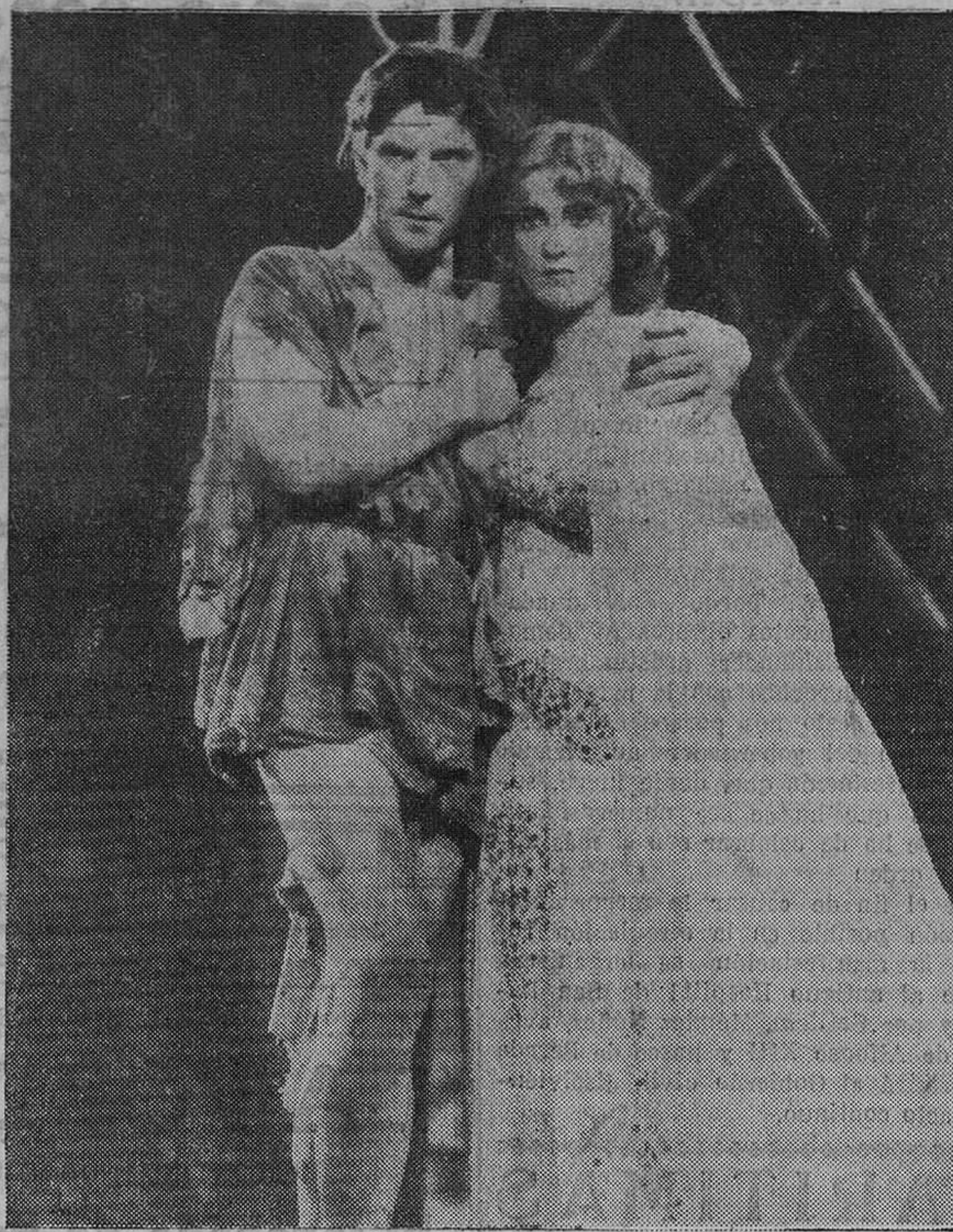
JEANNETTE MAC DONALD, la heroína de "El desfile del amor", con el báltico de la voz de oro DENNIS KING, en la ópera cinematográfica, totalmente en colores, "EL REY VAGABUNDO", que HOY se estrena, con todos los honores, en el GRAN CINEMA