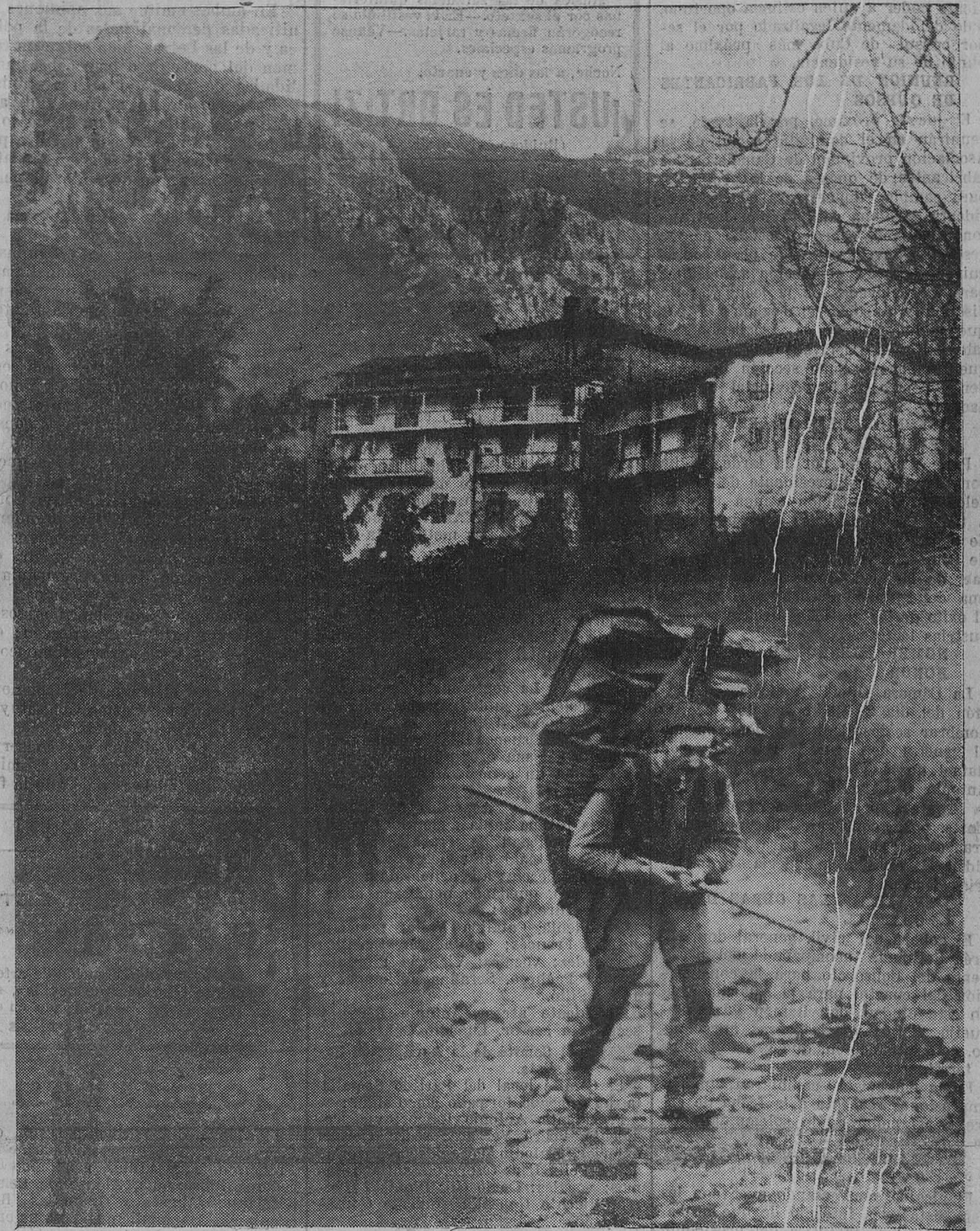
EN SAN ROQUE DE RIOMIERA.—Nuestro fotógrafo "Samot", aprovechando la visita que hizo con motivo de una información, ha sorprendido este bello trozo de paisaje fuerte, abrupto, que caracteriza a esta región, y ha recogido en su máquina fotográfica la figura típica del vaquero pasiego que en esta escena transporta en el clásico cuévano leña para su cabaña.

Pero, por desgracia, la Libertad, como un nuevo Prometeo, está en el mundo sin poderse mover a su antojo.