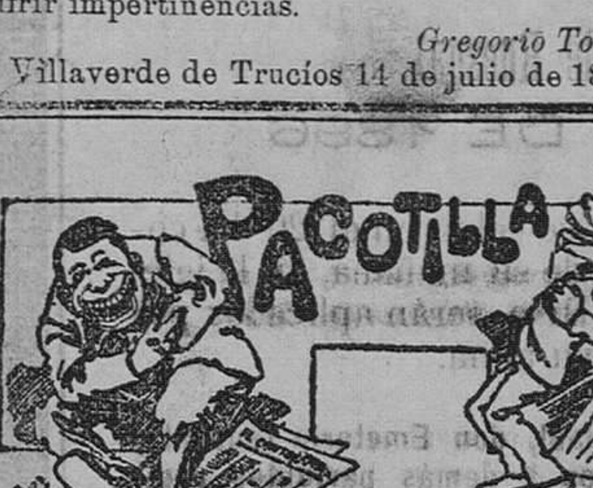
No hay ningún puerto de mar en que haya tanto que ver, que aplaudir y que admirar como este de Santander.

Villaverde de Trucios 14 de julio de 1897.