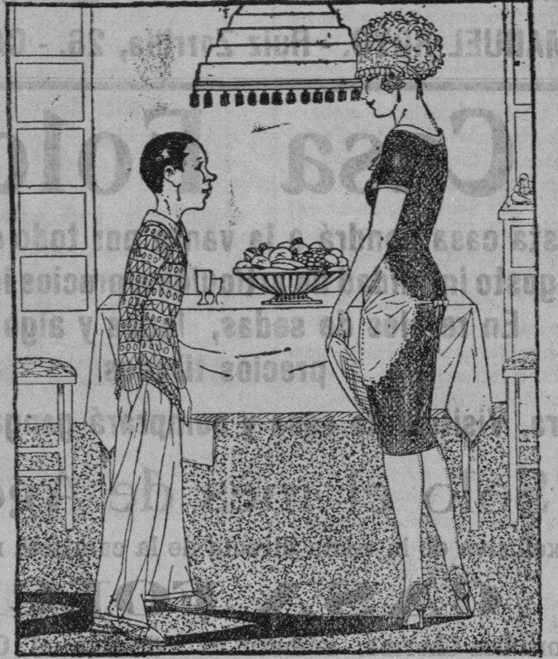
El discípulo aventajado

—¿Estás contento con tu nuevo profesor, Pedrín? —No, porque es muy embustero. Ayer decía que cuatro y siete eran once y esta mañana nos hablaba de que dos y nueve eran once.