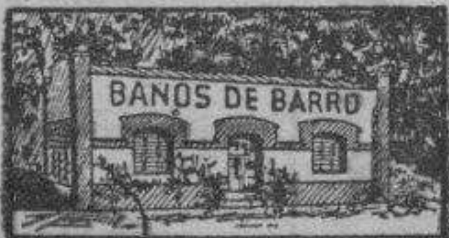
Baños de Barro

Agua clorurada-sódica, hiper- termal, sulfato cálcico, mag- nesiano y ferro silíceo, de gran mineralización y muy radiactiva ESPECIALÍSIMAS para la curación del artrismo y reumatismo en todas sus formas, principalmente en la ciática, gota, esqueletismo, contracturas, luxaciones, fracturas, heridas (en particular de arma de fuego), úlceras, gripe mal curada, etc. etc. Aplicaciones completas de LODOS VEGETO-MINERALES NATURALES únicos en España. HOTEL DEL BALNEARIO - Precios moderados, excelente trato, todo confort Estancia tranquila, clima muy saludable, altura del establecimiento sobre el nivel del mar 651 metros. - Vele a la estación de CALAHORRA. - Temp- orada 14 Junio a 30 Septiembre - Detalles, folletos y tarifas: Adm. del Balneario