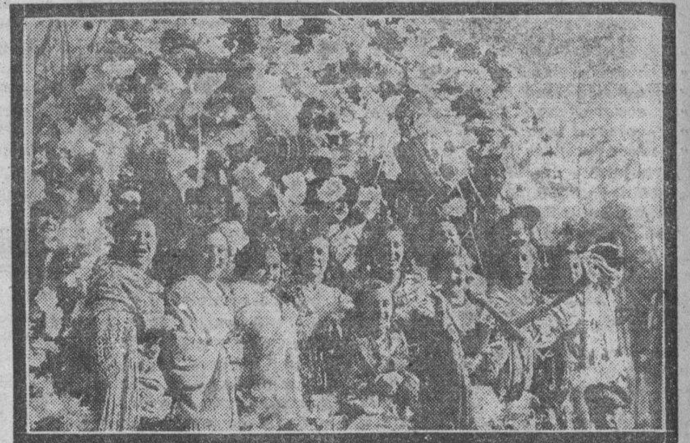
Una carroza engalanada con bellas mujeres.