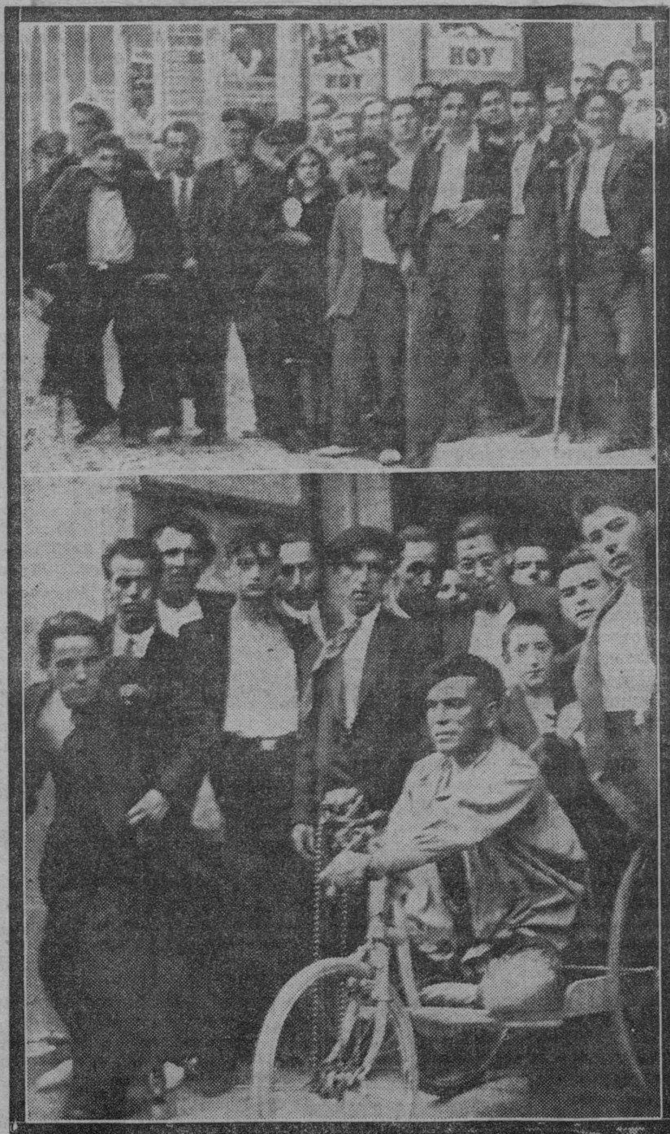
Dos grupos de inválidos al salir de la asamblea celebrada el pasado domingo en el Cinema Aragón, acto en el que los reunidos tomaron importantes acuerdos.