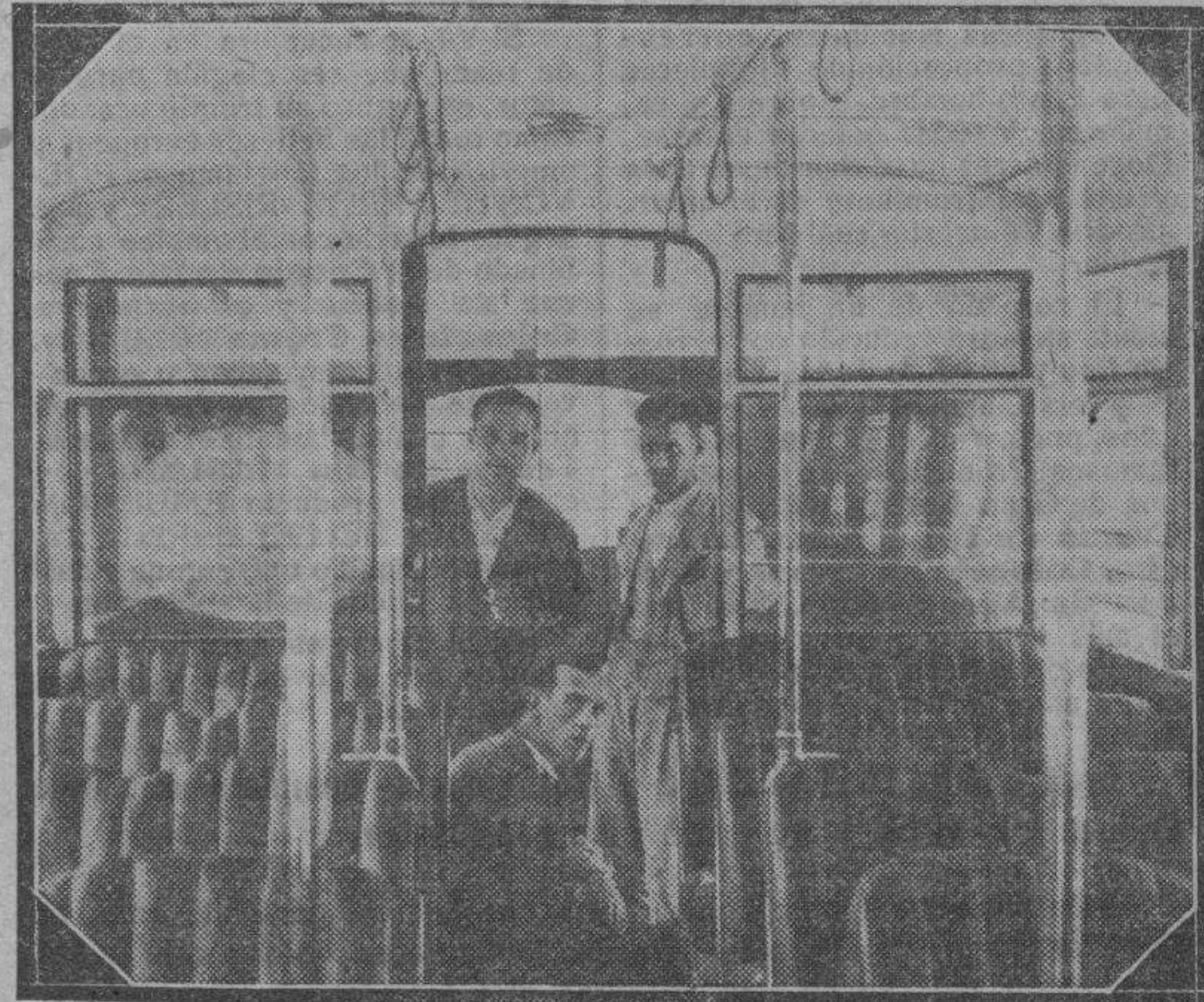
La comodidad de los PULLMAN que hacen servicio a las Delicias puede verse en este aspecto del interior de uno de estos autobuses gigantes.

Será la mejor manera de compensar los sacrificios de unos zaragozanos que han trabajado por dotar a la ciudad de la mejor línea de autobuses urbanos.