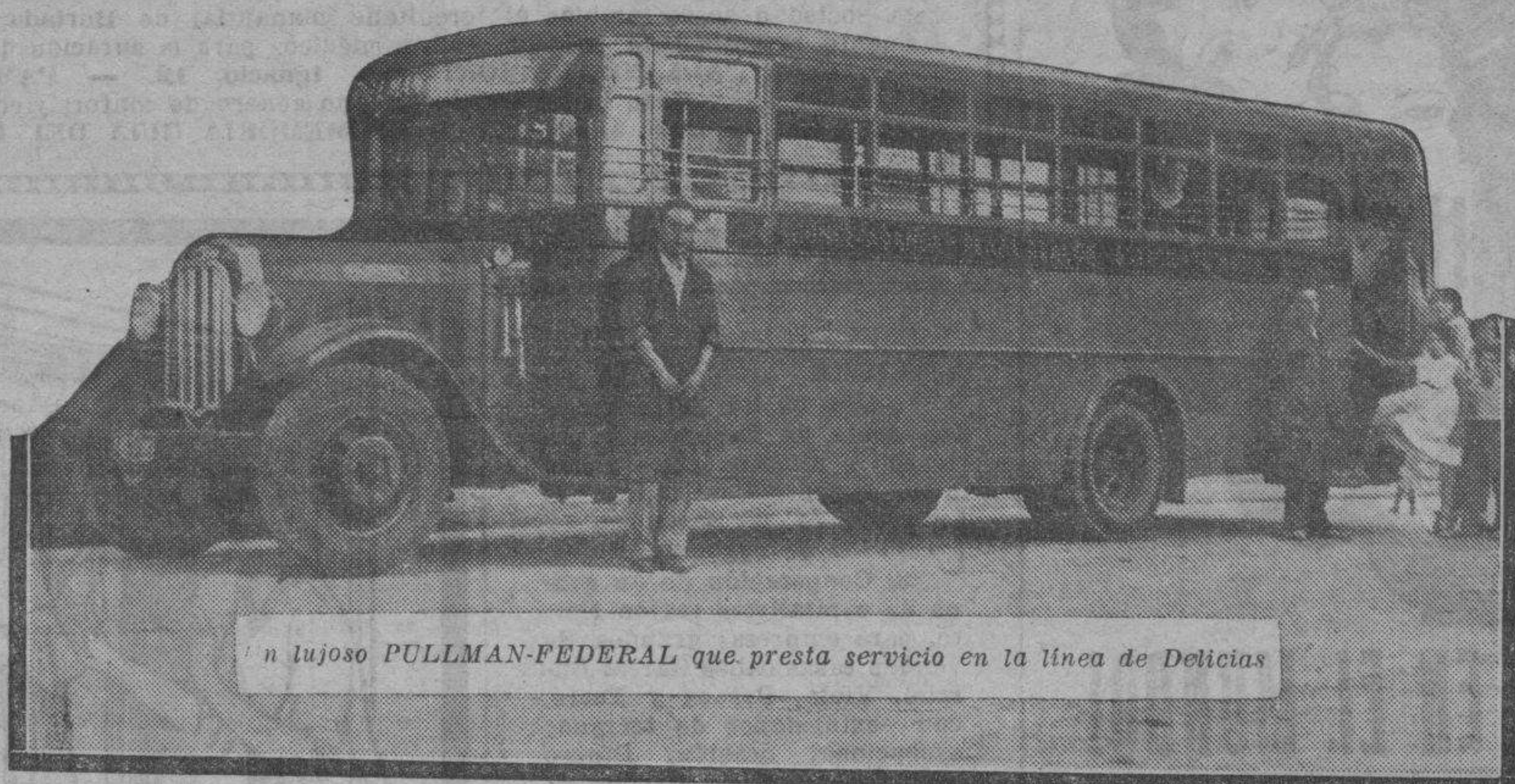
Un lujoso PULLMAN-FEDERAL que presta servicio en la línea de Delicias

Los nuevos coches lanzados para su servicio por la Empresa AUTOBUSES "PULLMAN" DELICIAS son