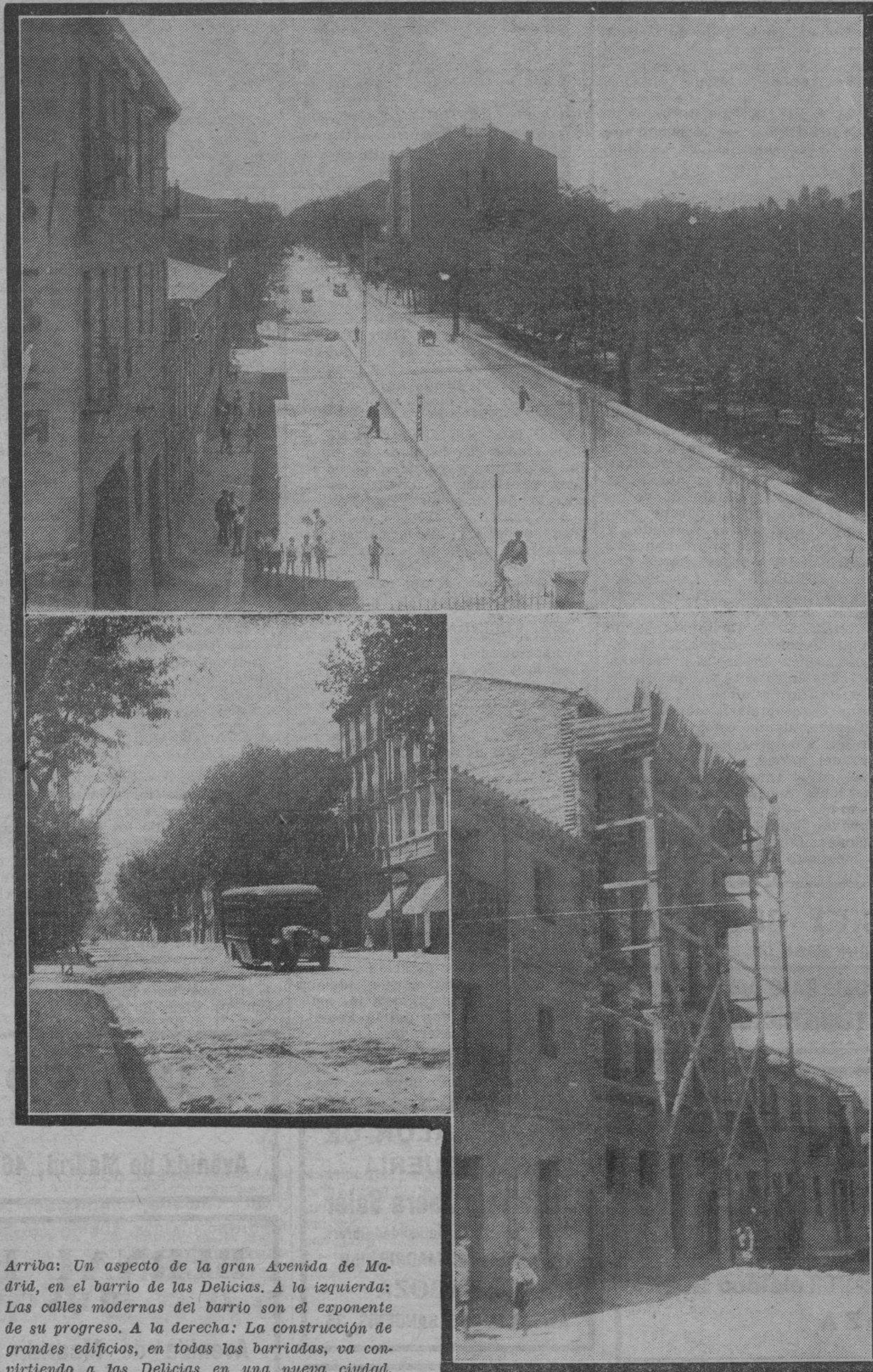
Arriba: Un aspecto de la gran Avenida de Madrid, en el barrio de las Delicias. A la izquierda: Las calles modernas del barrio son el exponente de su progreso. A la derecha: La construcción de grandes edificios, en todas las barriadas, va convirtiendo a las Delicias en una nueva ciudad.

—Una necesidad imperiosa—nos dicen—es la de que se lleve a cabo el ensanche del paso a nivel, pues debido a la escasa anchura de éste y al tráfico rodado hay a cada mo-