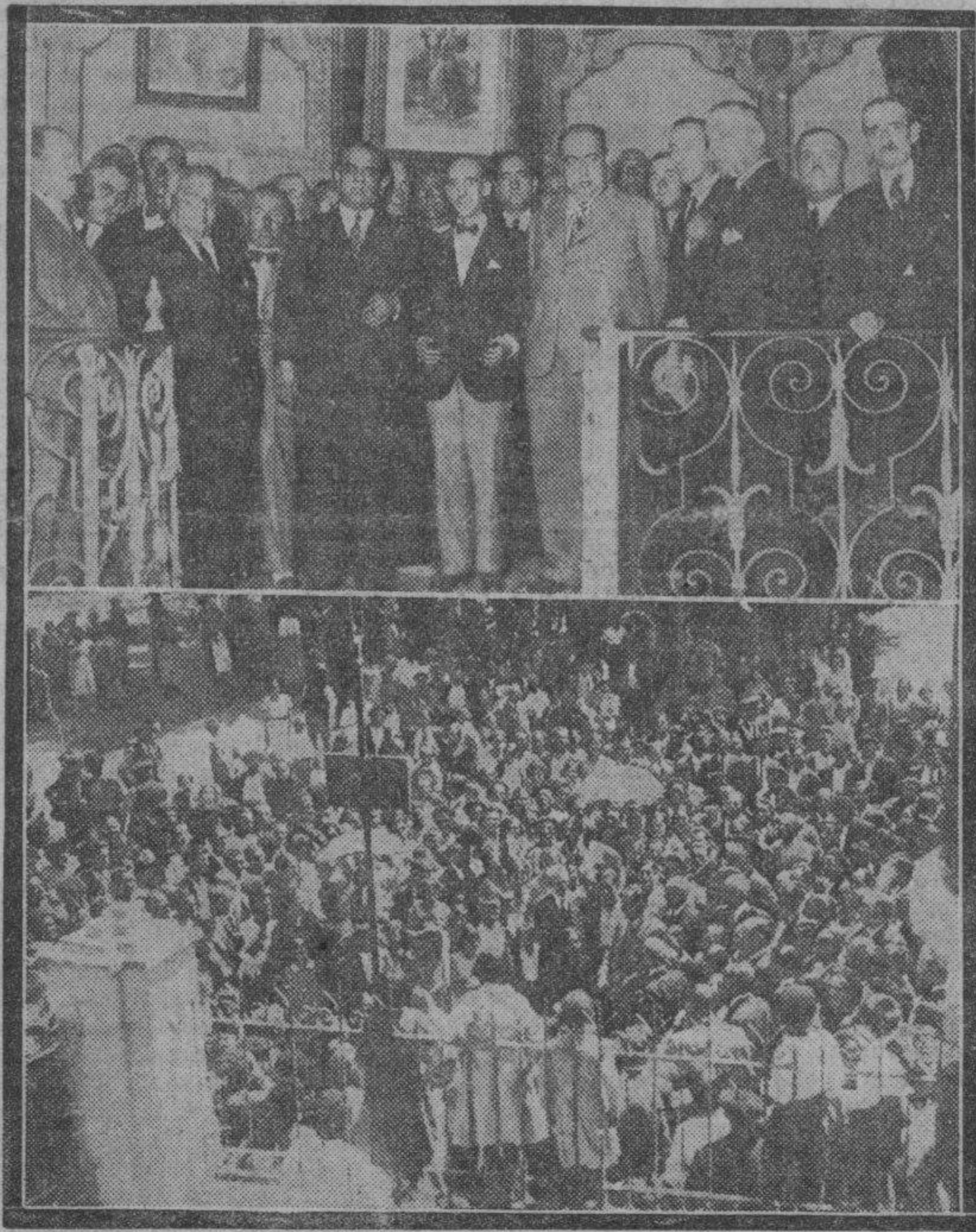
Arriba: El director general y autoridades en la recepción celebrada en el Ayuntamiento de Cariñena con motivo de la inauguración de la Estación Enológica. Abajo: Descubrimiento de la lápida que da el nombre de Blasco Ibáñez a la más moderna vía de Cariñena.

Con asistencia del director general de Agricultura, D. Julio Tortuero, se inauguraron el domingo, en Cariñena, la Estación Enológica y la Avenida de Blasco Ibáñez