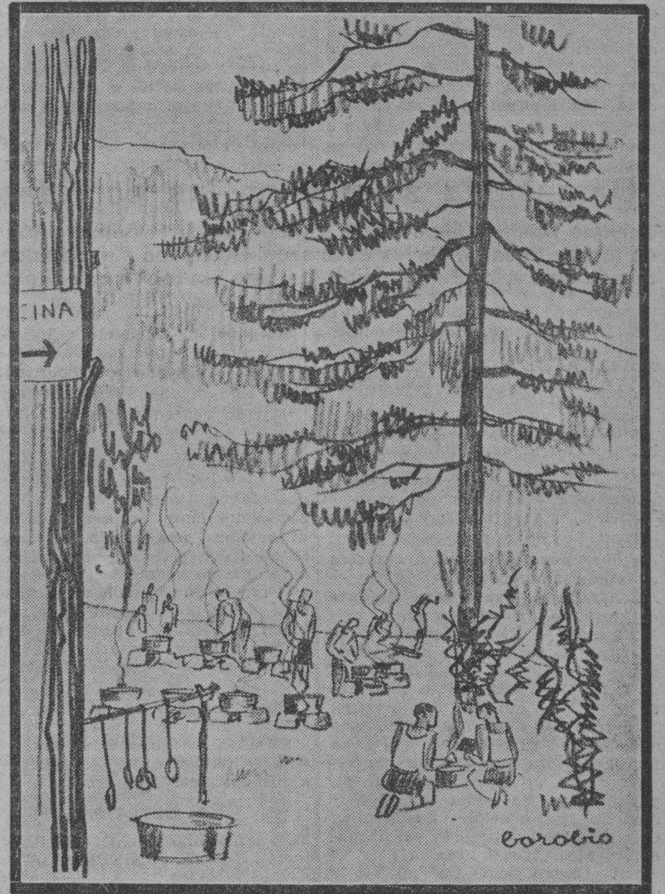
Apunte de Borobio obtenido en el campamento de los exploradores, en Escarilla (valle de Tena), y que reproduce acertadamente la instalación de cocinas realizada por los excursionistas y el momento laborioso de preparar la comida para los pobladores del campamento.

ra llegar a Bayona, carretera adelante nos fuimos como toreros de campanillas que no tienen fecha libre durante el ajetreo veraniego. Y... despachamos la miurada. "Miurada", que es tanto como decir "mansada". Toracos broncotes, recelosos, que apenas querían trato con los picadores y que se emplazaban sin querer embestir a los engaños de la torería de a pie. Un regalo.