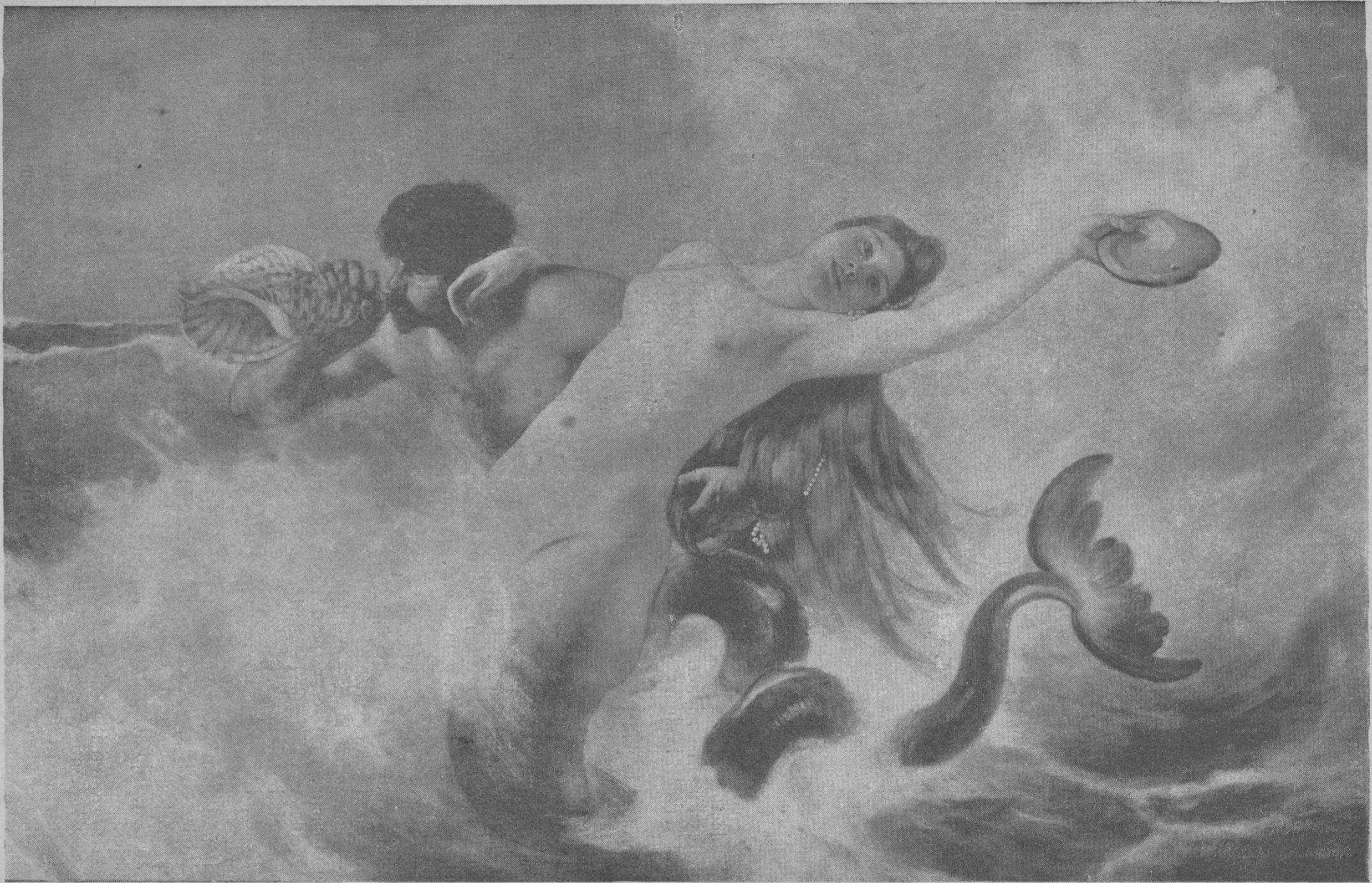
La Sirena y el Tritón.