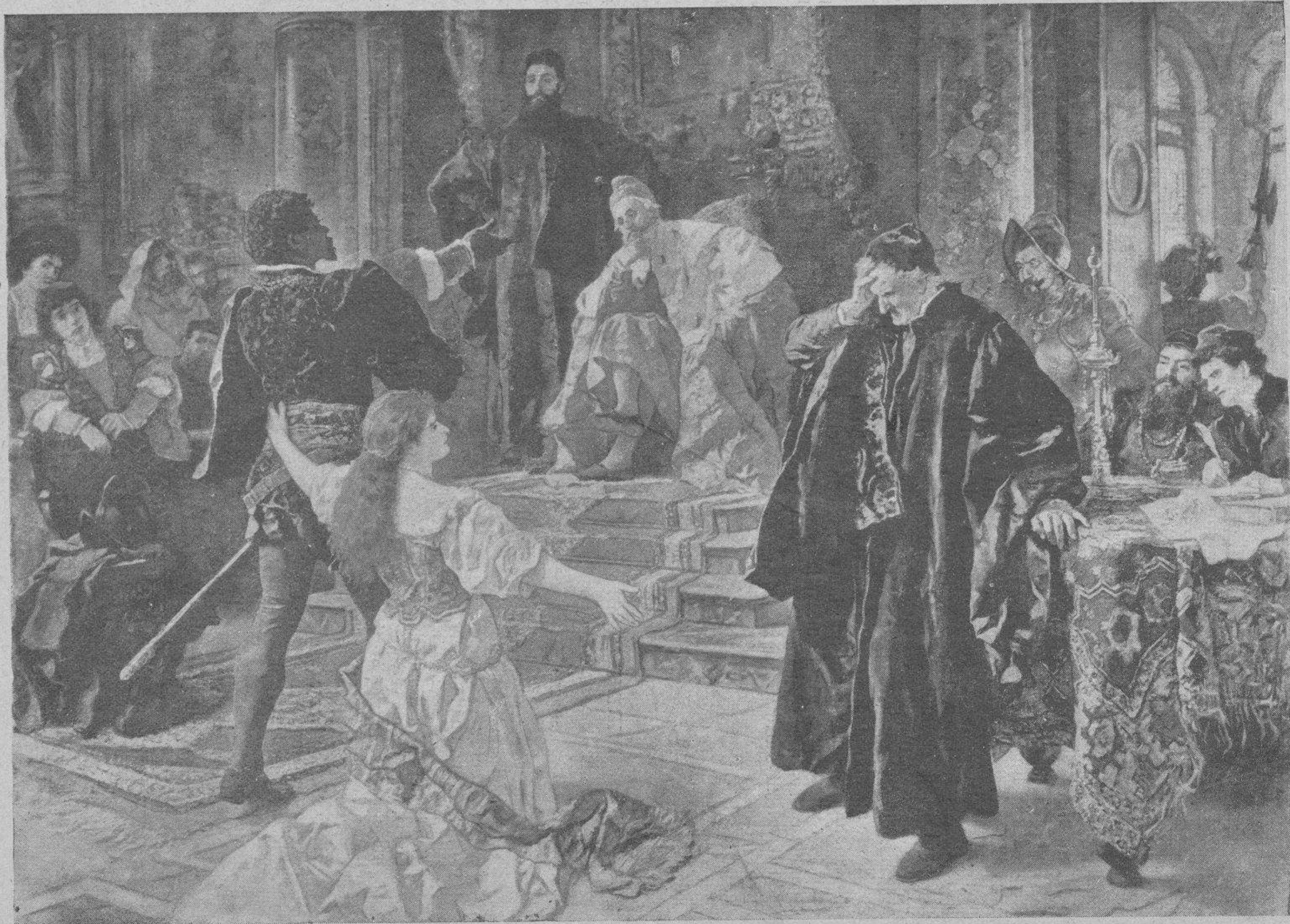
Cuadro de Becker.