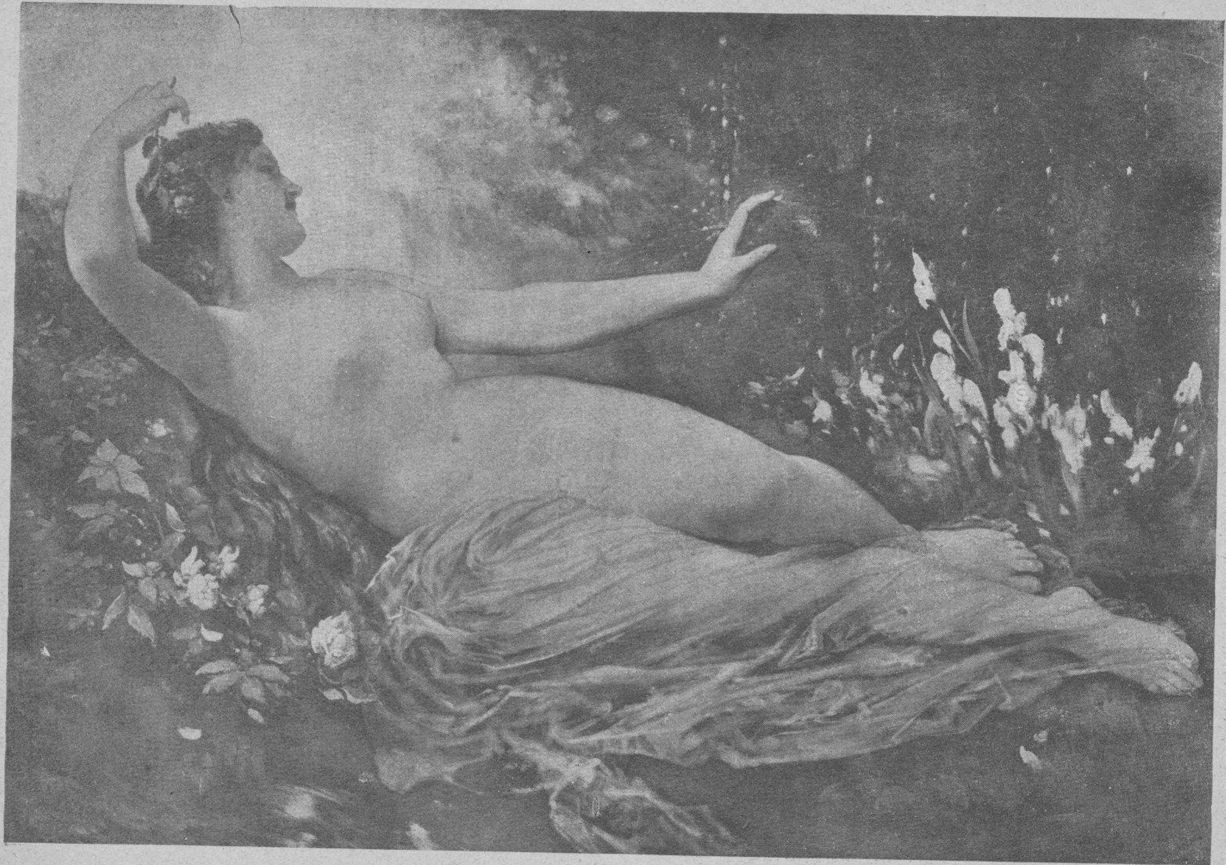
La Sirena de Tivoli.