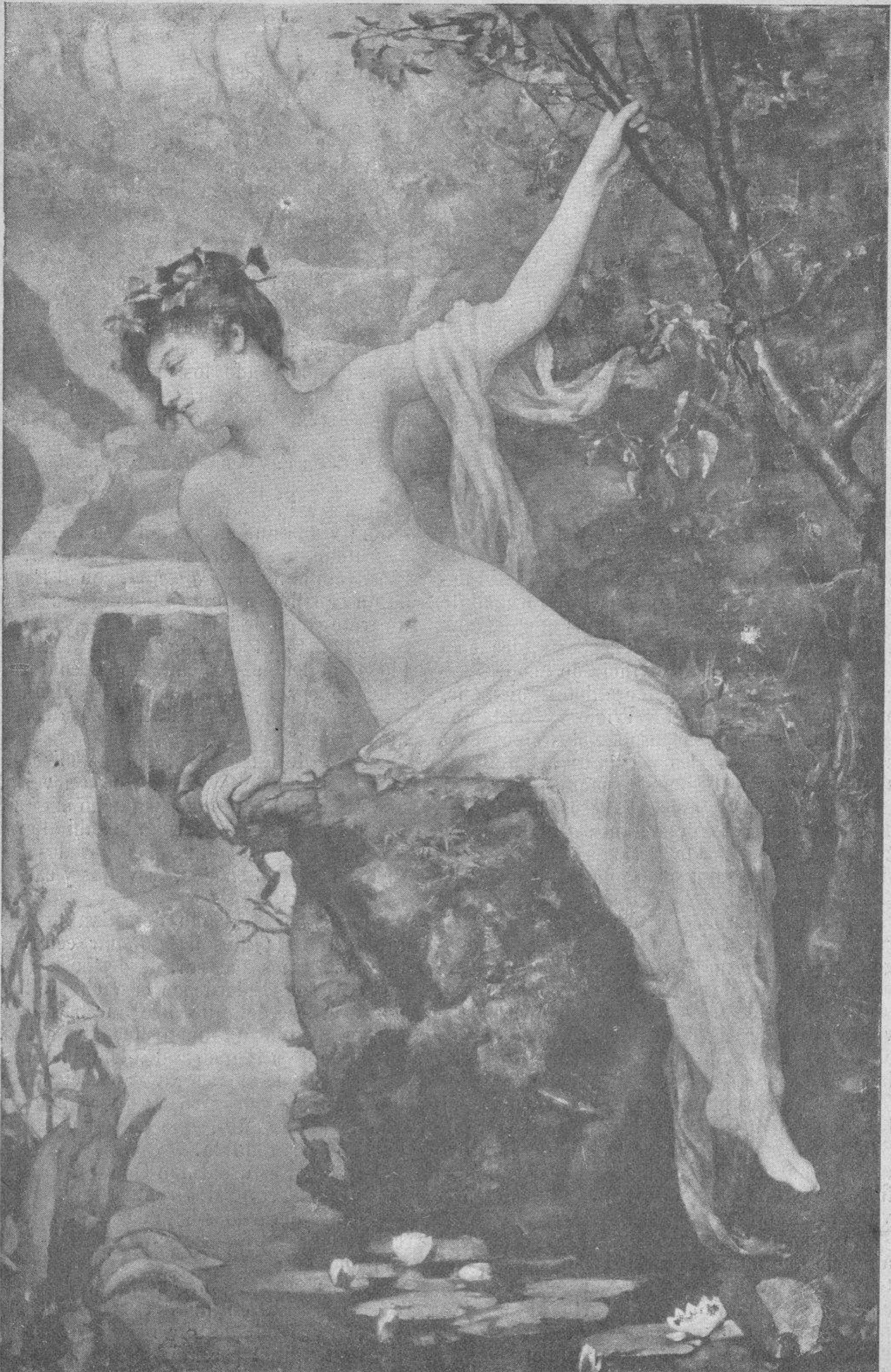
Cuadro de H. Rac.