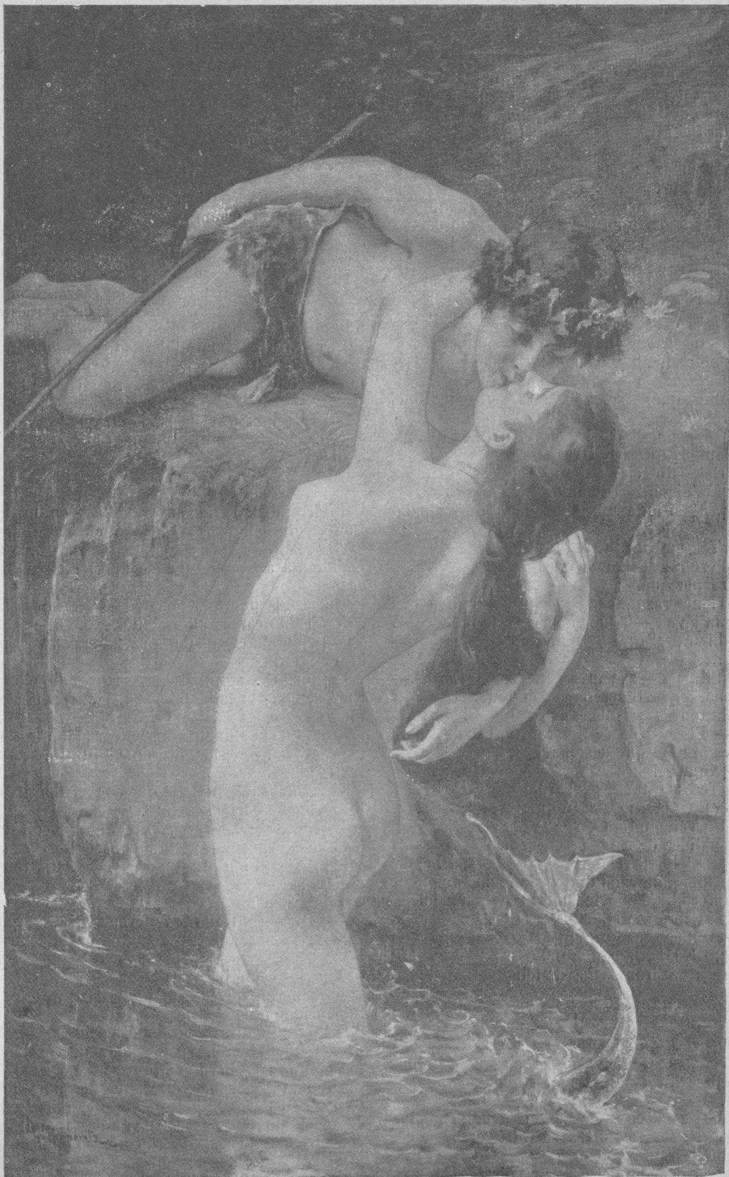
Cuadro de G. Pepperitz.