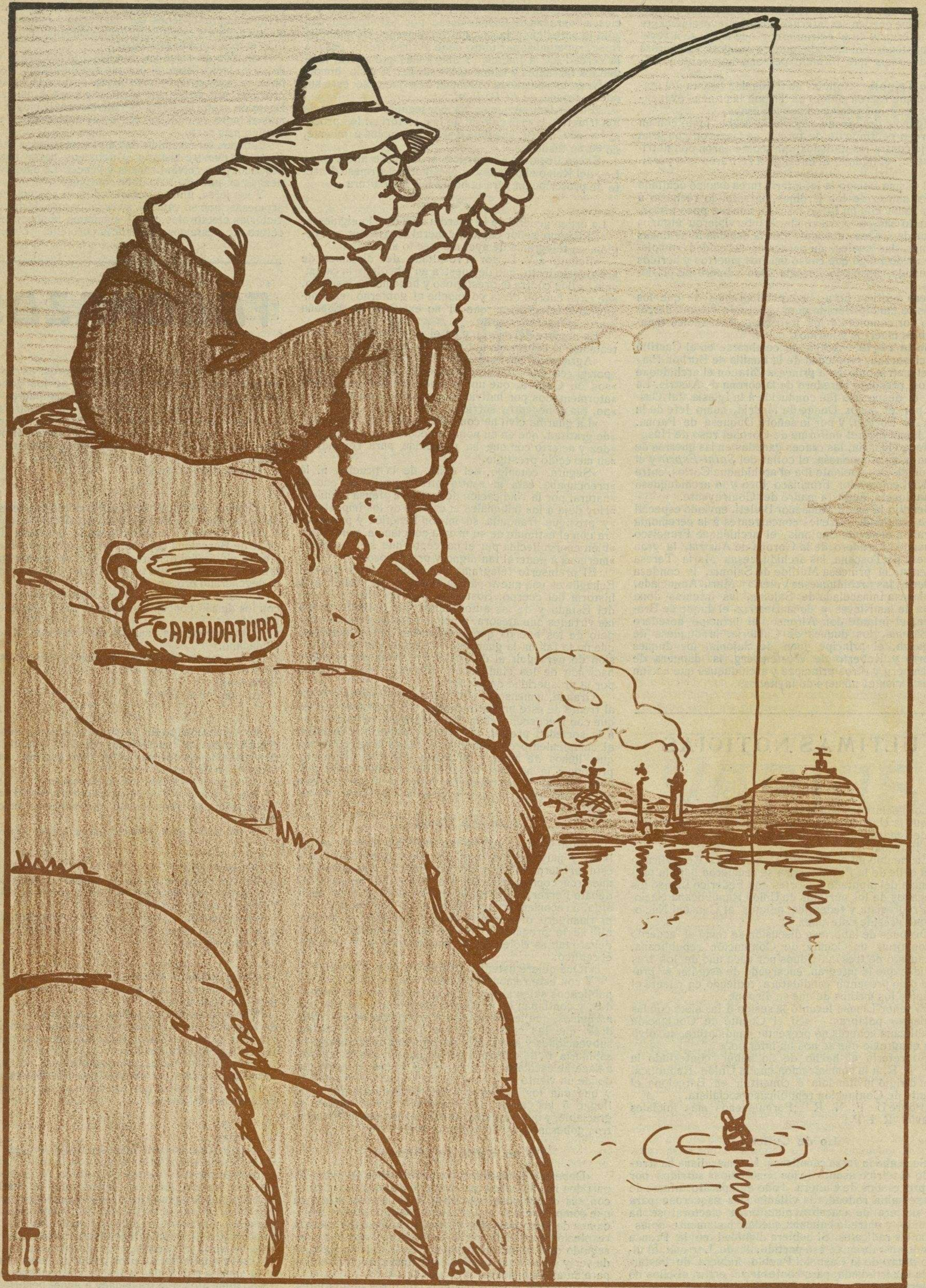
TRABAJO DE JOB

Este tío está pescando «hombres honrados» para llenar la candidatura radical.