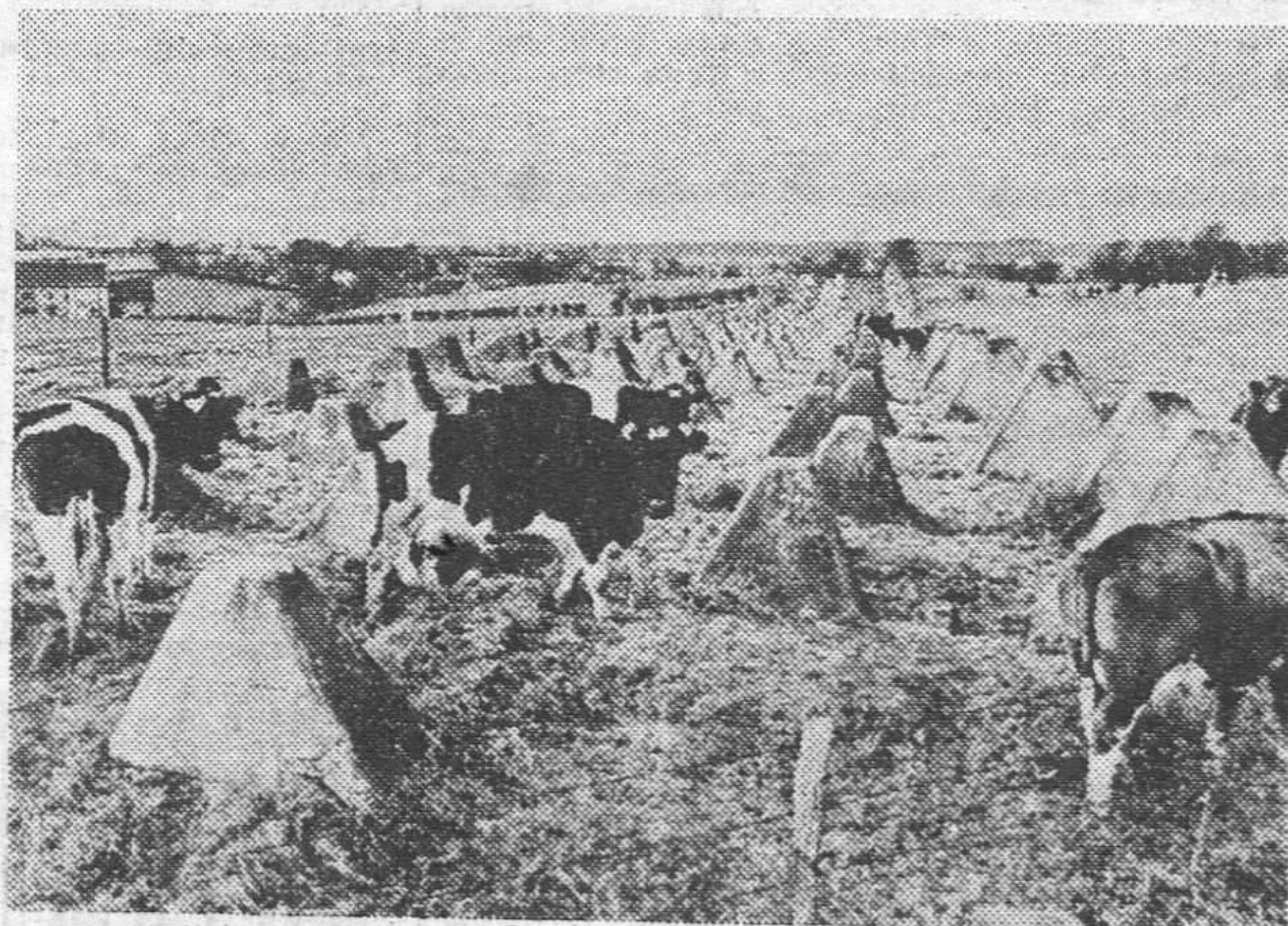
Nada, evidentemente. Por ello pastan tan pacíficamente en medio de estos bloques de cemento anti-tanques, que «adornan» los alrededores de la ciudad alemana de Aquisgrán. Son las únicas que nunca se molestan por su fea presencia, ya que los hombres, al pasar, prefieren dirigir su vista hacia el otro lado, bien por sus amargos recuerdos o bien por pura aversión estética.