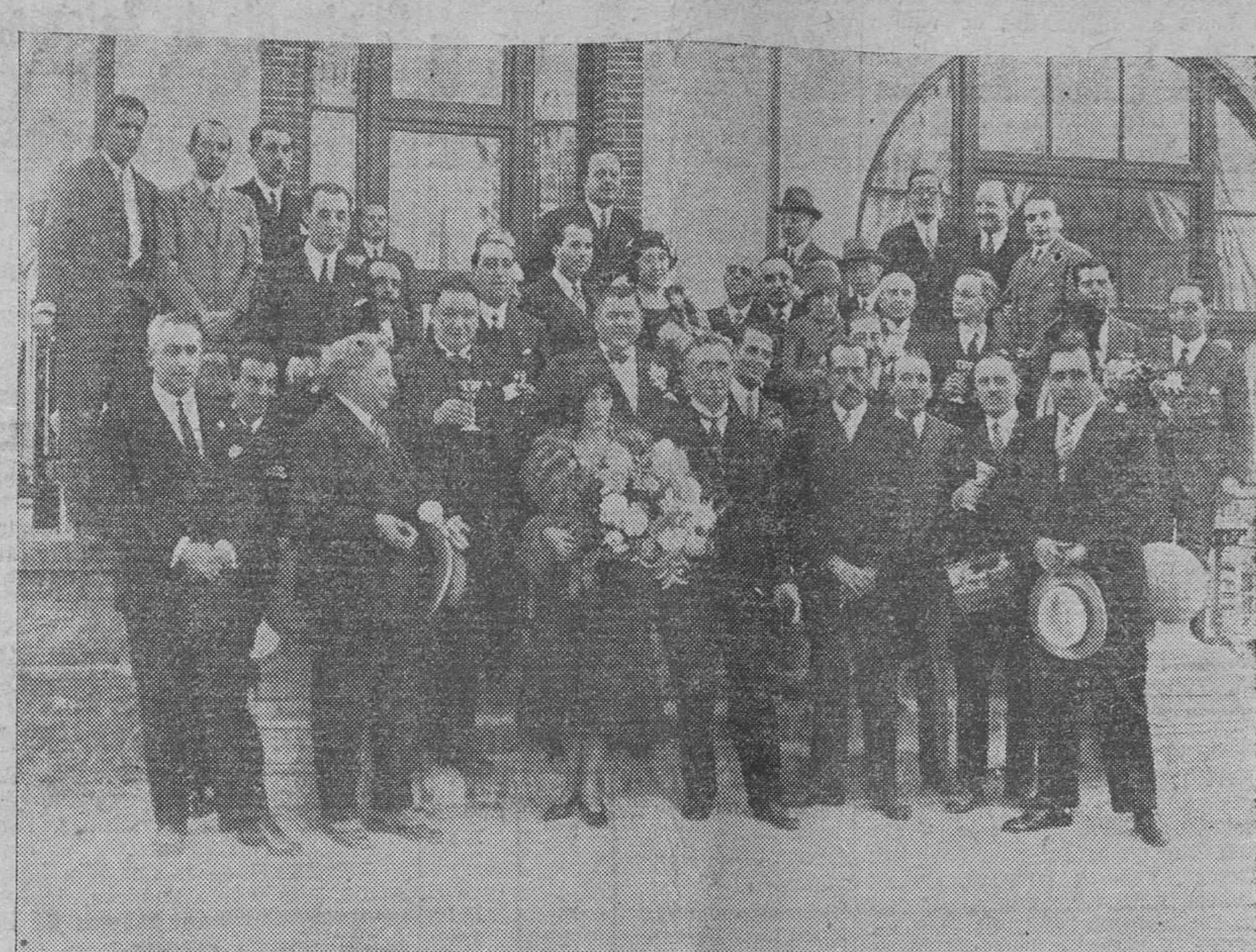
Un grupo de visitantes del Touring-Club, con su presidente

Según decreto fecha 3 de Octubre último, el Gobierno provisional de la Argentina ha derogado el decreto de 14 de Mayo de 1925 y disposiciones complementarias que prohibían la importación de las frutas procedentes de países infestados de la mosca mediterránea. Las importaciones que en lo sucesivo se hagan de dichos países deberán someterse a inspección y en caso eventual a cuarentena. Todas las expediciones de fruta fresca de los países infestados deberán ir acompañadas de un certificado fitopatológico del país de origen, visado por el consular argentino. Queda prohibida la importación de fruta fresca a granel. Dicho decreto determina, además, las dimensiones máximas de las cajas envase de dicha fruta, que no deberán ser superiores a 30 centímetros de altura por 99 de largo y 54 de ancho, consintiendo únicamente por el año en curso la entrada de las manzanas de Norteamérica en bultos. También se revoca el decreto de 21 de Agosto que prohibe hasta el 31 de Diciembre del corriente año la importación de patatas, quedando, por consiguiente, autorizada su entrada en territorio de la República.