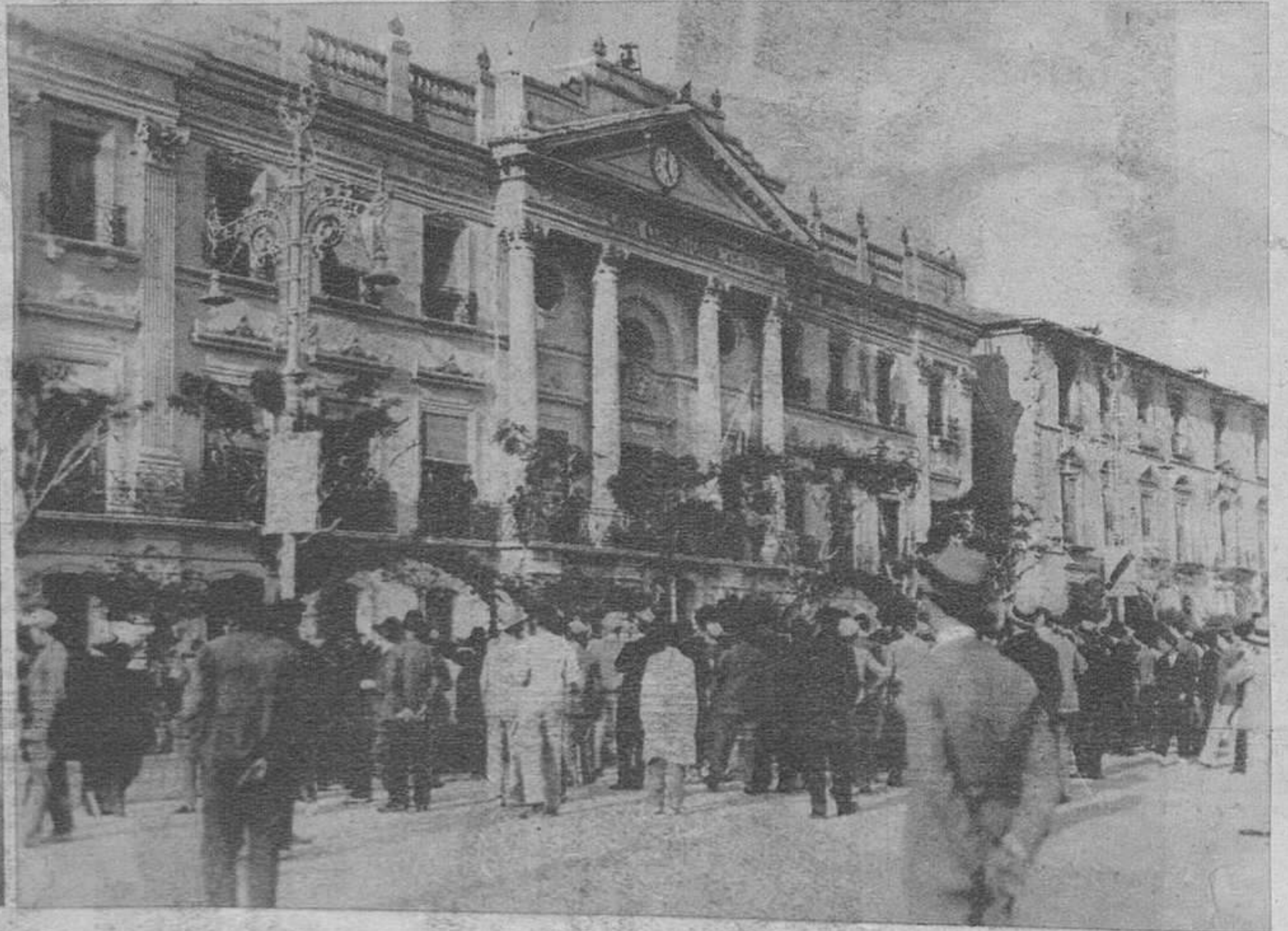
Momento de izarse la Bandera republicana en el Ayuntamiento de Murcia.