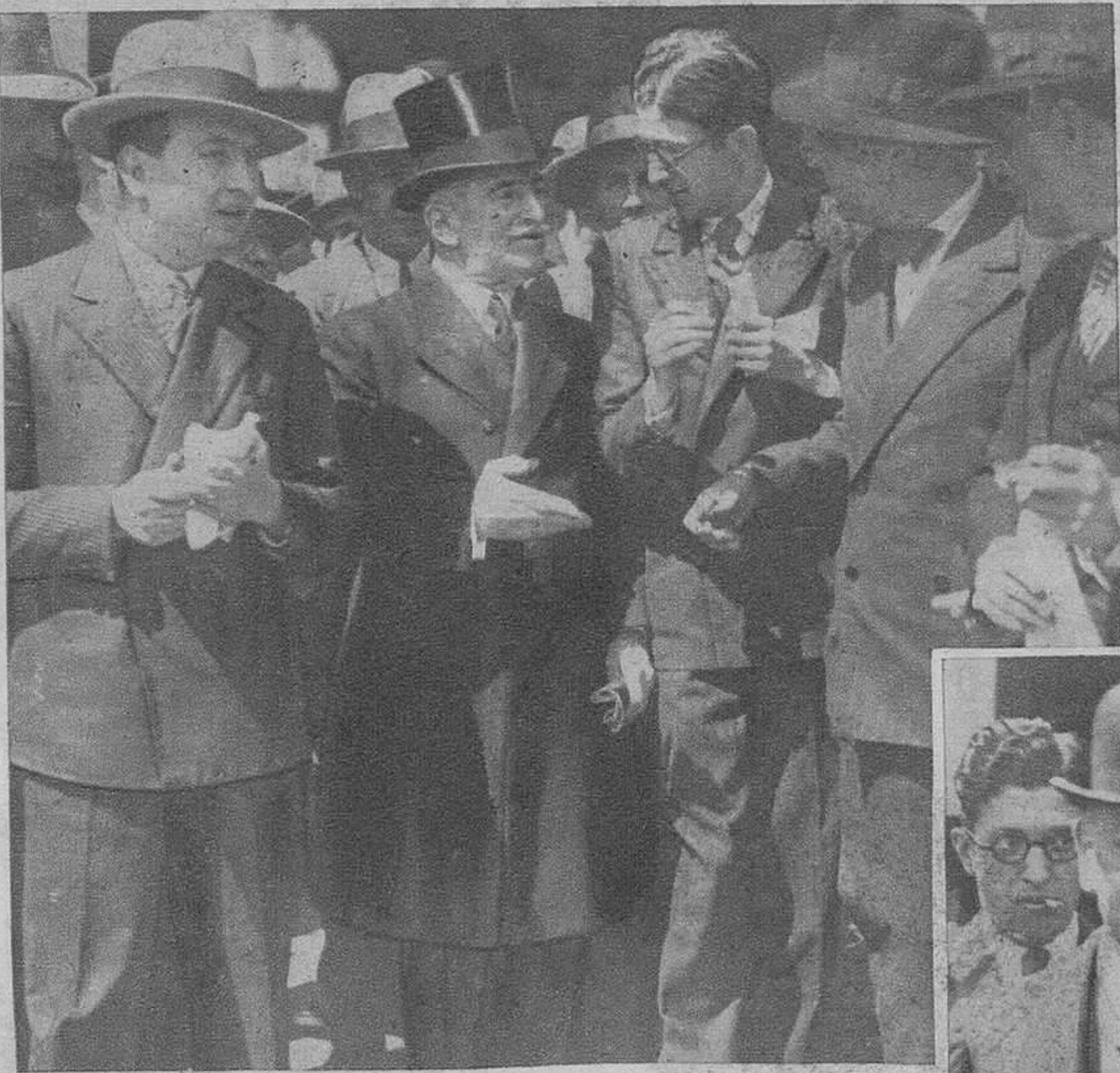
El Jefe de Gobierno Almirante Aznar.

Los últimos ministros de la Monarquía saliendo de Palacio