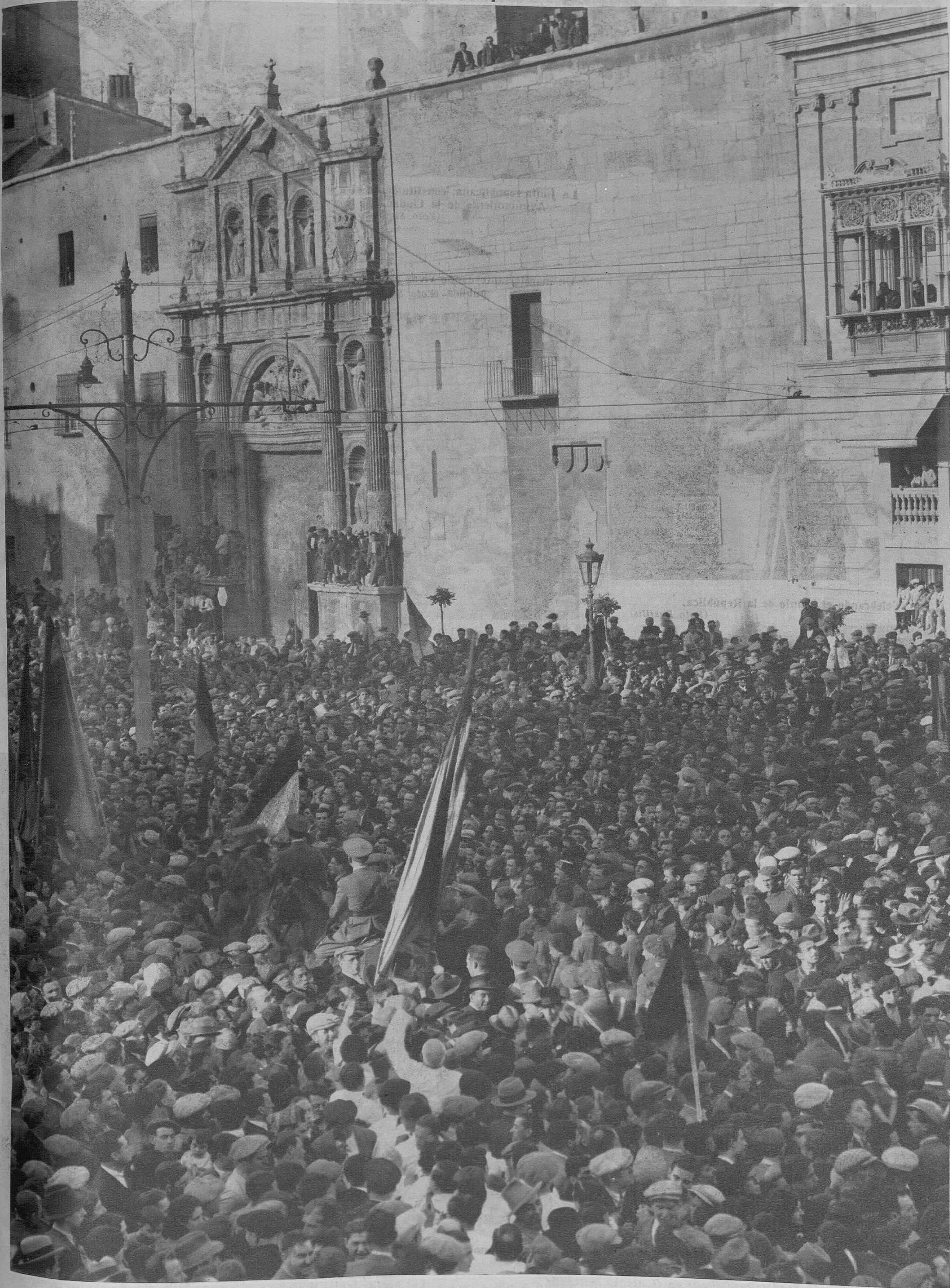
La manifestación Cívico-Militar organizada para la proclamación de la República, a su salida de la plaza de Tetuán.

Proclamación de la República en Valencia