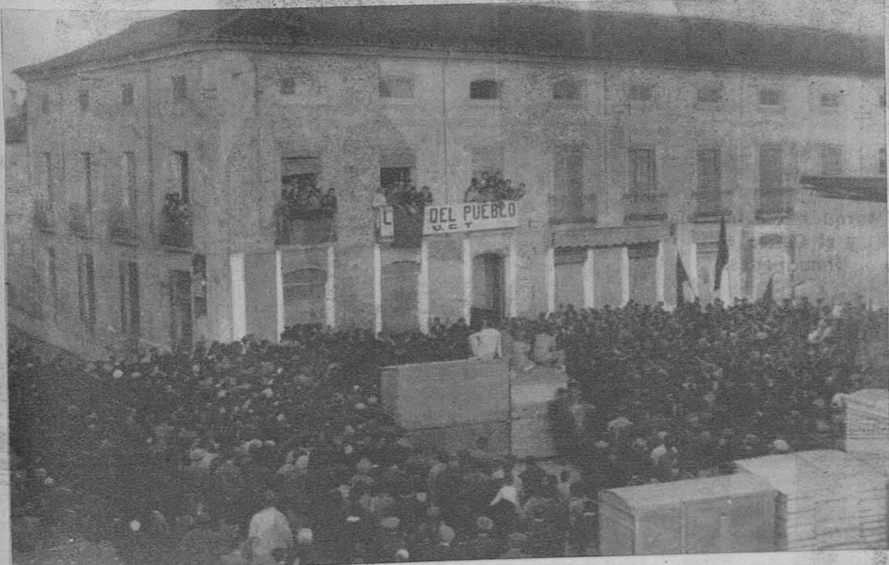
Después de la proclamación de la República, el vecindario de Albacete ante la Casa del Pueblo.