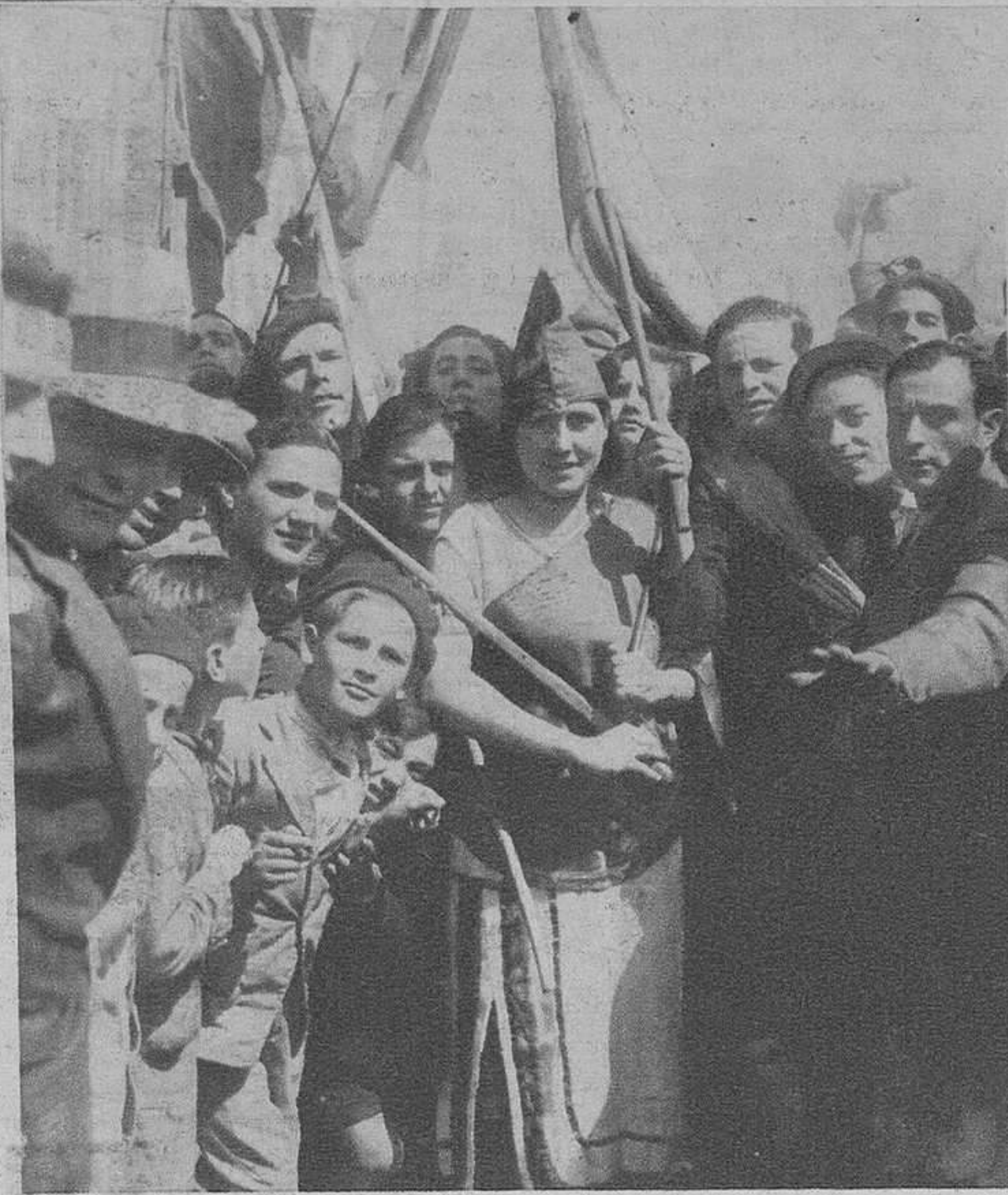
Celebrando el triunfo de la República.