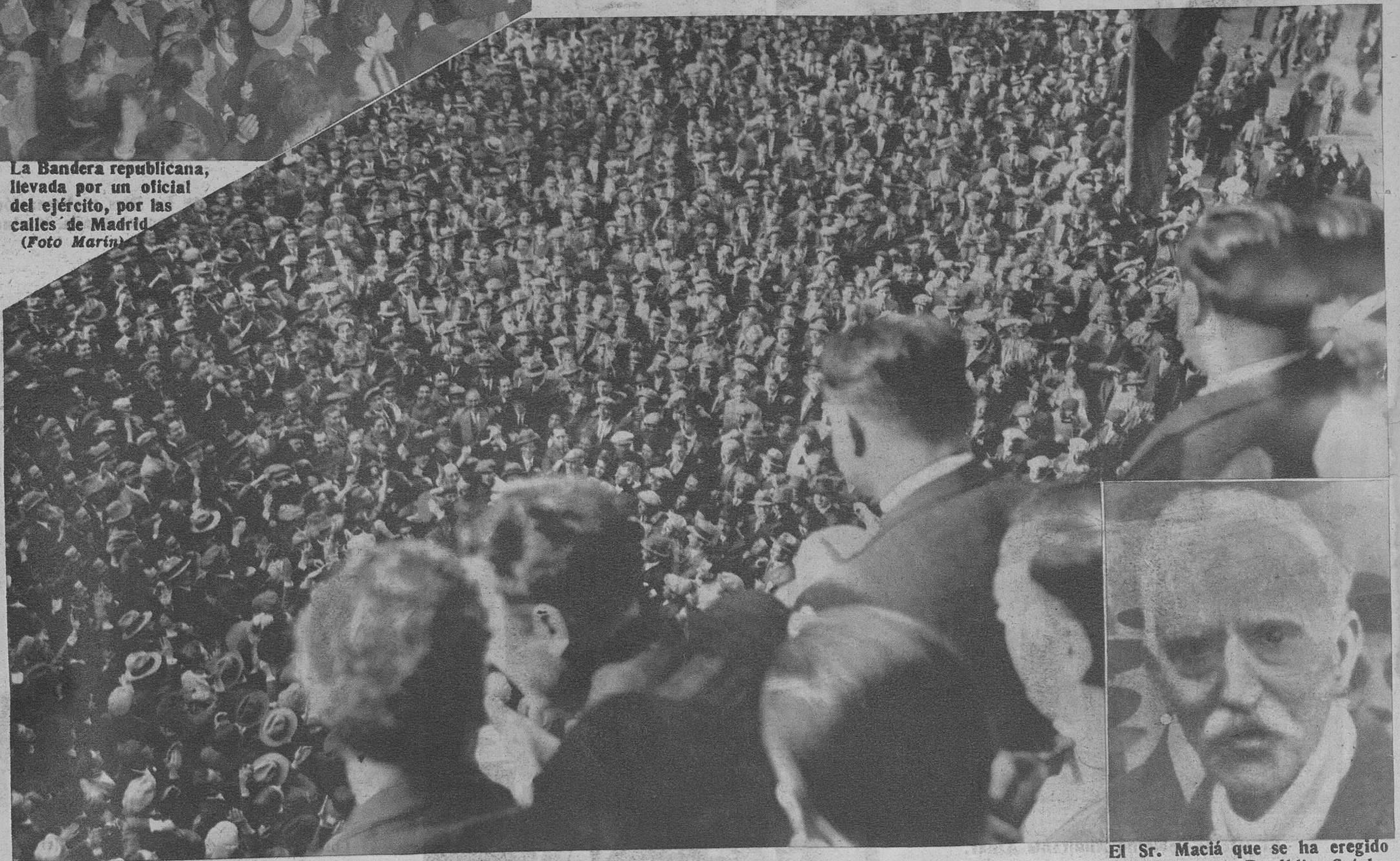
Oradores republicanos, dirigiendo la palabra al público desde un balcón del Ayuntamiento de Barcelona.