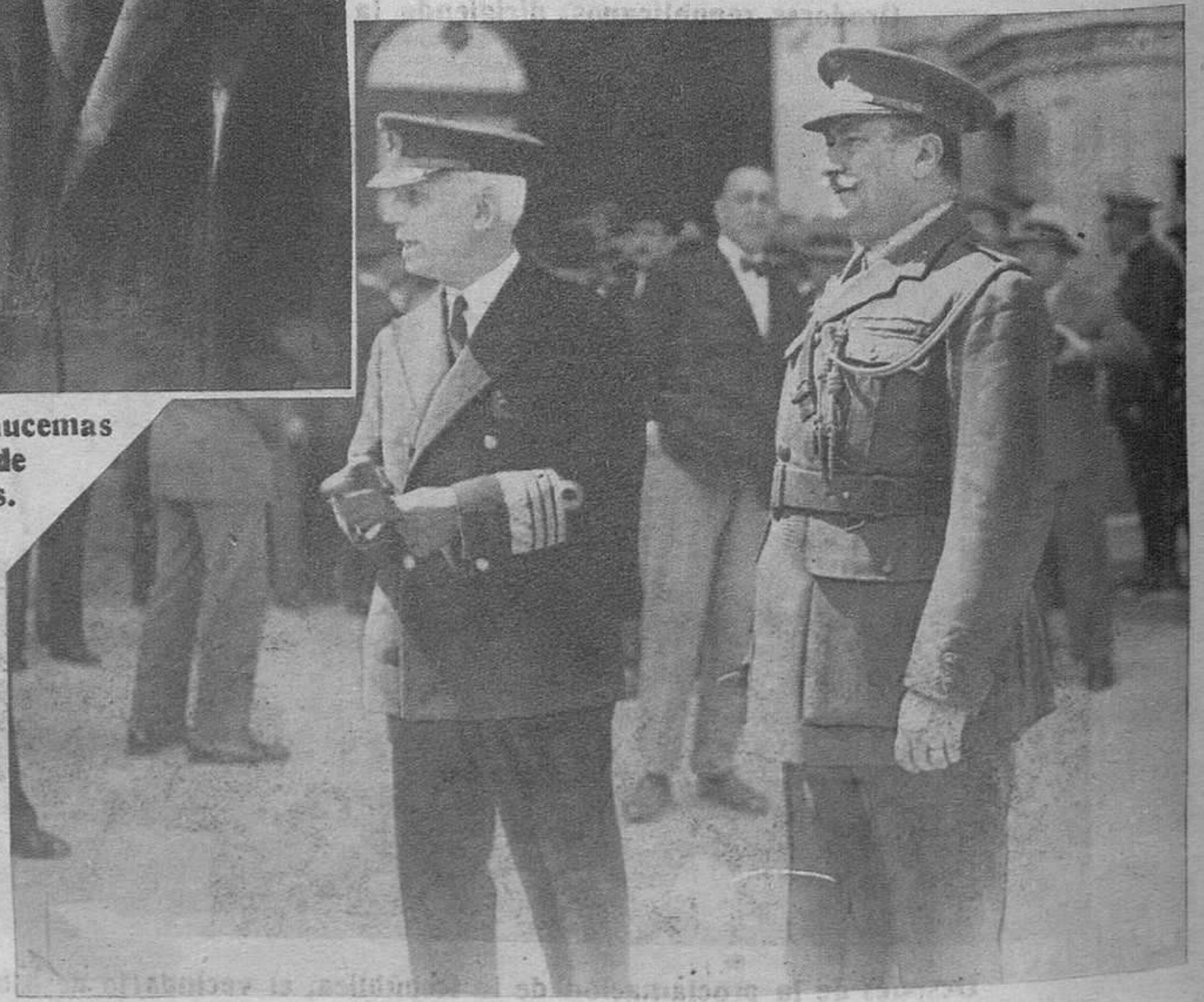
El general Berenguer y el almirante Rivera.