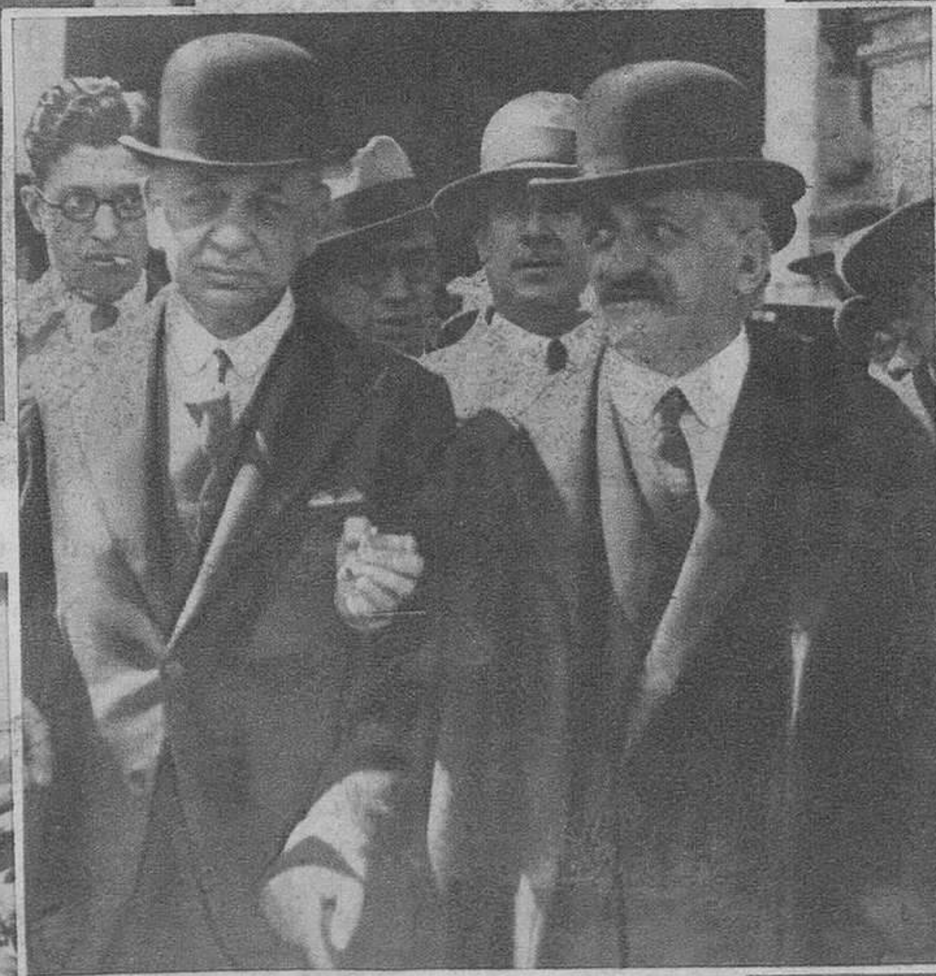
El Marqués de Alhucemas y el Conde de Romanones.