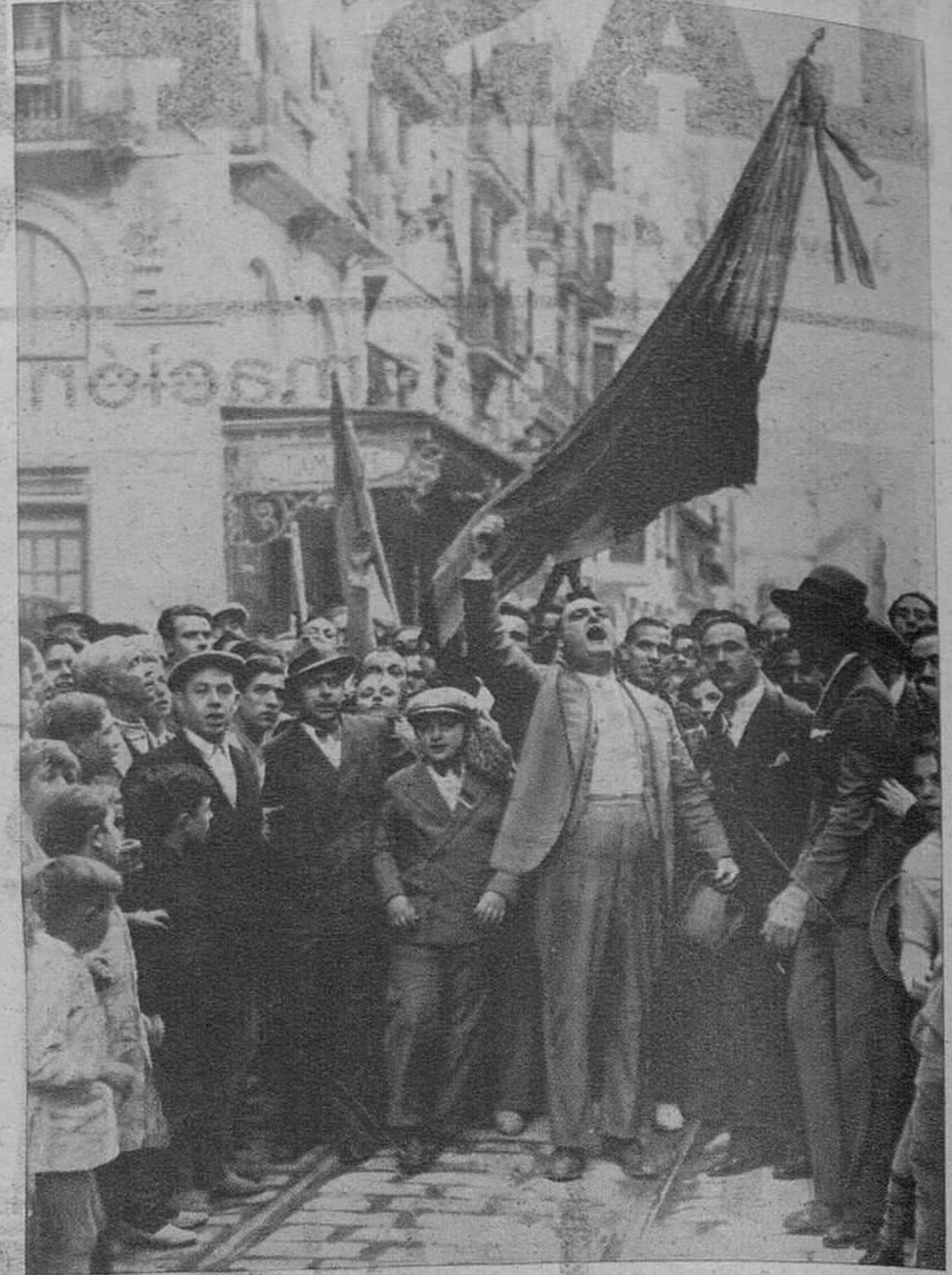
Un manifestante dando vivas a la República.