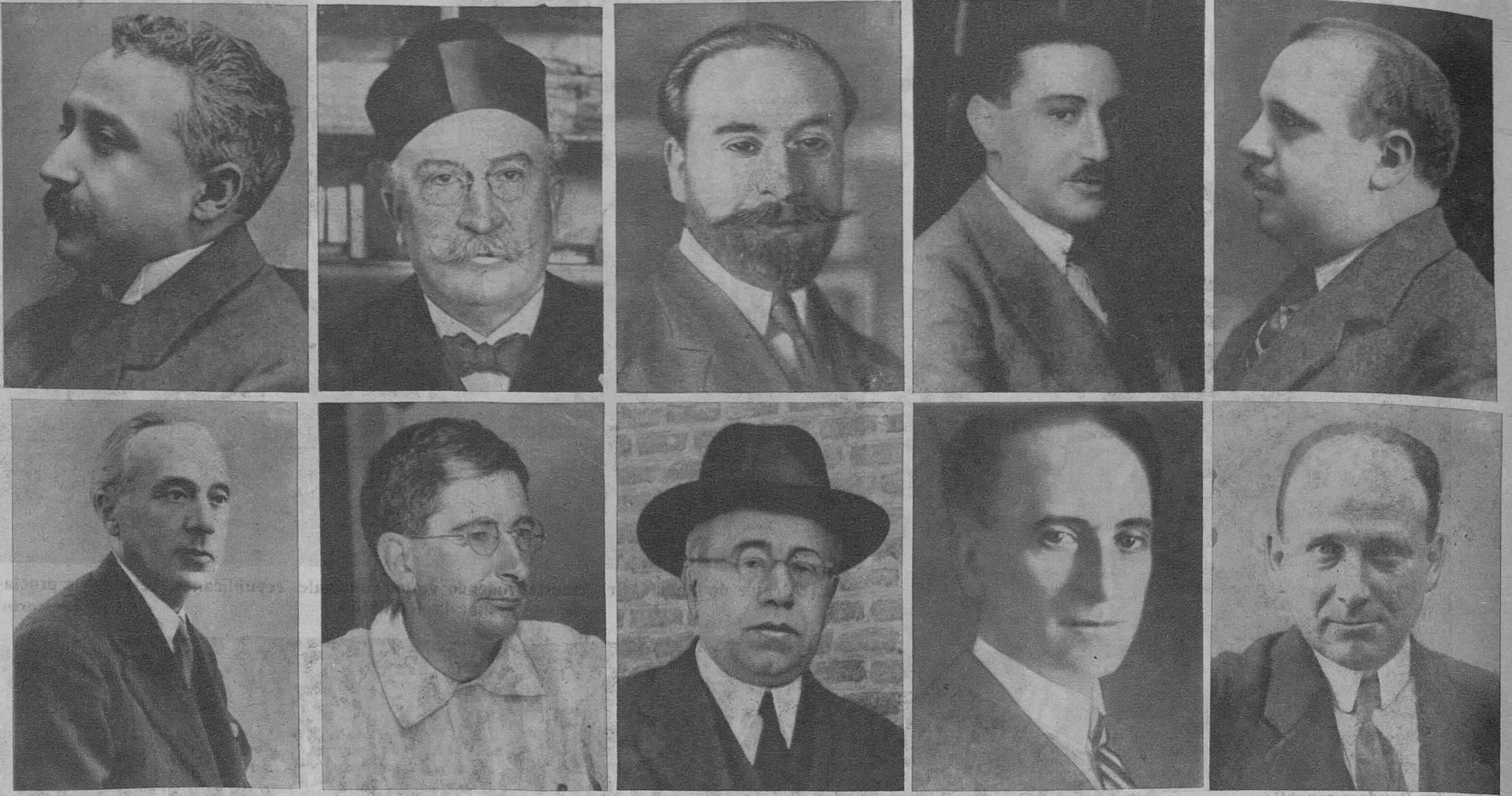
De izquierda a derecha. Presidencia, D. Niceto Alcalá Zamora. Estado, D. Alejandro Lerroux. Gracia y Justicia, don Fernando de los Ríos. Gobernación, D. Miguel Maura. Hacienda, D. Indalecio Prieto. Fomento, D. Alvaro de Albornoz. Instrucción, D. Marcelino Domingo. Ejército, D. Manuel Azaña. Marina, señor Casares Quiroga. Trabajo, señor Largo Caballero.