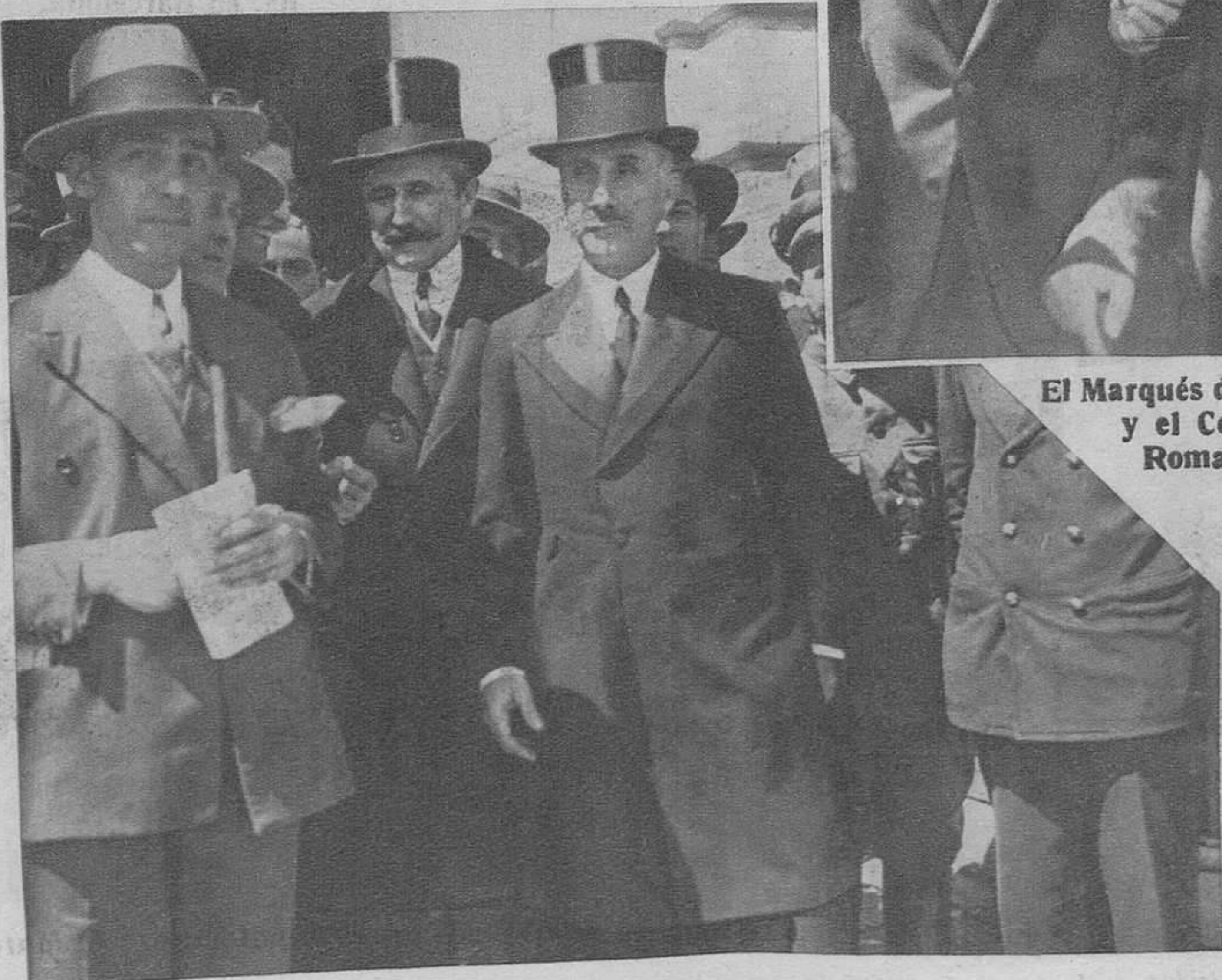
El ministro de Hacienda Sr. Ventosa.