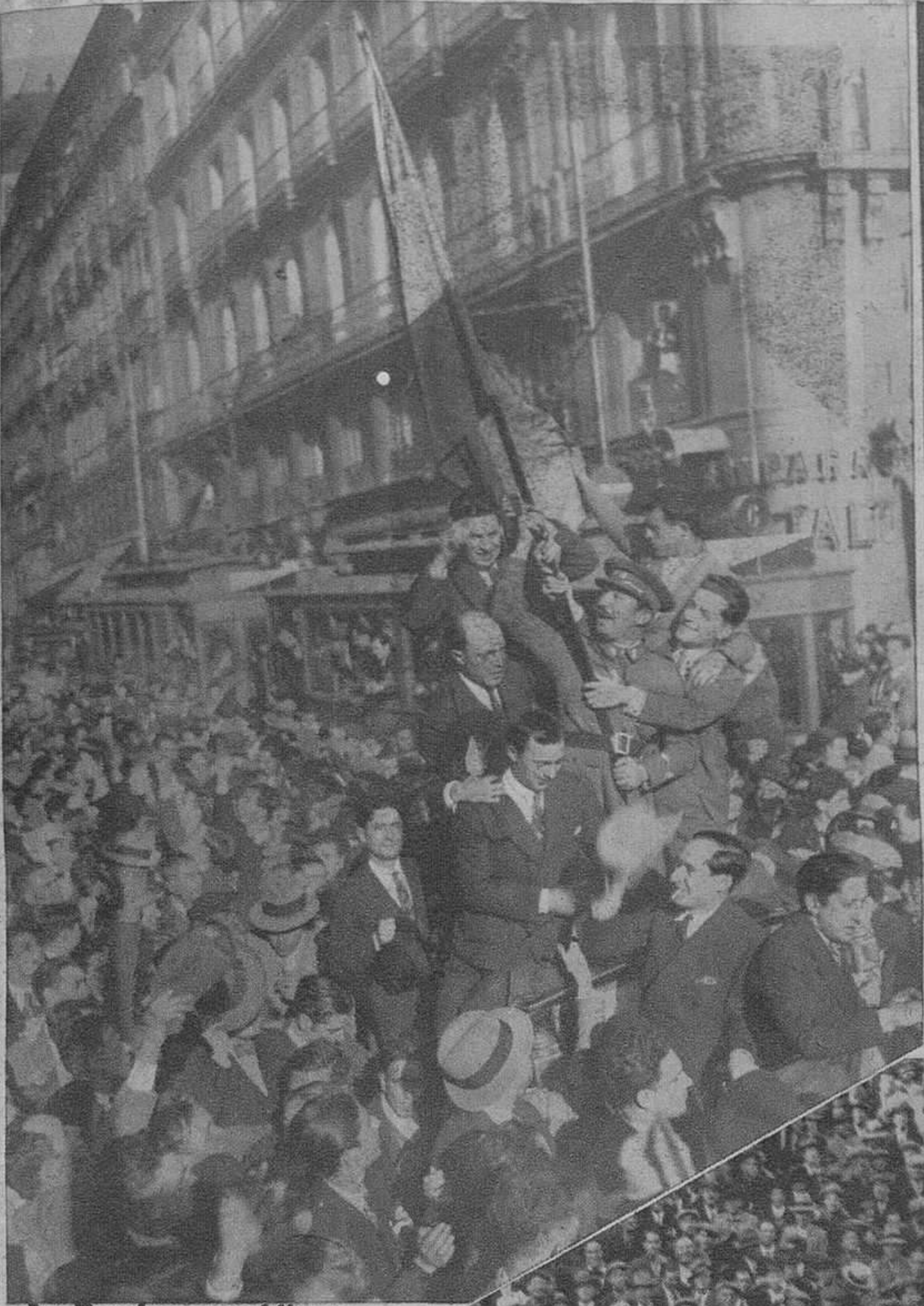
La Bandera republicana, llevada por un oficial del ejército, por las calles de Madrid.