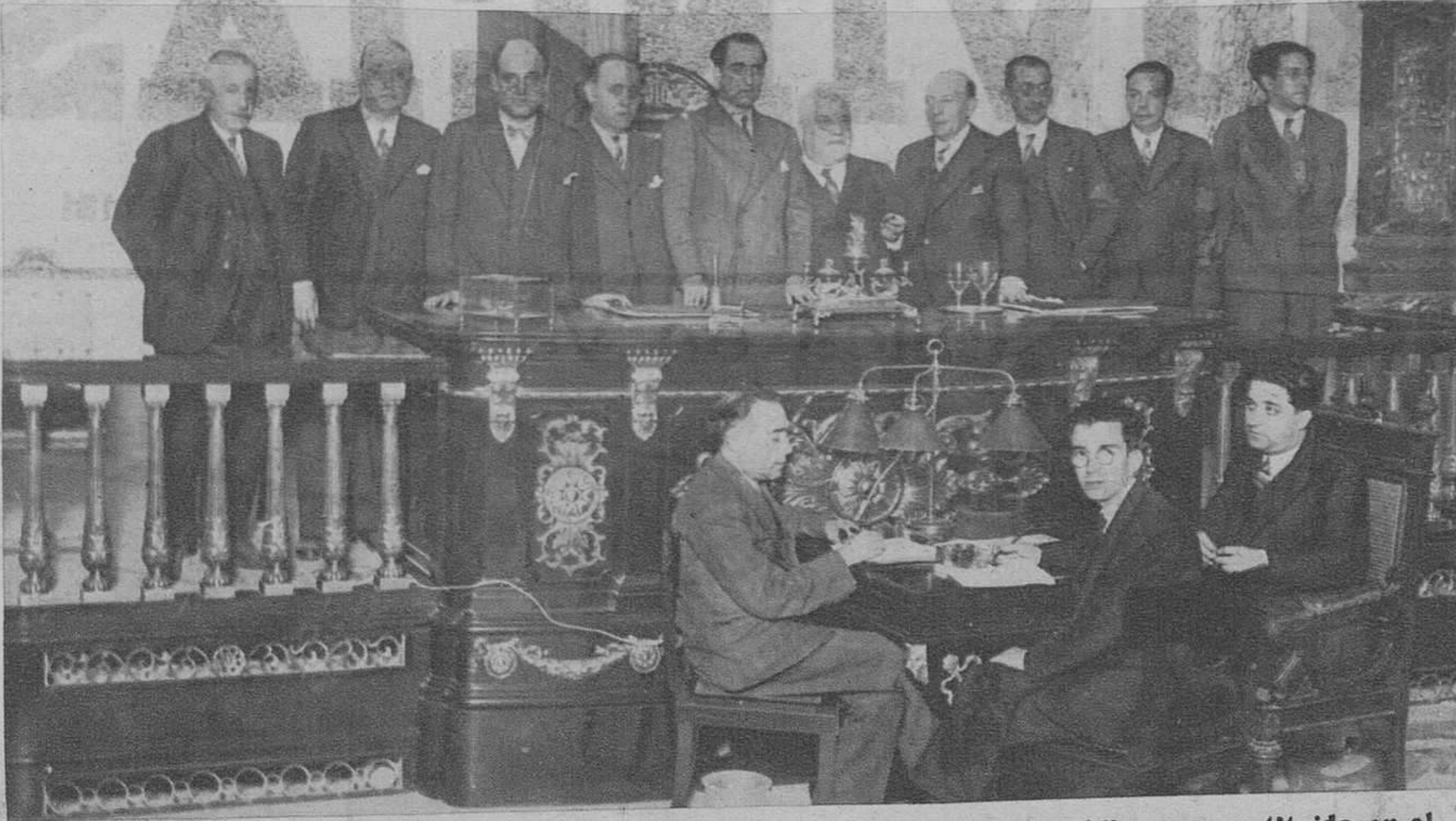
La Junta republicana, constituida en el Ayuntamiento de la Ciudad.