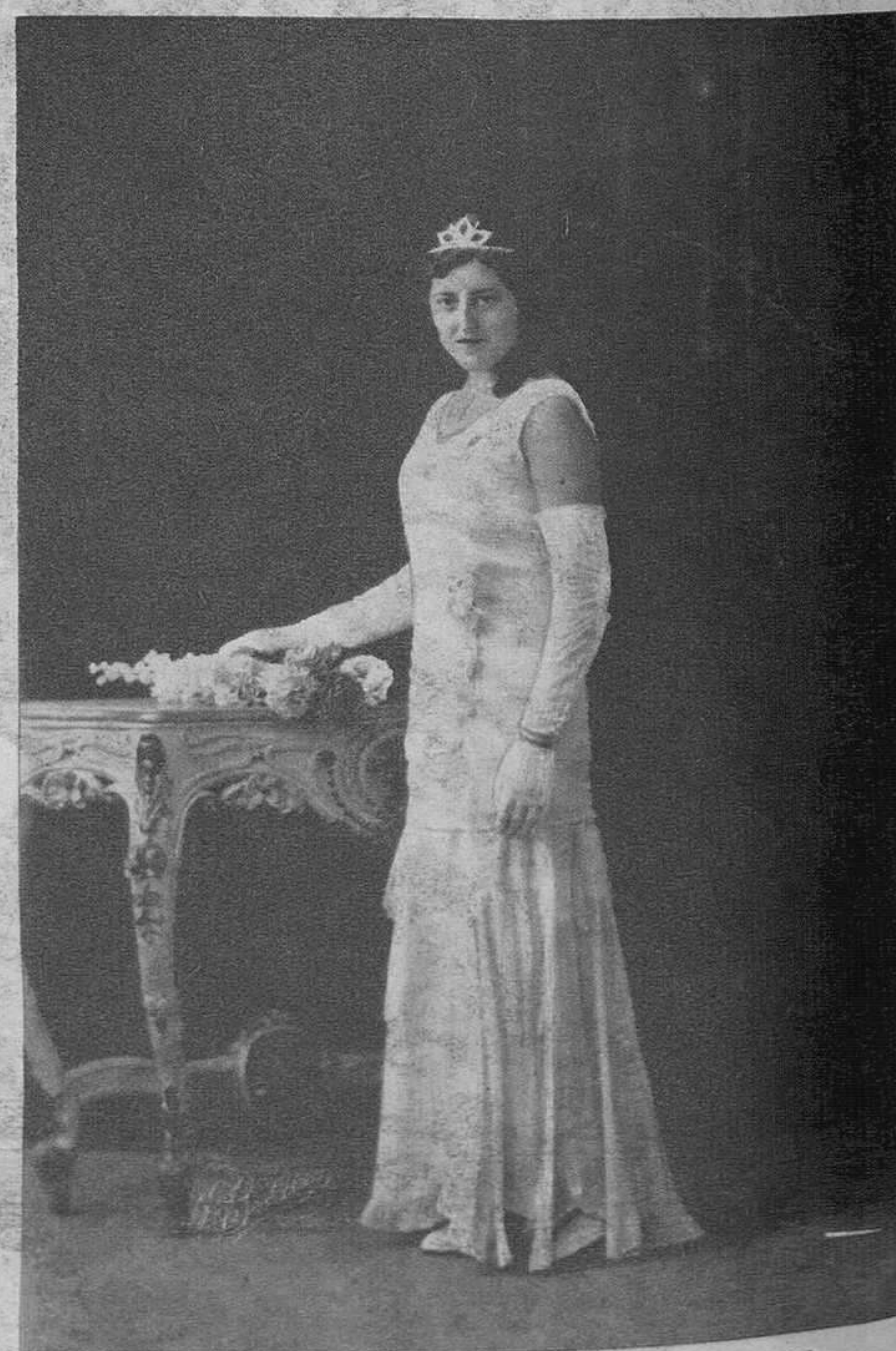
La Reina de los Juegos Florales, organizados por la Asociación de San Vicente Ferrer del Altar del Mercado.

Ministerio de Educación, Cultura y Deporte