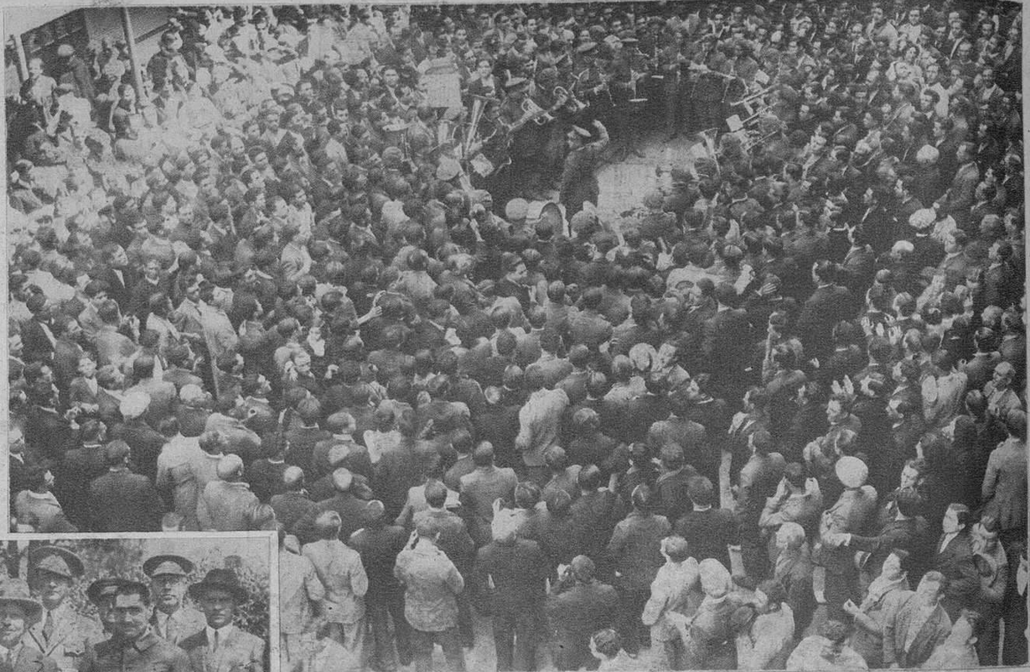
La banda del Regimiento de Guadalajara, ejecutando la «Marsellesa» en la plaza de la Reina.