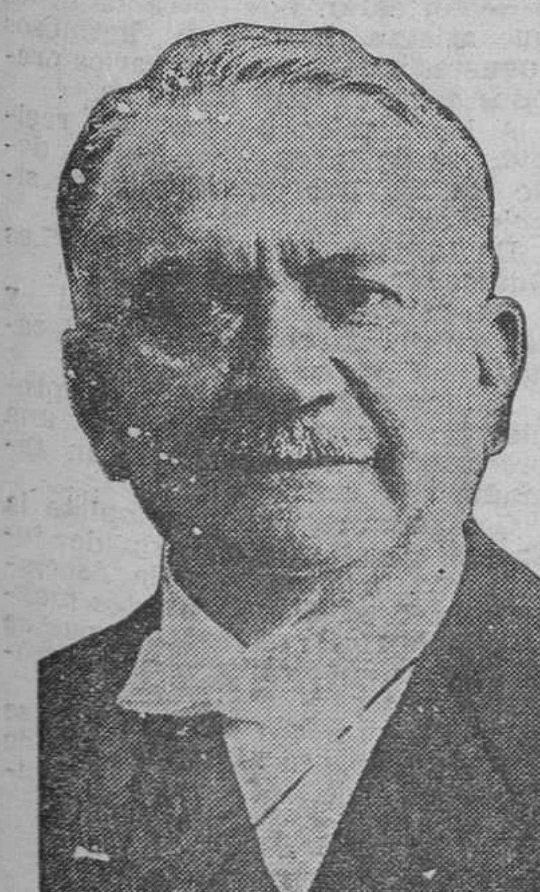
El nuevo jefe del Gobierno francés, M. Doumergue