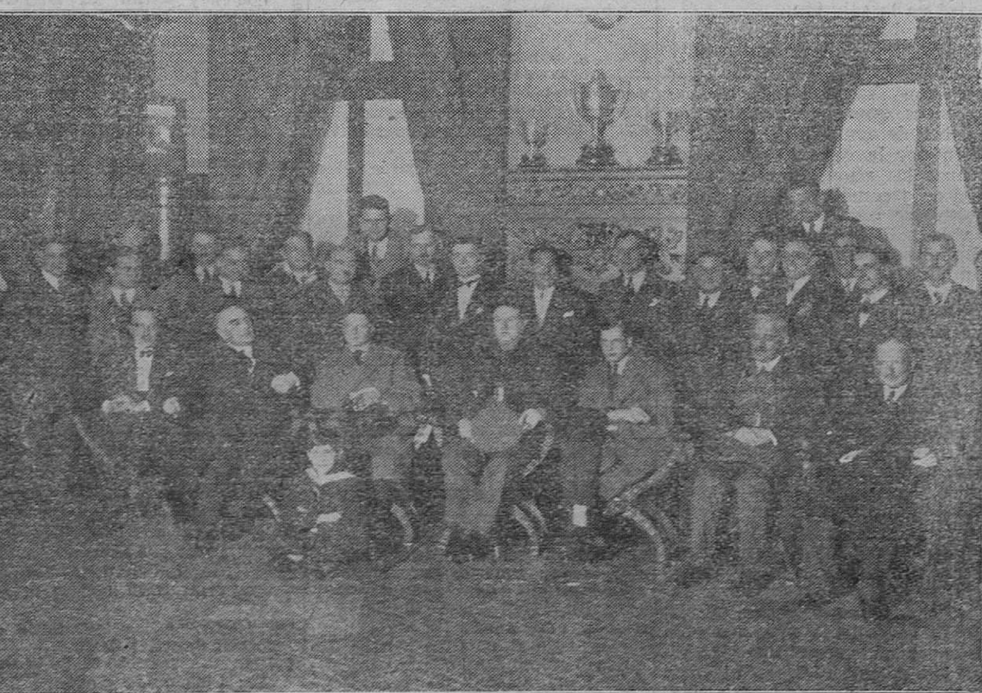
El príncipe de Gales y su hermano en el Club Náutico de Vigo

Benito Mussolini no tiene biografía más allá de su elevación al poder. Hasta entonces fue un hombre de vida oscura. Su actuación pública, y su celebridad, arrancan de hace muy pocos años, de la post guerra, de cuando al frente de los camisas negras hizo frente a la demagogia roja, que había comenzado ya a apoderarse de las fábricas e intentaba el desarrollo de su programa. Fue una carrera rápida y triunfal, que en pocas semanas lo llevaron a escalar el puesto más elevado del Estado, en el cual es mantenido sostenido por una poderosa organización política que es obra completamente suya.