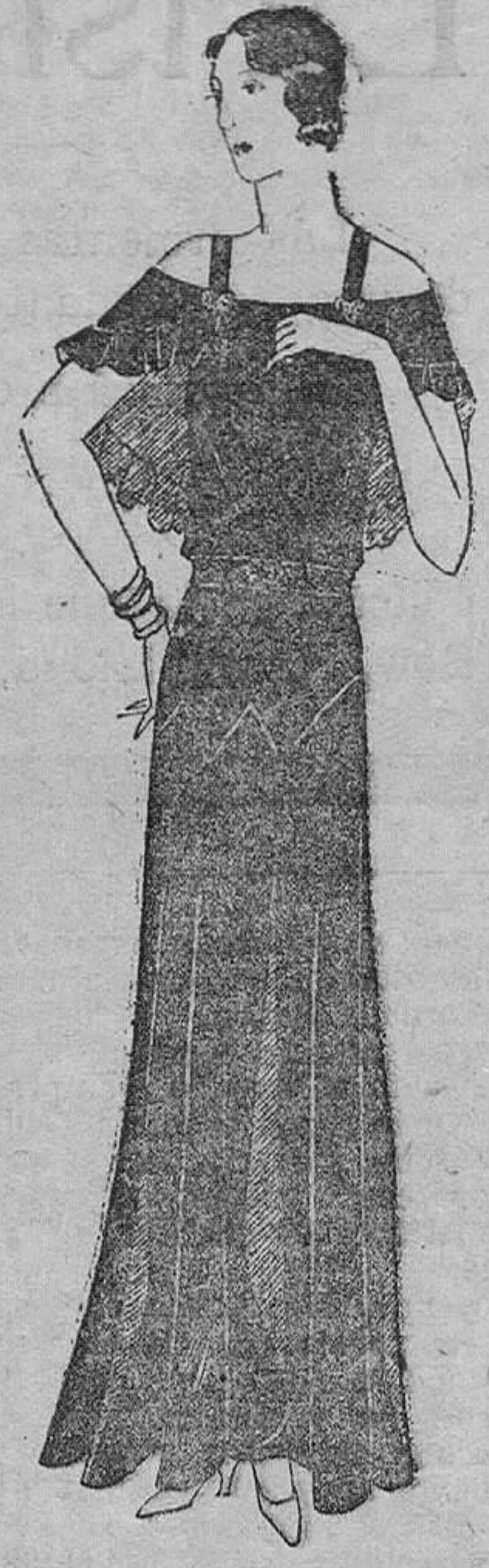
Vestido de crepe azul, en la parte alta, adornado con una capota sujetada en la blusa por dos broches de brillantes