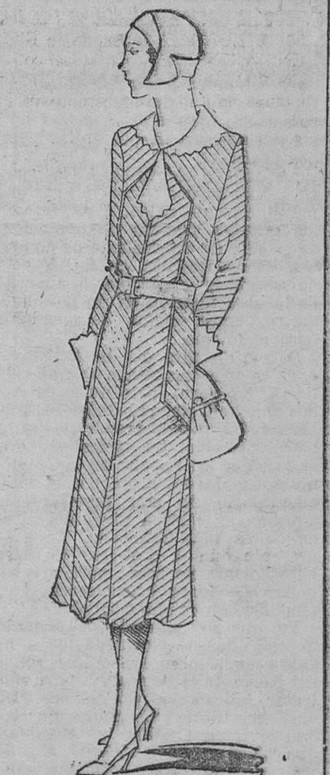
Vestido de lanita negra con diagonales blancas. Cintura de cuero blanco y cuello y puños de linterie blanca