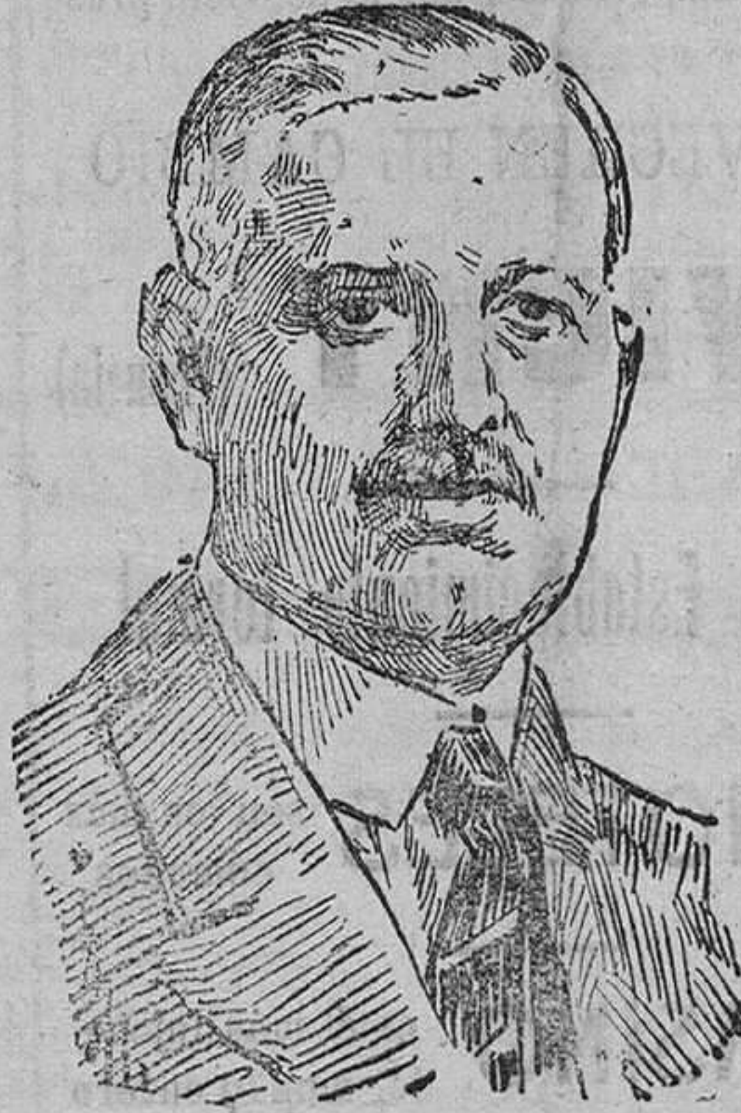
El Canciller alemán Sr. Cuno, que ha presentado a los aliados nuevas proposiciones de pago por las reparaciones, siendo éstas rechazadas por Francia, Bélgica e Inglaterra.