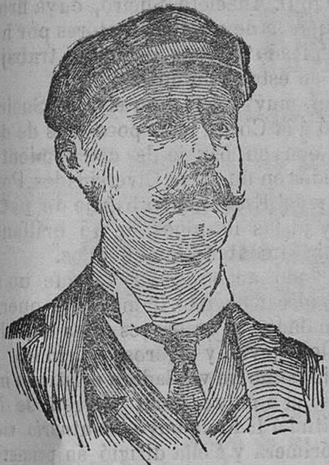
EL COMANDANTE PEARY

«¿Quién es Peary? Millares de fotografías y de grabados sirvieron de medios para satisfacer la curiosidad americana, y todo el mundo supo que nuestro héroe es hombre activo, emprendedor, robusto, sabio y gigante. Los periódicos refirieron con todos sus detalles la historia del notable explorador y pronto se generalizó el pensamiento de favorecer sus planes para organizar una nueva expedición al Polo Norte.