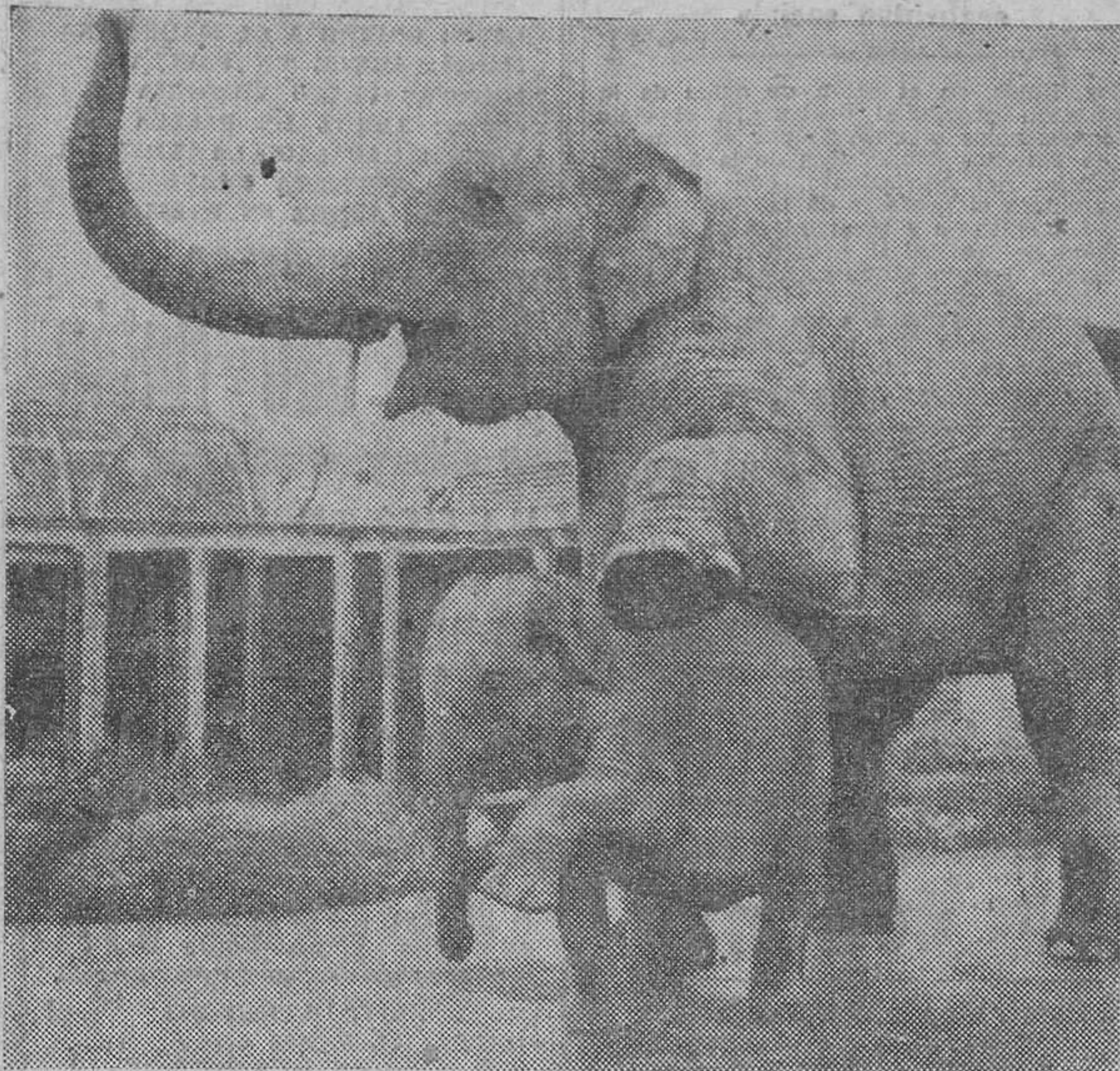
Para que vean ustedes cómo se extiende el «bugui-bugui» en el reino animal. Aquí les presentamos a «Sara», una elefanta del parque zoológico de Dublín (Irlanda) enseñando a su hijito los primeros pasos del «bugui».