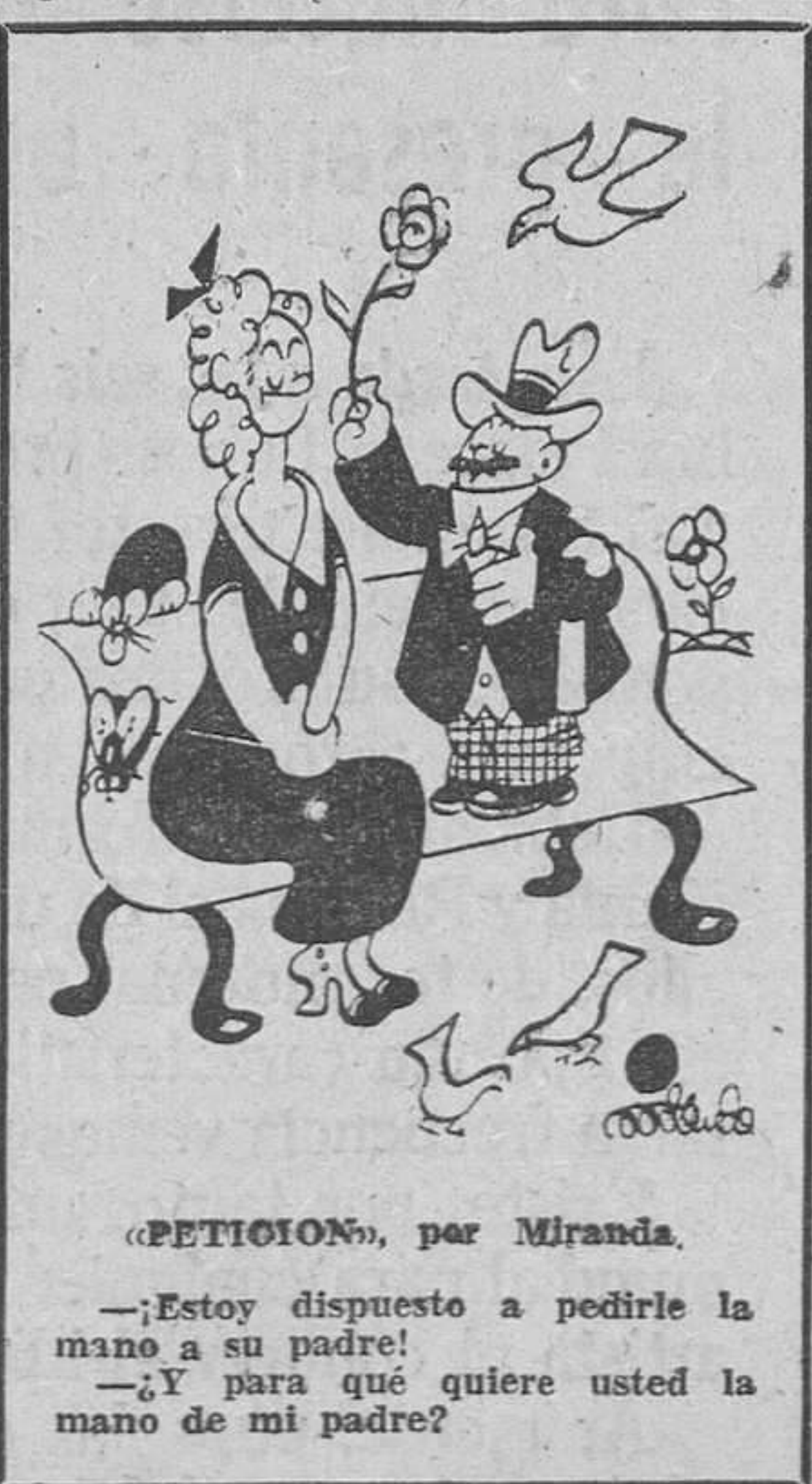
«PETITION», por Miranda.

La anaplasmosis originariamente afectaba sólo a las regiones del extremo Sur. Pero actualmente se ha extendido a la mitad de los 48 Estados americanos. Es transmitida por las garrapatas, las moscas y los mosquitos. El mismo hombre puede ser responsable de esta epidemia, si utiliza instrumentos quirúrgicos mal esterilizados para desornar o vacunar al ganado. Hasta aquí, no se ha descubierto ningún tratamiento satisfactorio para luchar contra esta enfermedad. Si la vaca contagiada no muere, queda inmunizada para el resto de su vida, pero casi siempre muere.