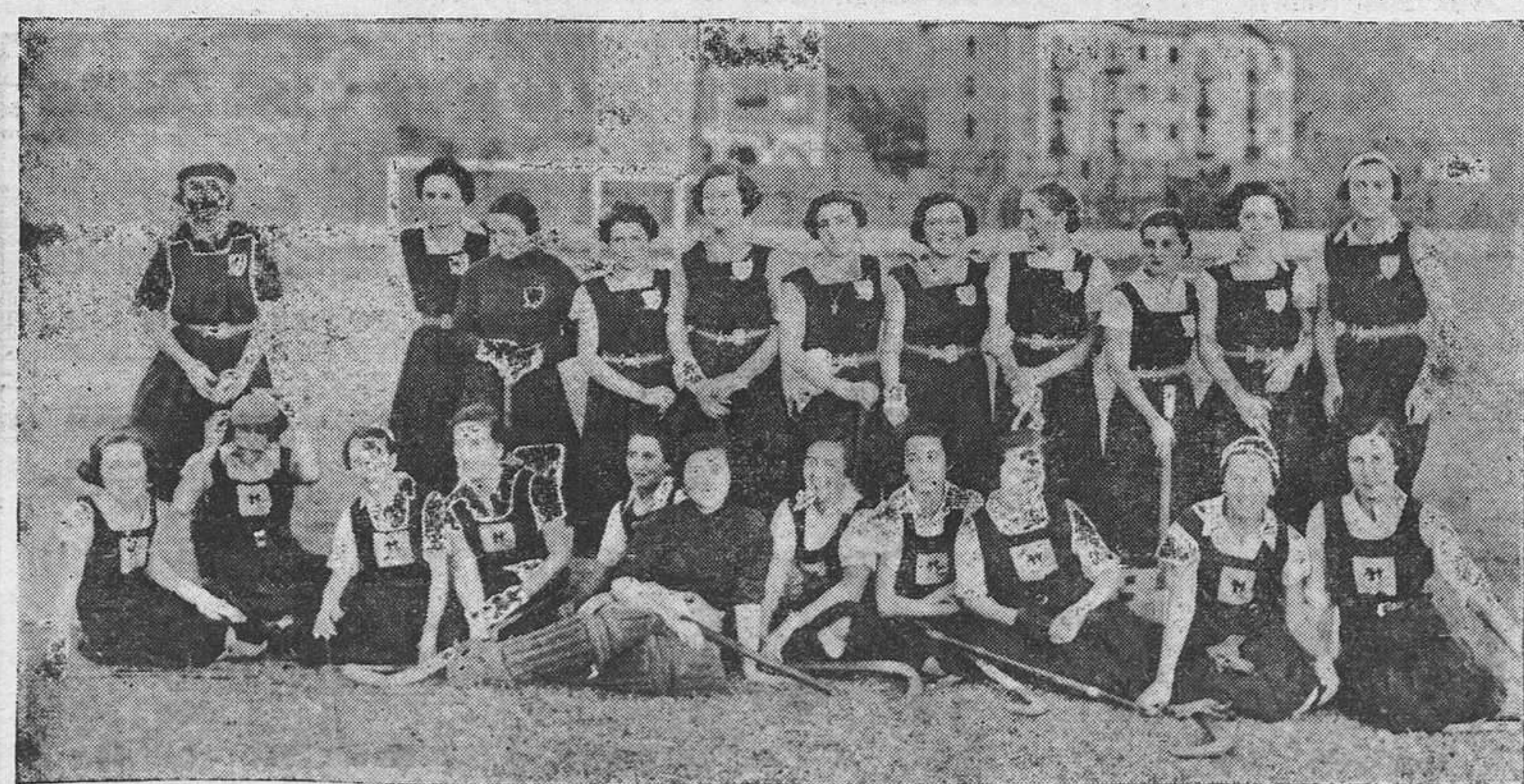
Los equipos de hockey de San Sebastián y Zugazarte, que han jugado un interesante partido en Gobelondo. Este encuentro fué presenciado por millares de personas, batiendo el record de entrada en este deporte.

no desanimarse, pues, que nuestros vencedores de hoy pueden ser muy fácilmente vuestros vencidos mañana, y a procurar rehabilitarse ante "vuestra" afición que mañana os recibirá con todo momento aunque la luz sea adversa, pues la "hinchada" avilesina sabe muy bien mucho que se prodigan en el fútbol los resultados sorpresa.