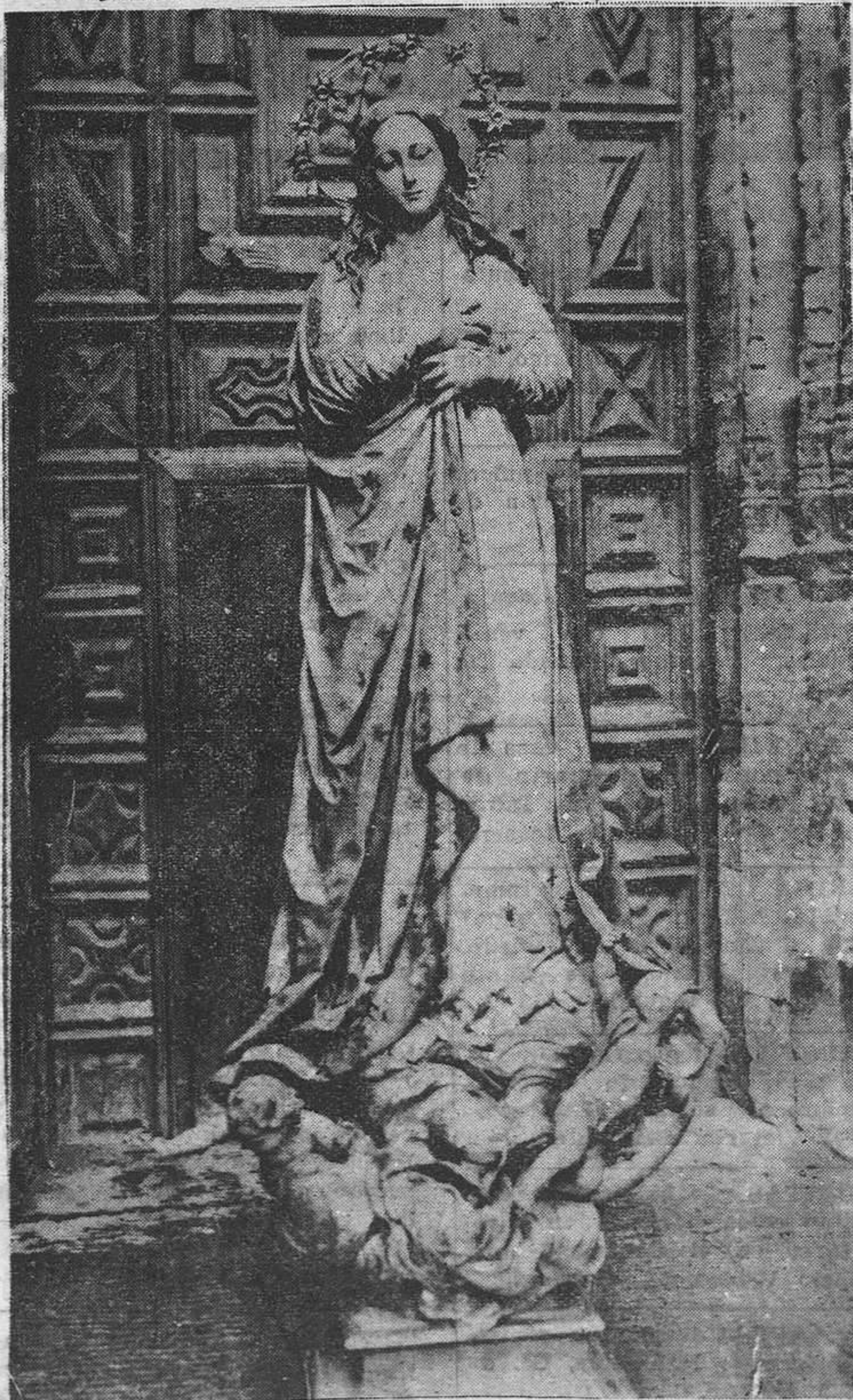
Hermosa imagen de la Inmaculada Concepción, que se venera en San Isidoro y en cuyo honor se celebró un solemne novenario que hoy concluye, al que asistieron numerosísimos fieles que llenaron el templo de oraciones. Hoy, día de su fiesta, será algo extraordinaria la concurrencia del pueblo que rendirá a la Celestial Señora el testimonio fervoroso de su fe.