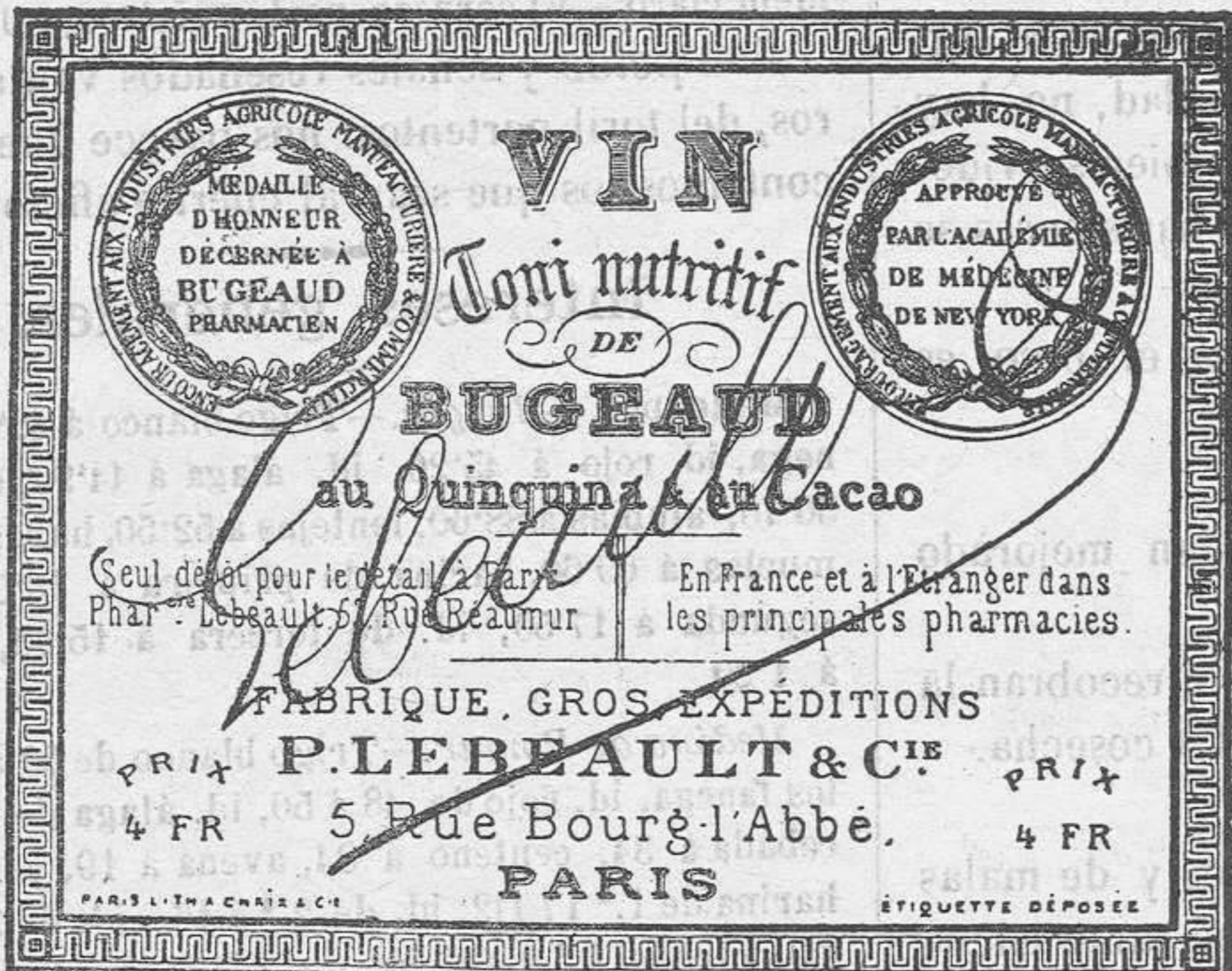
REPRODUCCIÓN DEL RÓTULO DEL VERDADERO VINO de BUGEAUD (impresión negra en fondo gamuza, firma encarnada).