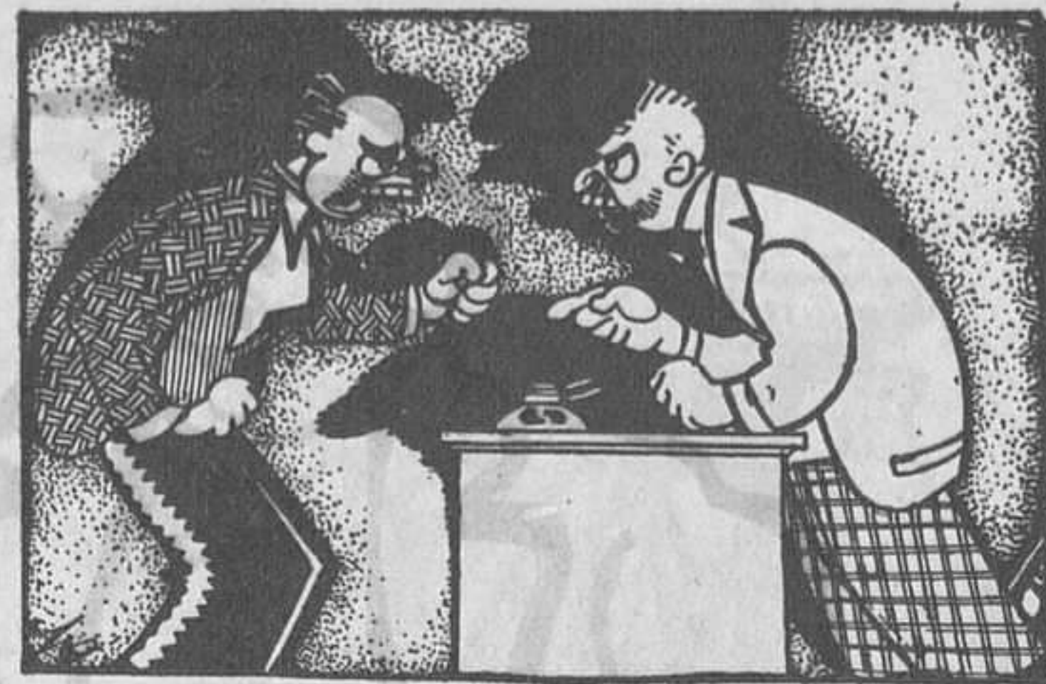
EL QUE NO HO VOL ENTENDRE

No tracto de menysprear l'obra dels precursors del nostre teatre; al contrari, admiro la gran voluntat que demostraren portant a cap una feina, per a la qual ni l'ambient ni les circumstàncies eren propícies; cal agrair-los la seva obra, puix amb la seva constància feren possible el que avui és un fet indiscutible: la maduritat del Teatre Català. I com a conseqüència lògica de l'exò-