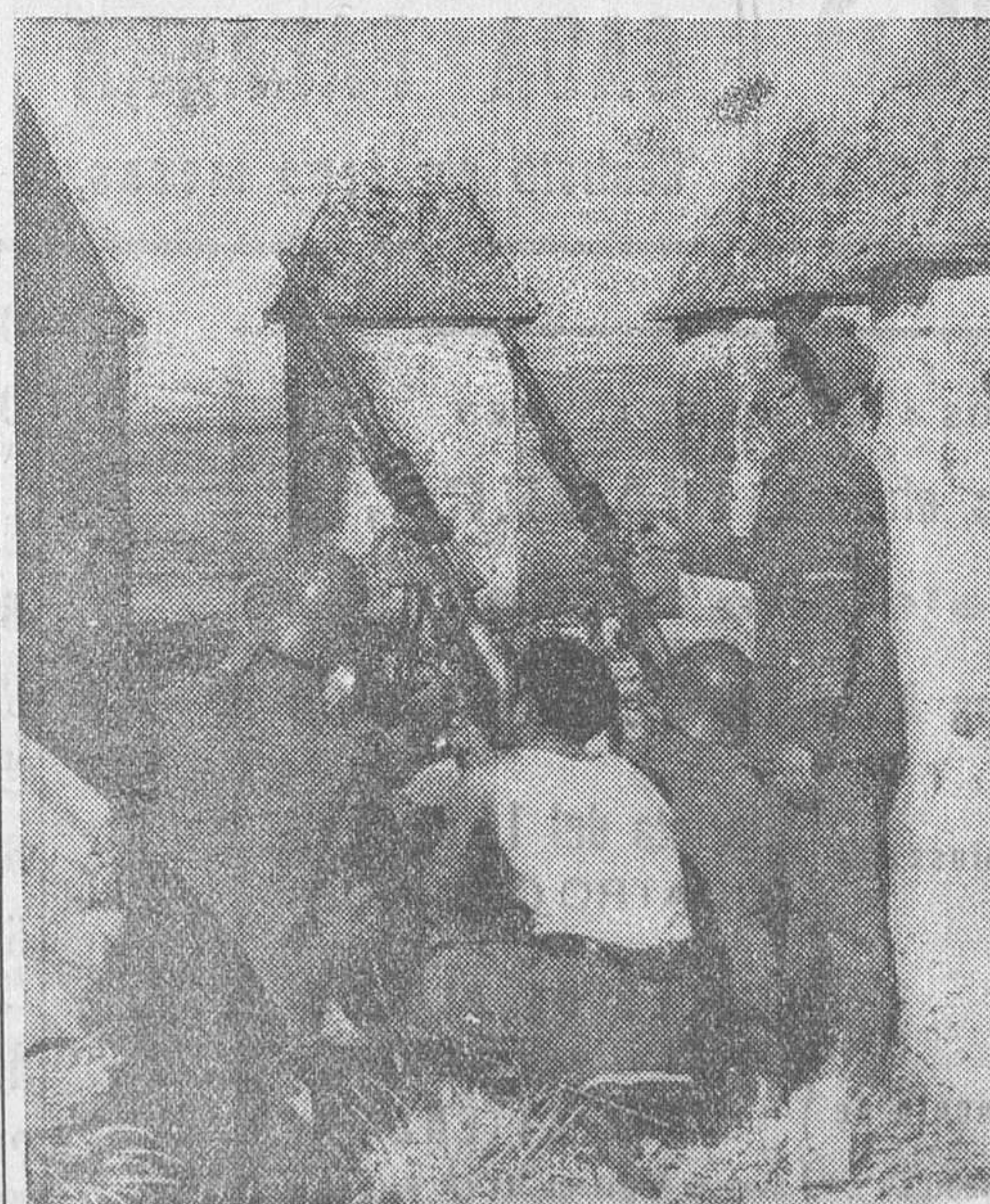
EN EL FRENTE DE CORDOBA, CON LA COLUMNA QUE OPERA EN TORRES CARRERA.—Ametralladoras antiaérea disparando sobre la avioneta blindada de los facciosos cordobeses

Los defensores hicieron insistentes interrogatorios a ambos testigos para salvar la responsabilidad de sus defendidos respectivos, y ambos contestaron neta y categóricamente manteniendo los extremos de sus declaraciones.