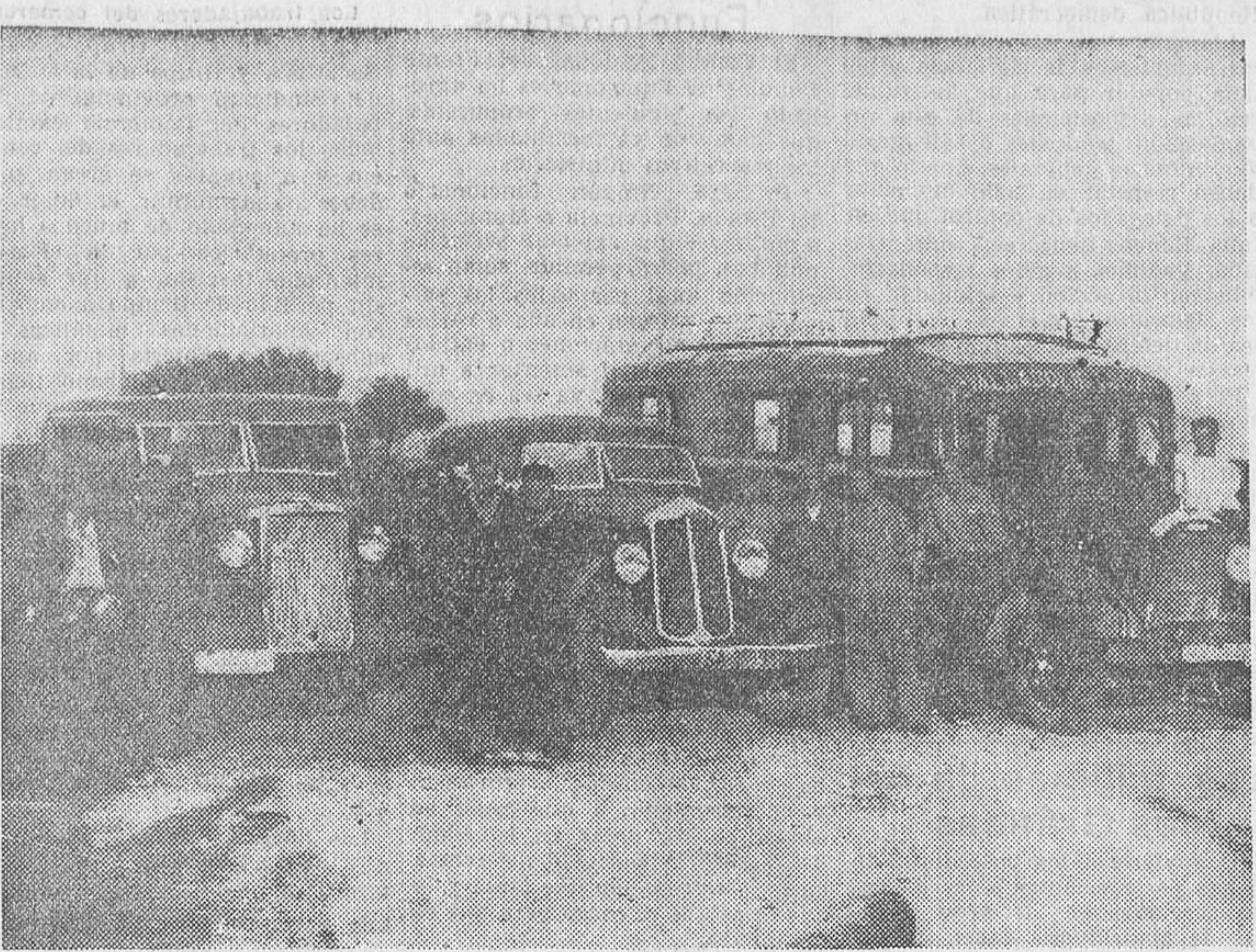
Tres de los coches de las matrículas de Salamanca y Valladolid, cogidos por las tropas leales a los facciosos en plena carretera de Navalperal

Hoy, Consejo de ministros Hoy se celebrará Consejo de ministros, bajo la presidencia del jefe del Estado.