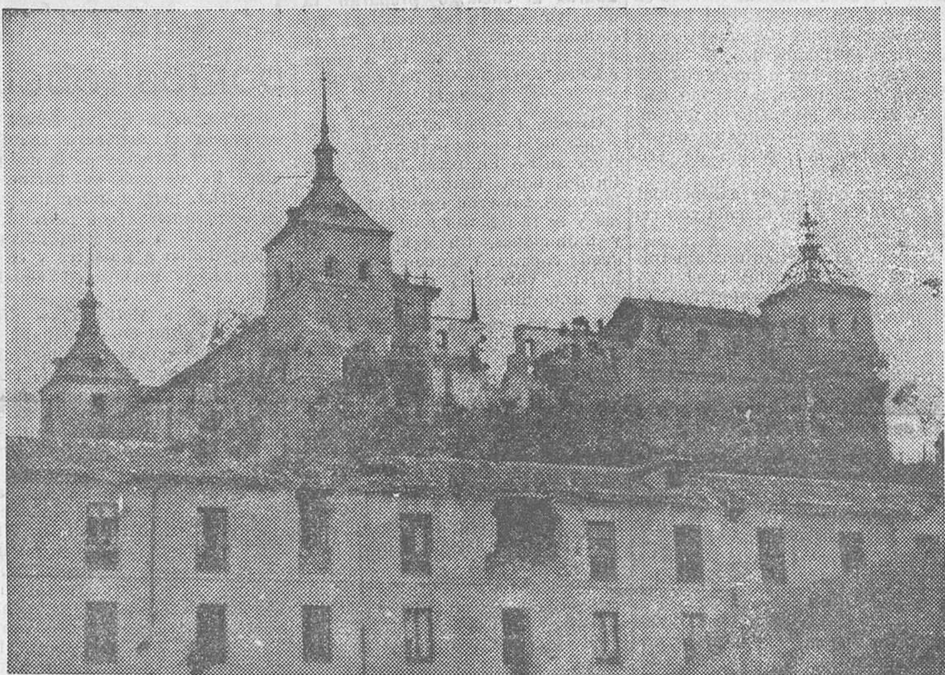
LOS ULTIMOS MOMENTOS DEL ALCAZAR DE TOLEDO.—La primera fotografía obtenida a poca distancia del Alcazar, en la que claramente se aprecia la destrucción de la mayor parte del edificio por nuestra artillería. Este interesante documento gráfico ha sido logrado por nuestro compañero Alfonso desde uno de nuestros nidos de ametralladoras, al que los facciosos creyeron haber callado con sus disparos al observar su silencio, que sólo tuvo por objeto dejar el sitio a nuestro fotógrafo