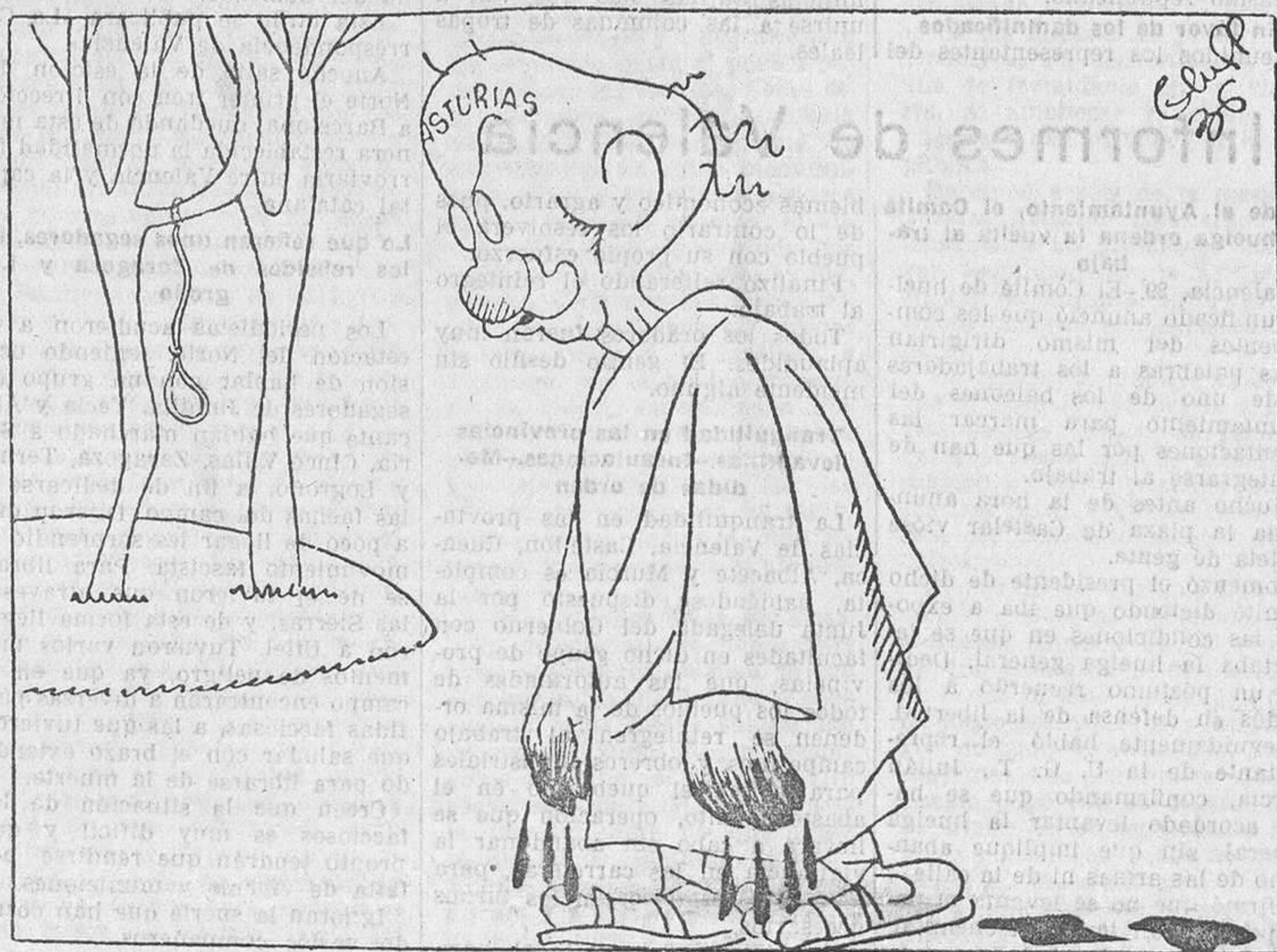
JUDAS, EN PORTUGAL, por Bluff ¡Ni aun tendrá la dignidad de morir como murió Iscariote!