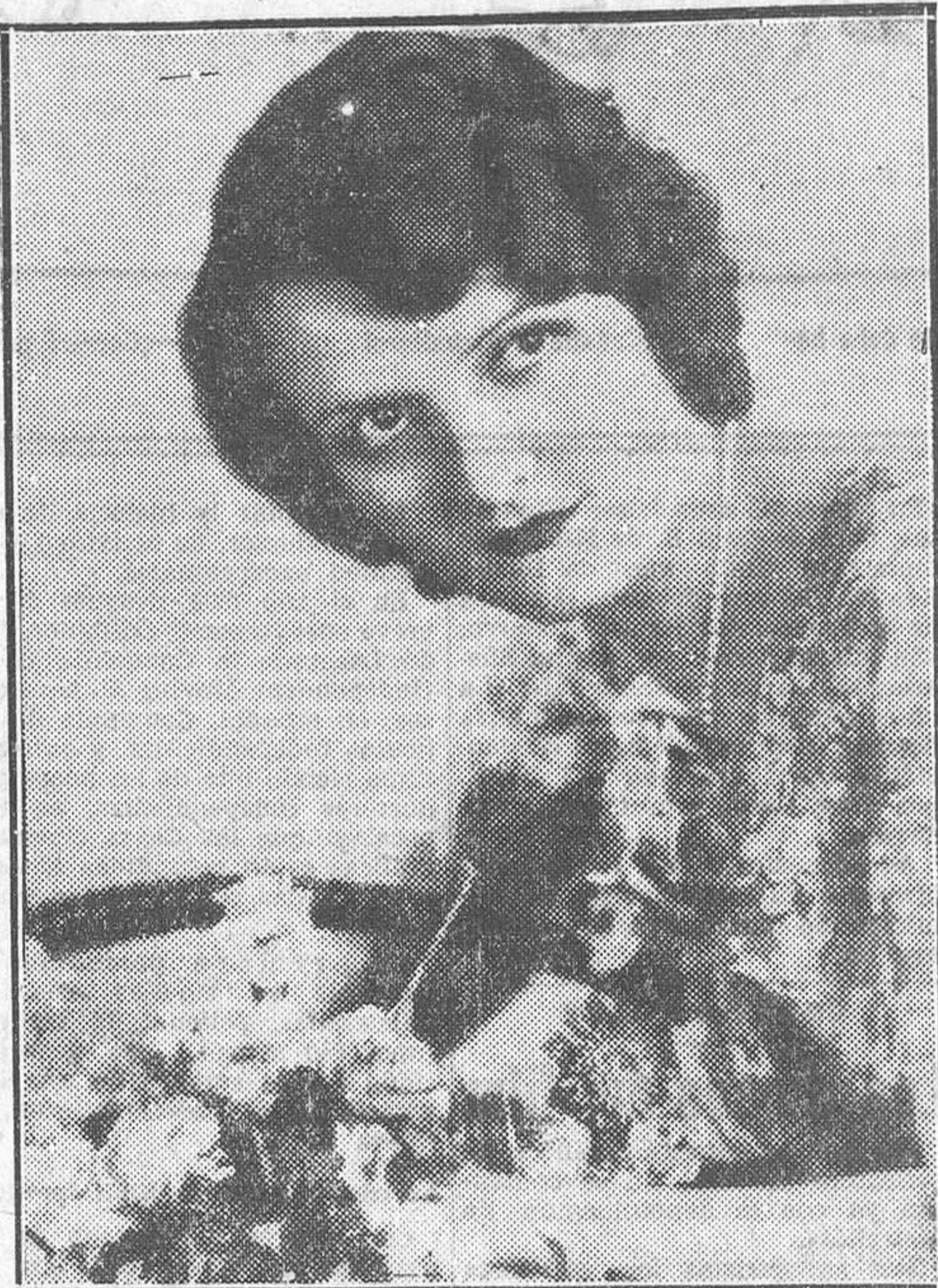
NORMA TERRIS, PRINCIPAL INTERPRETE DE LA ESPECTACULAR OPERETA CINEMATOGRAFICA DE STRAUS «CASADOS EN HOLLYWOOD», QUE EL LUNES SE ESTRENA EN EL GALLAO

Aun hemos de salir al paso de un nuevo argumento posible. El que nos opongan los que consideran que el error estriba en haber instaurado el cine sonoro en España prematuramente. Creemos que el público y la crítica hubiésemos coincidido en censurar a los empresarios si, conocida la