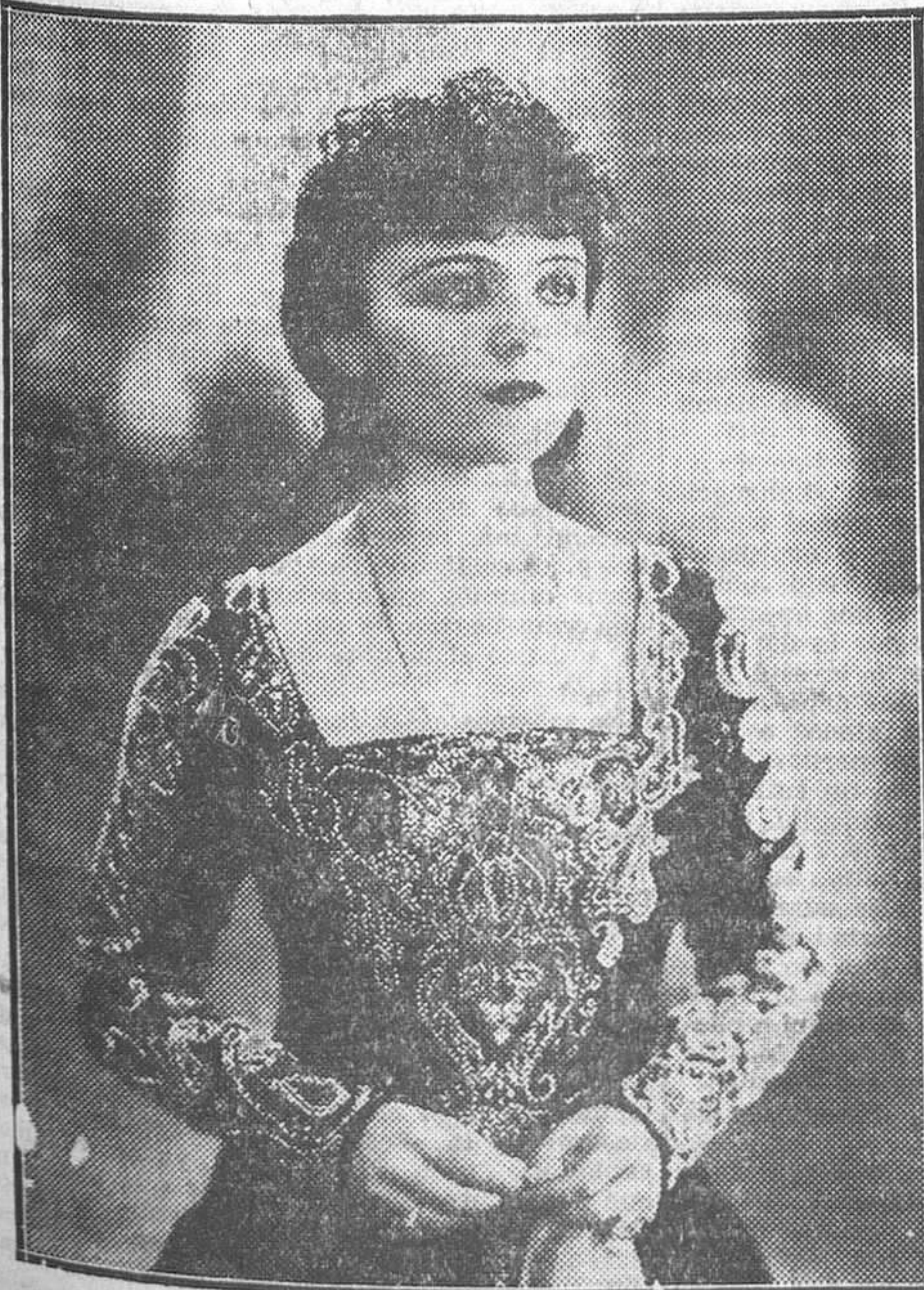
LA FAMOSA AOTRIZ POLA NEGRI, PROTAGONISTA DE LA PELICULA «LA MUJER DE MOSCÚ»