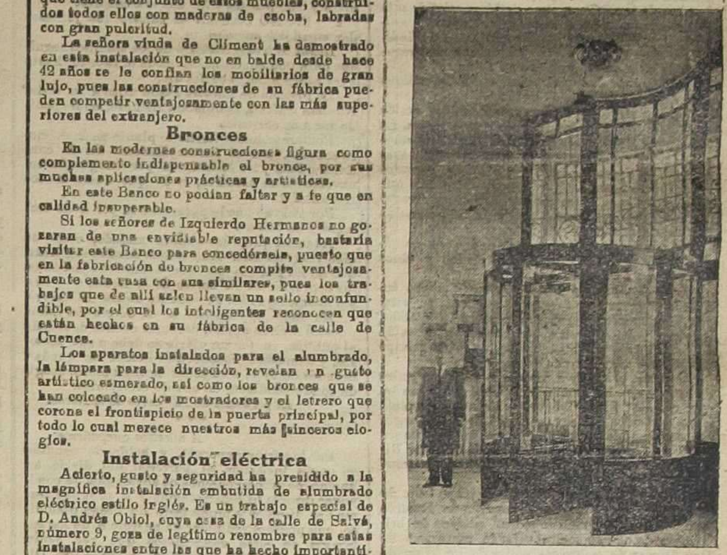
Cancela de entrada

En conclusión, el Banco Español del Rio de la Plata, honra a España entera y muy singularmente a Valencia cuyos artífices, palmarios nuestros, han sido tan colocados nuestro país. No terminaremos esta breve reseña sin dedicar un breve espacio a lo que es en sí mismo el establecimiento de crédito el Banco Español del Rio de la Plata.