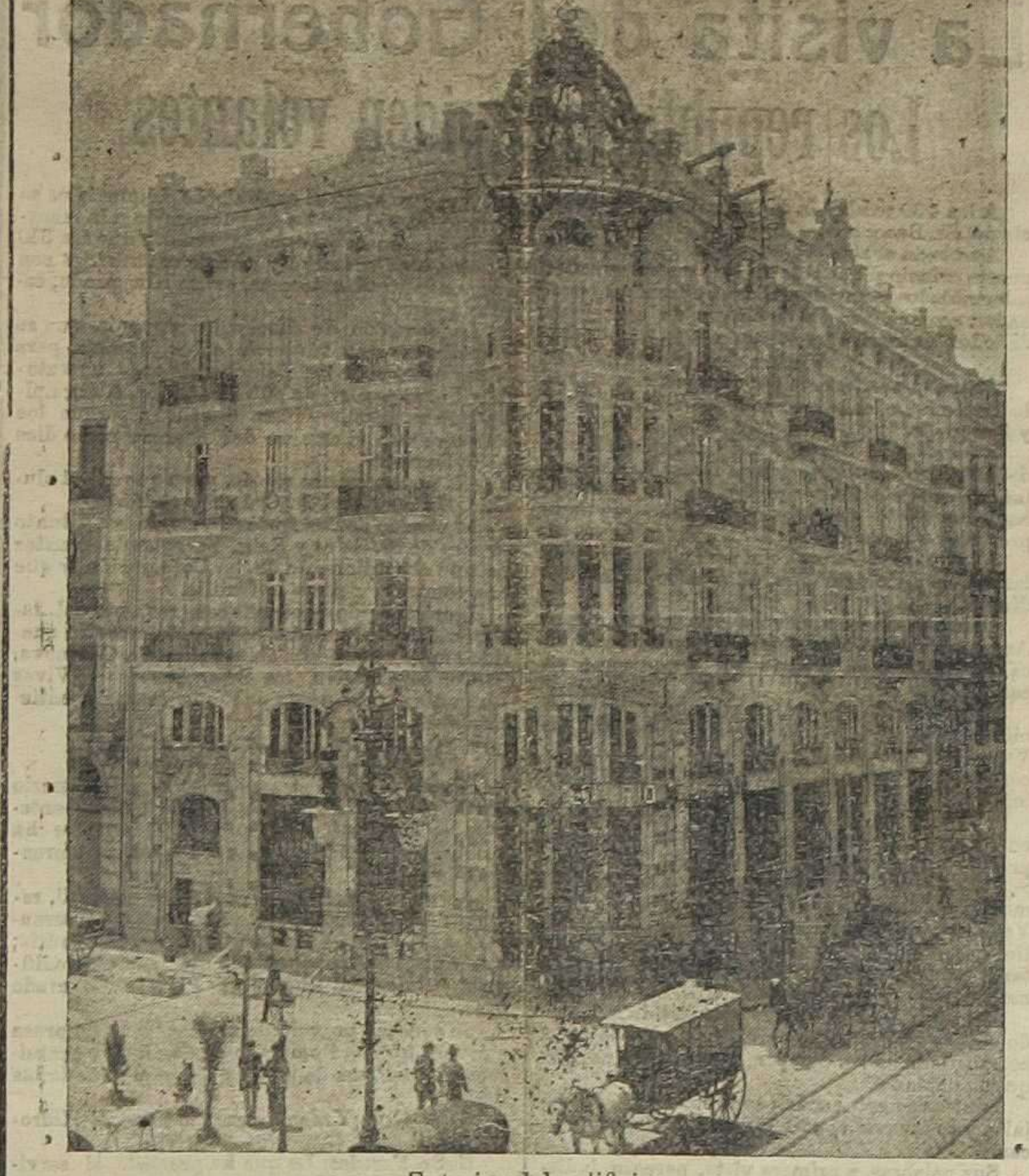
Exterior del edificio