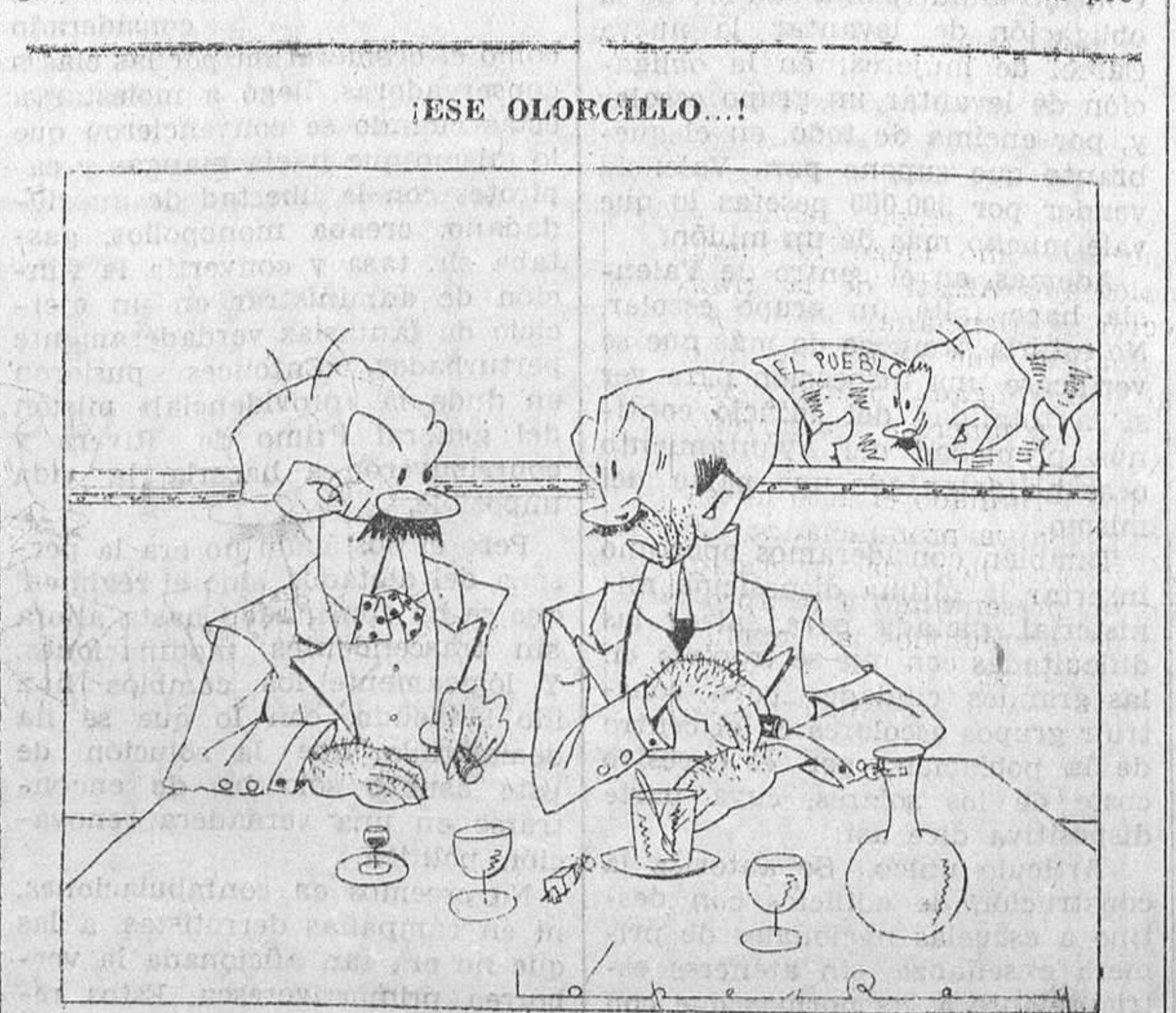
—La peseta sigue bajando. ¿No te huele mal este descenso? —Y tan mal! Me huele a petróleo. López Rey.