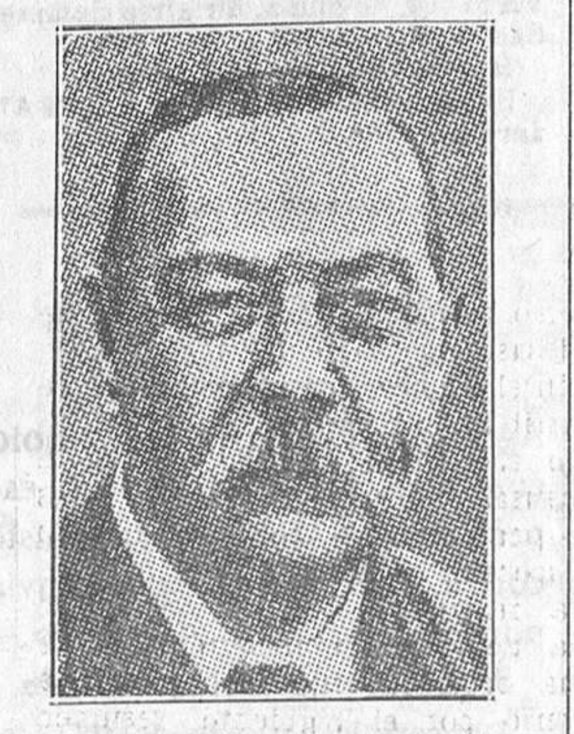
Ilustre escritor Conan Doyle

Pocos serán indudablemente quienes no sepan que Sherlock Holmes es un personaje literario, creado por Conan Doyle, el novelista de aventuras que recientemente ha fallecido a la edad de setenta y cinco años, en su residencia de Windlesham. El personaje adquirió tanta popularidad, que absorbió casi por completo la gloria de su creador. Publicamos el trabajo que sigue, en memoria del notable novelista inglés, «digno contemporáneo de Edison», ya que mostró en su género literario, un genio observador incomparable y un gran razonamiento lógico. Tres aspectos interesantes muestran la vida de sir Arturo Conan Doyle: el de médico; creador de Sherlock Holmes y el de apóstol del espiritismo. No menos atra-