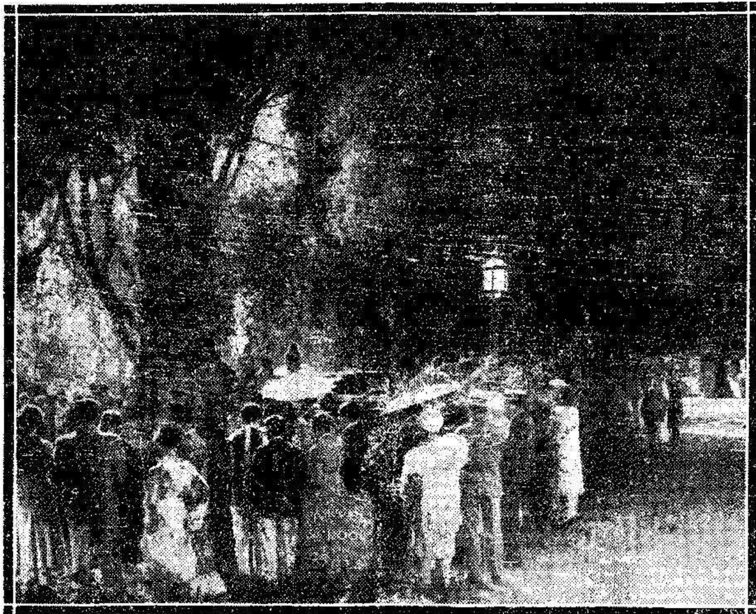
Llegaron miles de forasteros atraídos por la esplendor de las fiestas