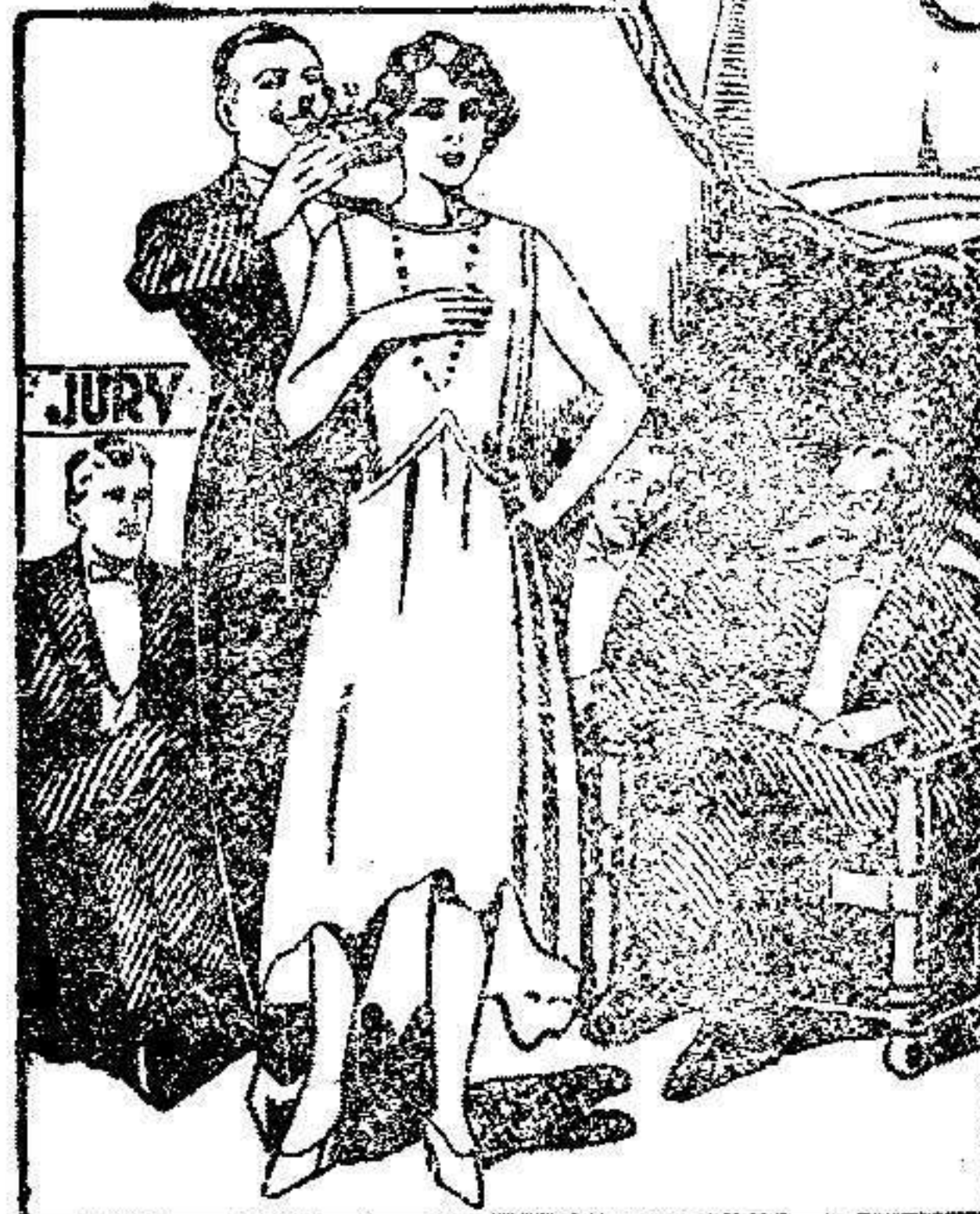
Miss Diplarakos la encantadora joven griega, designada como Miss Europa en 1930, entre las bellezas de todas las naciones de Europa. Léa como se aseguró su tez de "Triunfadora".