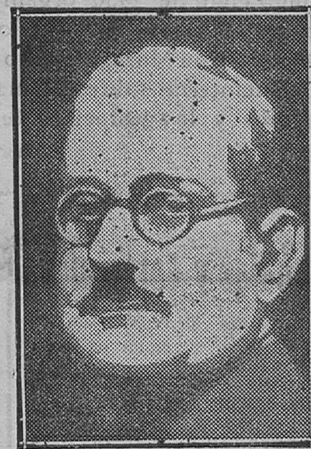
HUESCA.—El general Las Heras, Gobernador militar de Huesca, que resultó herido durante los sucesos