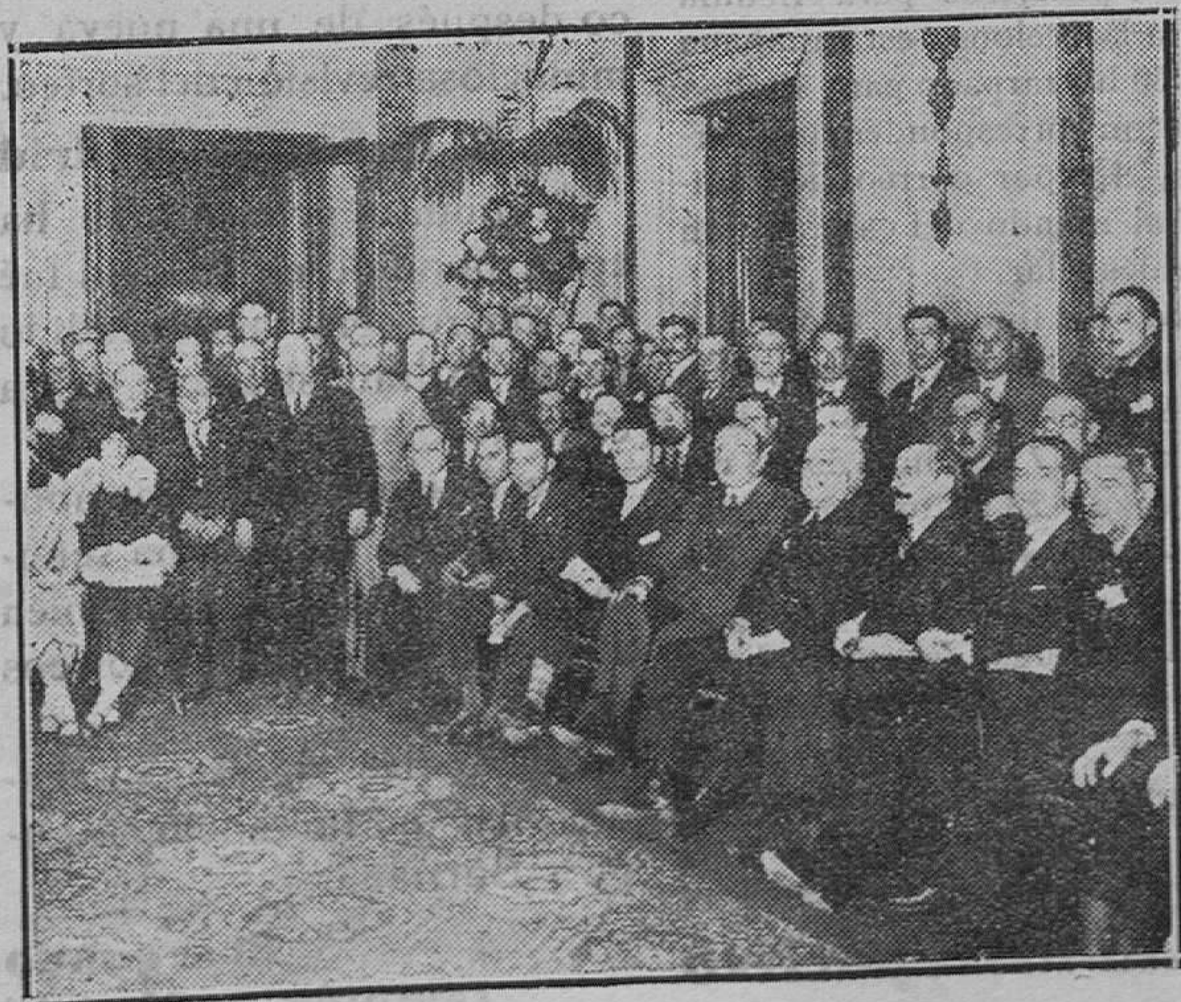
MADRID.—Un grupo de asistentes a la recepción en honor de los delegados del Congreso de la Federación Nacional de Obreros y Empleados Municipales, en el Ayuntamiento