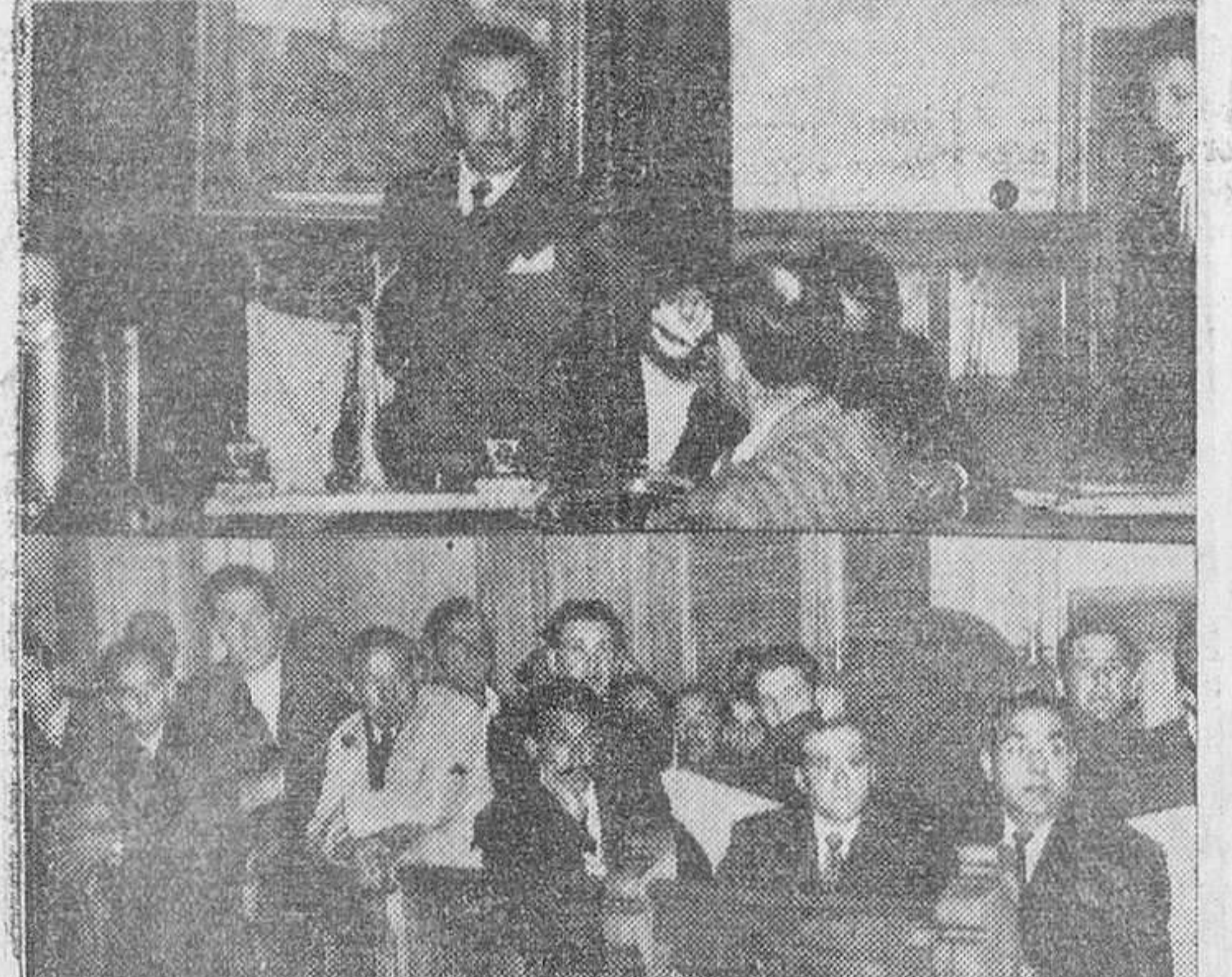
SORTEO DE VIVIENDAS EN BENAVENTE