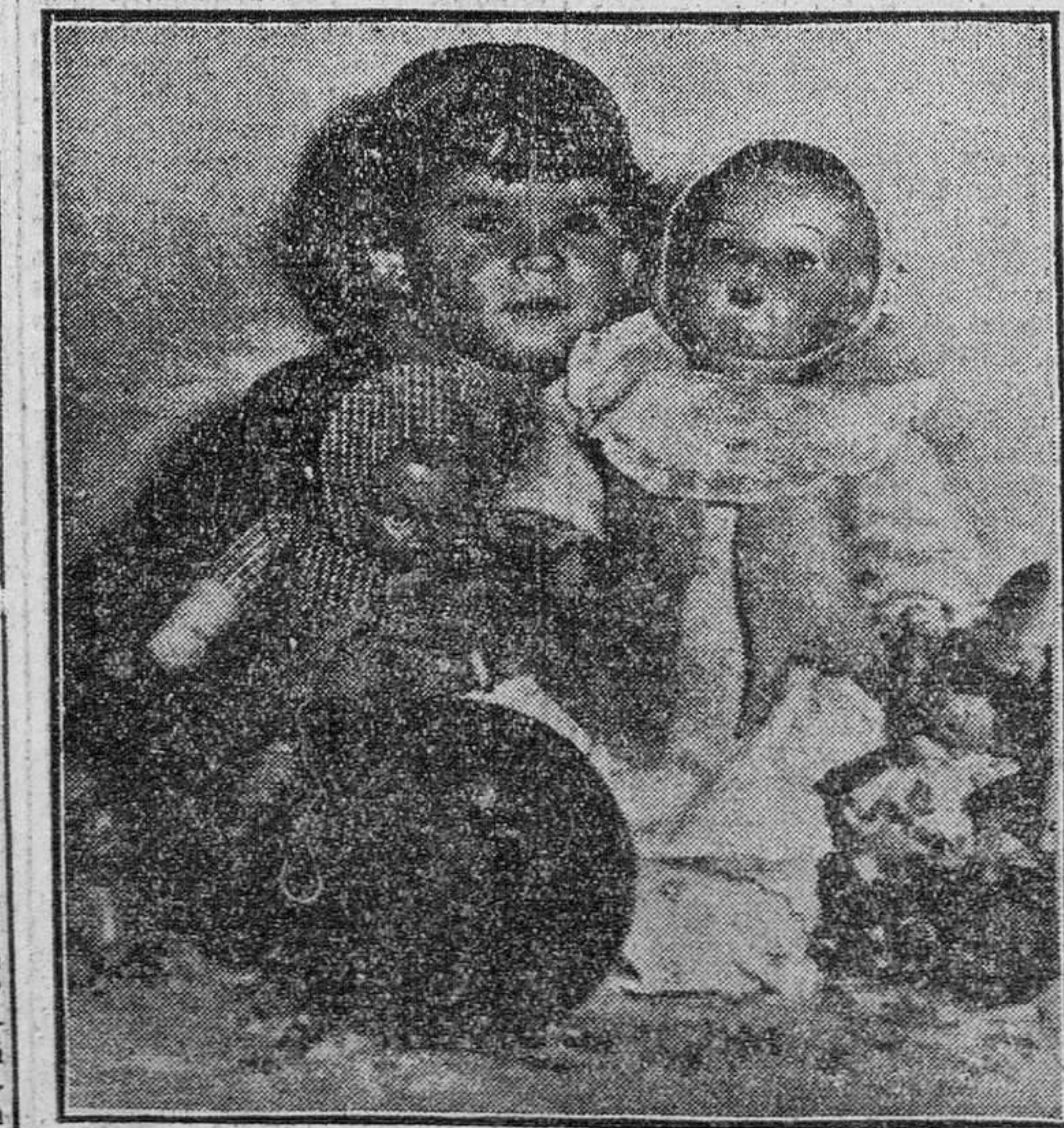
Juanes ha captado en esta fotografía la ilusión de la fiesta de los Reyes

El paso de los Reyes Magos por Zamora dejó la alegre estela de los mil variados juguetes con que los pequeños alegraron la jornada, inundando de júbilo los hogares. Los papás invirtieron buena parte del día en enseñar a sus hijos el manejo de los sencillos o complicados juguetes de la juguetería, contagiándose de paso de la alegría ilusionada de los pequeños.