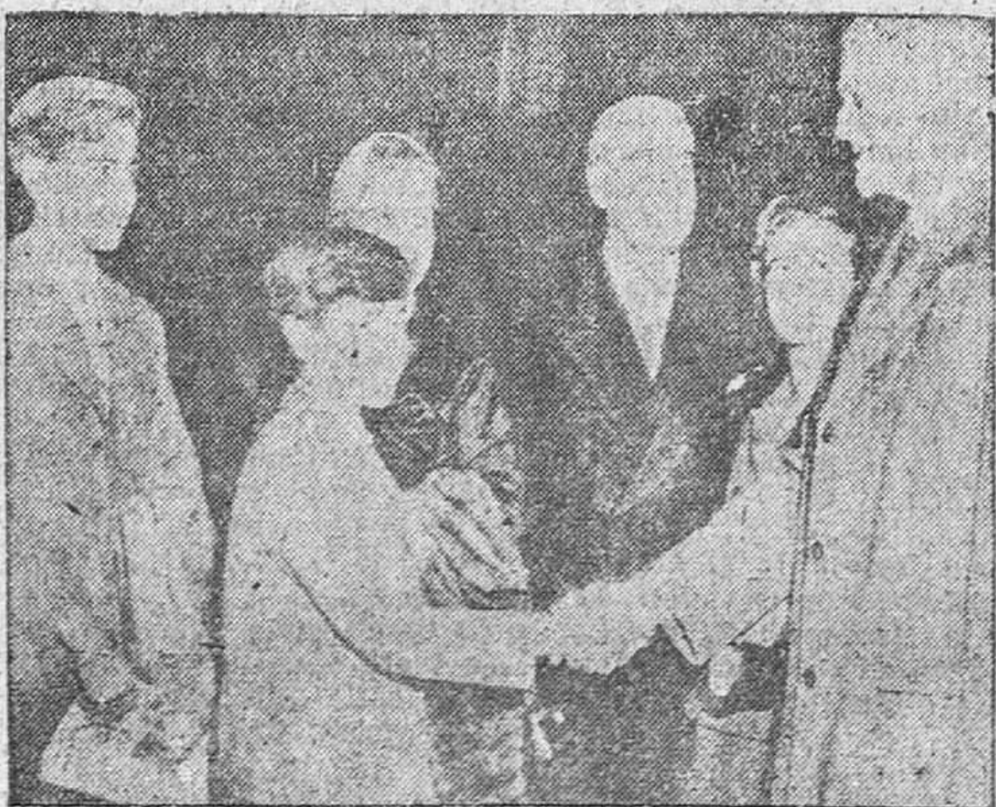
El señor Areilza, con su familia, recibe la bienvenida del Jefe de Protocolo del Departamento de Estado a su llegada a Washington para hacerse cargo de la Embajada de España.