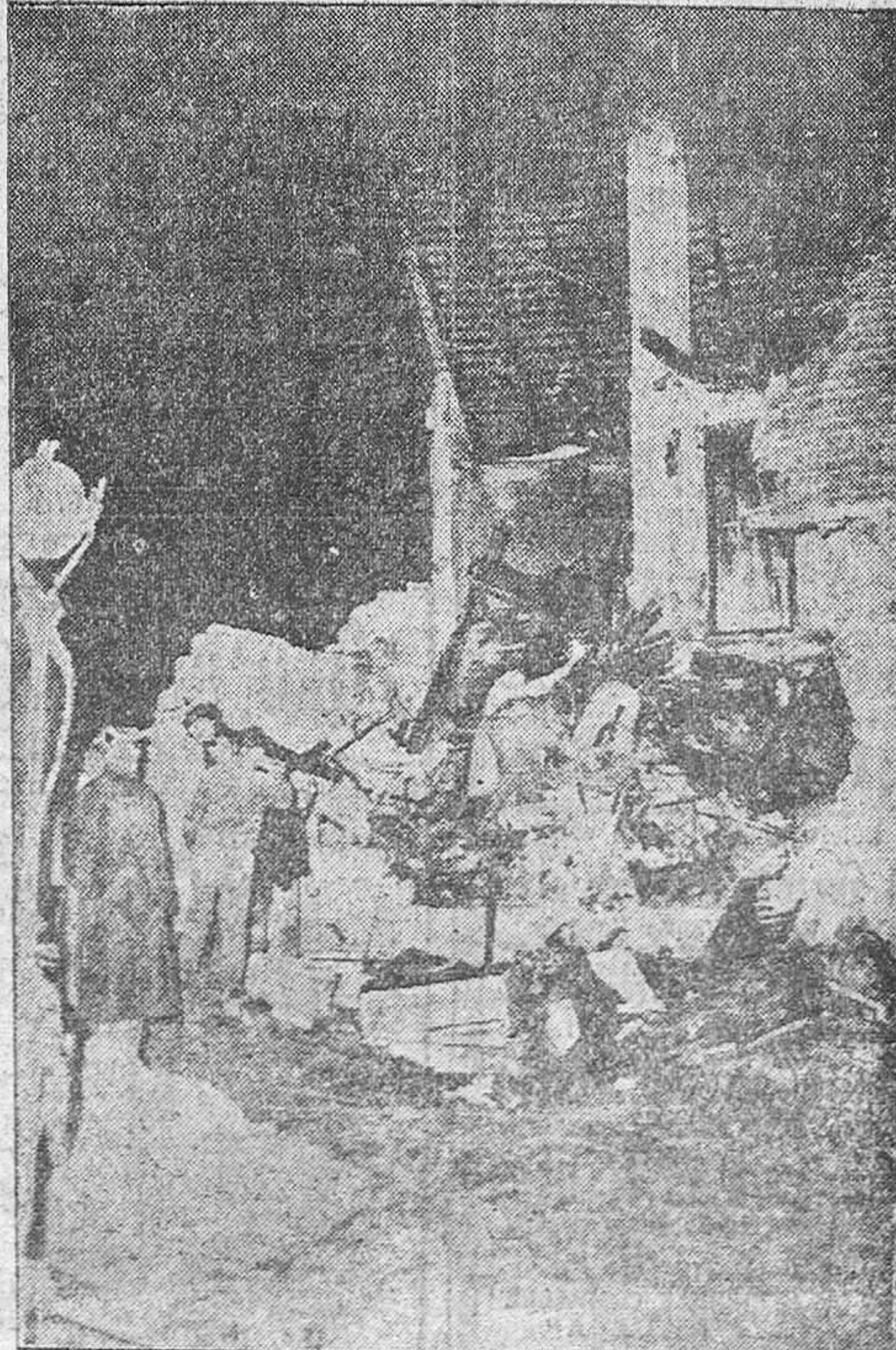
Así quedó la casa de la ciudad de Fuerstenfeldbruck después de que un avión de reacción chocó contra ella. Resultaron muertos dos habitantes de la casa y el piloto del avión.