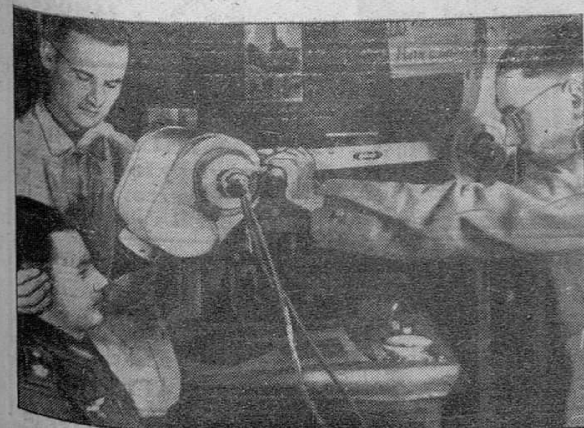
Los hospitales de campaña del ejército alemán están dotados de los más modernos aparatos para la asistencia de heridos y enfermos del frente.

Afirmó a continuación que la victoria del Imperio británico significaría la perpetua esclavitud del pueblo indio y que la libertad de éste sólo es posible con el total aplastamiento del primero. Aseguró que el indostánico que colabore con los ingleses es traidor a la causa de su país, y que los nacionalistas deben luchar tanto contra los que colaboran con los ingleses como contra éstos. Hizo resaltar por último, el absurdo de una colaboración con un Imperio «que—terminó—pronto ha de desaparecer de la superficie del globo terráqueo».—Efe.