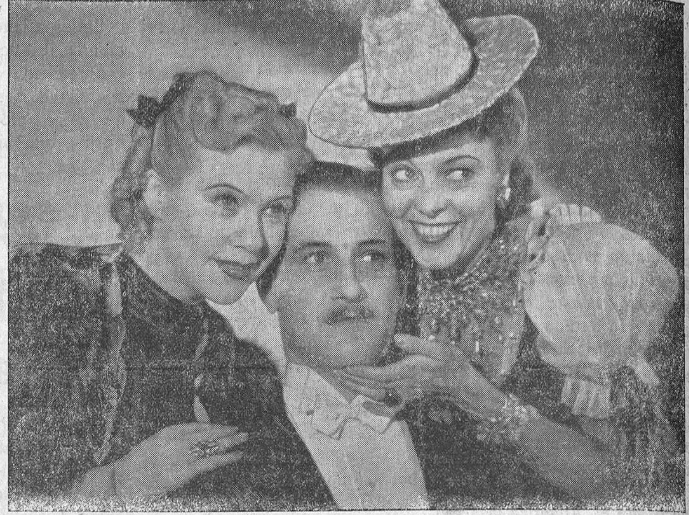
Una simpática escena de una de las últimas producciones alemanas.

Goldwyn Mayer Ibérica S. A., en el cine Capitol de Madrid, antes del día 30 de abril; junto con una carta en la que expresen su concepto del amor. La pareja ideal será seleccionada tanto por el conjunto que presente, como por la más fiel y acertada definición del amor tal como Shakespeare lo inmortalizó en su obra.