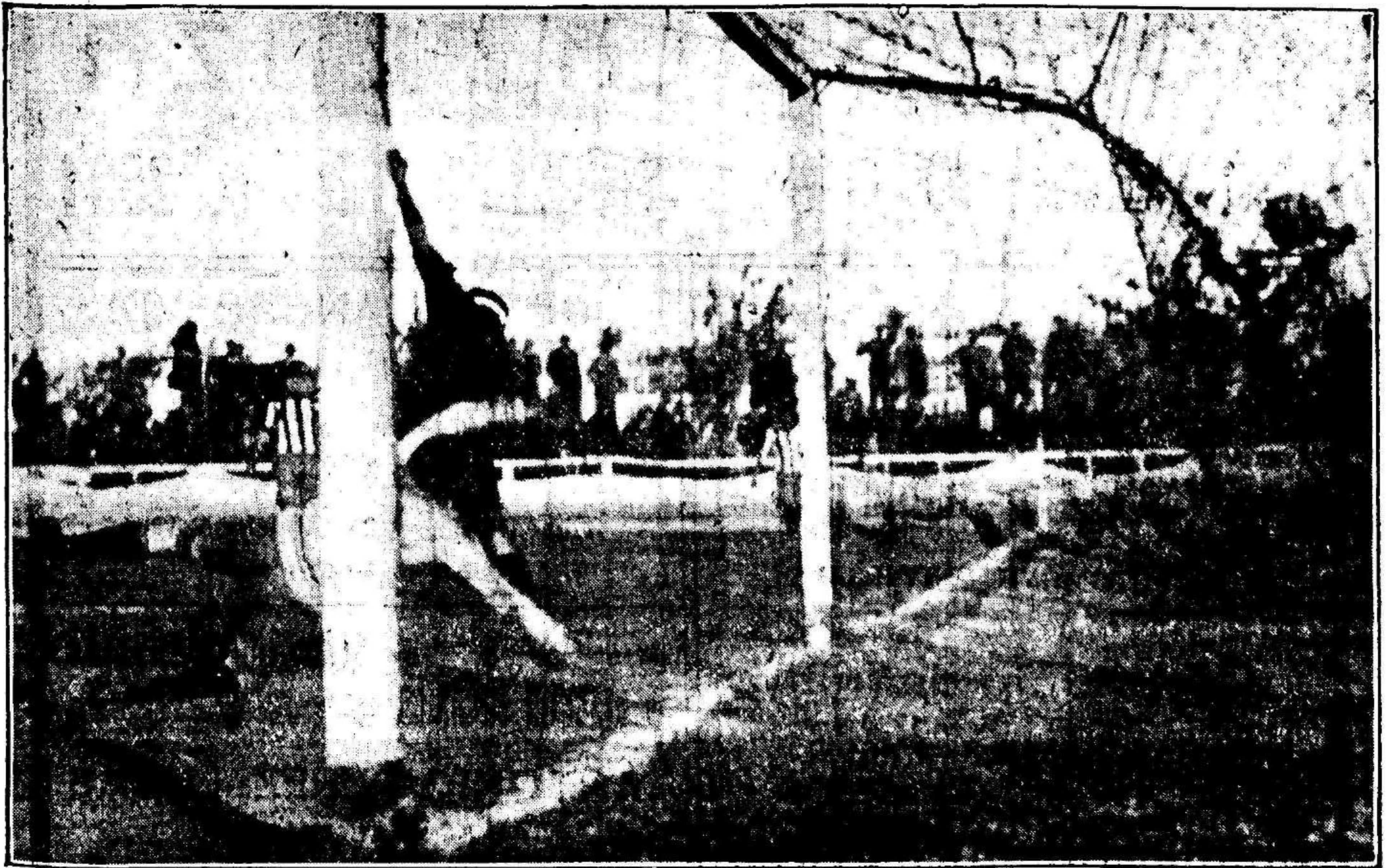
El primer goal de la tarde, marcado por Zamora, de cabeza, al rematar un bien medido centro de Sornichero.