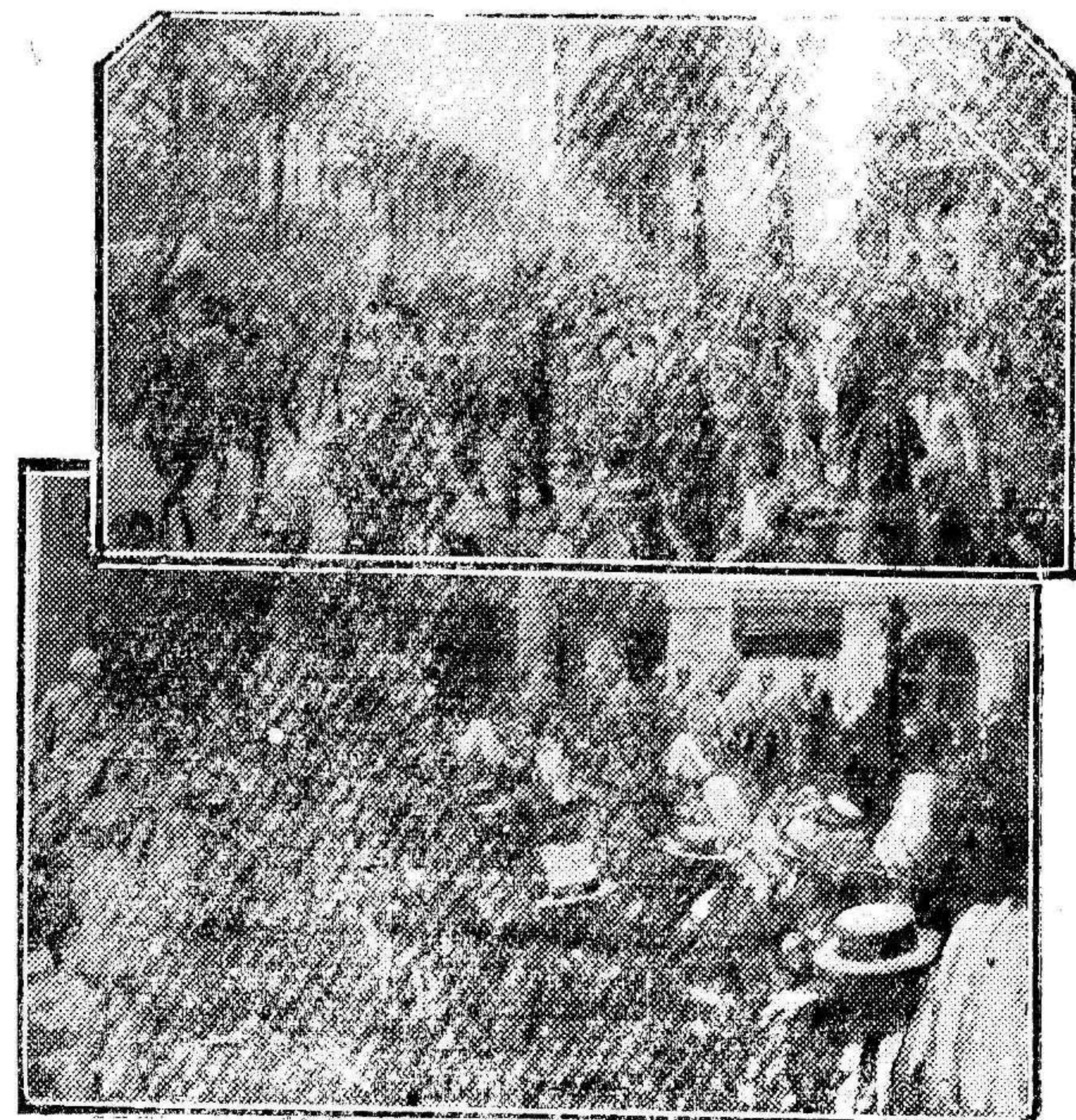
Los manifestantes invadiendo el pasco de Colón al desembarcar los aviadores. —Abajo, el público congregado frente a la iglesia de la Merced, donde se cantó un Te Deum.