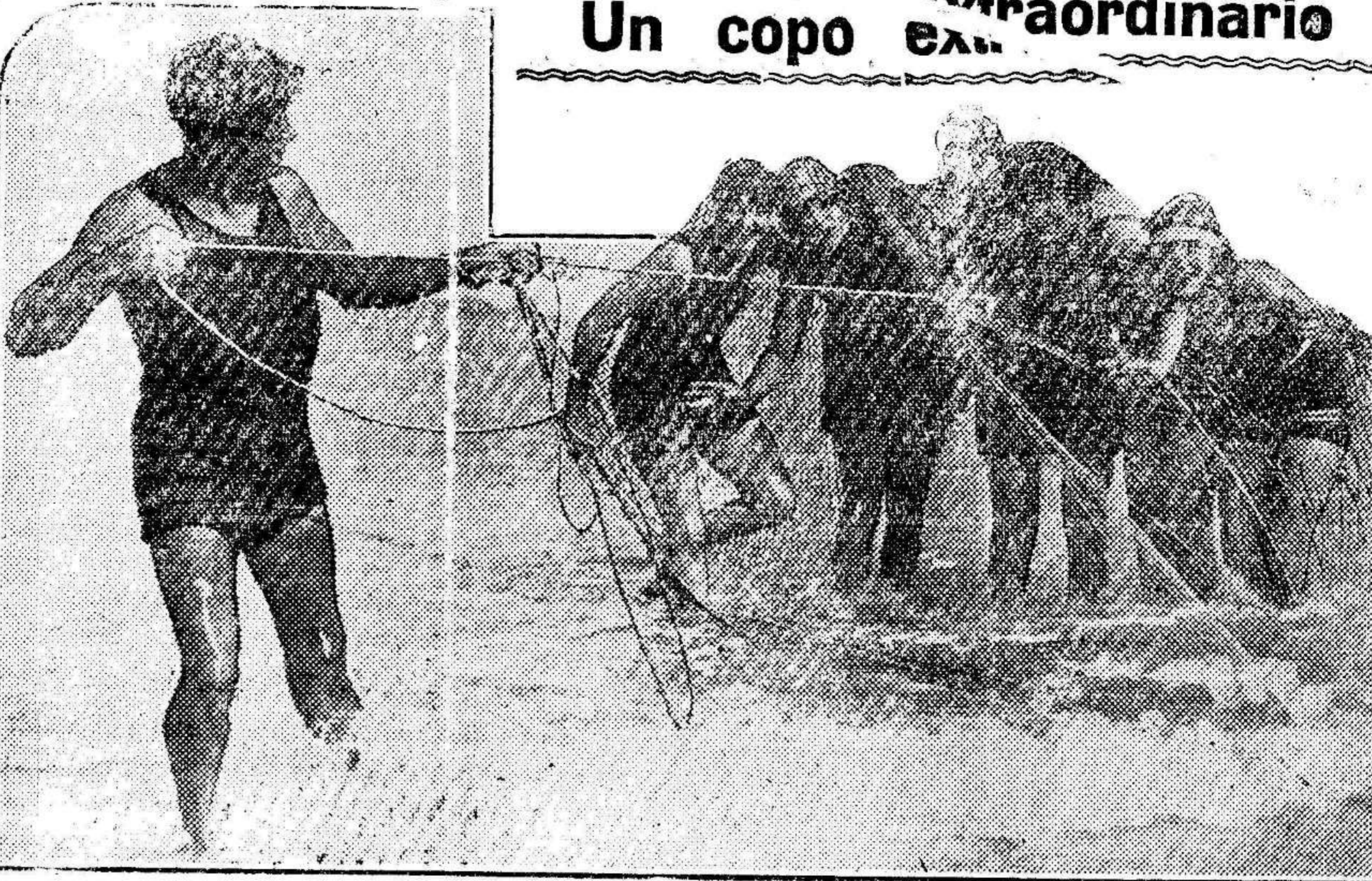
También los hombres saben lo que se pesca. He aquí uno que fué pescador y cambió de oficio, haciéndose bañero en una «distinguida» playa de Florida. Bañero ya, ha logrado lo que jamás obtuvo como pescador: un magnífico copo de mujeres. También, también los hombres saben lo que se hacen a veces cuando cambian de postura...