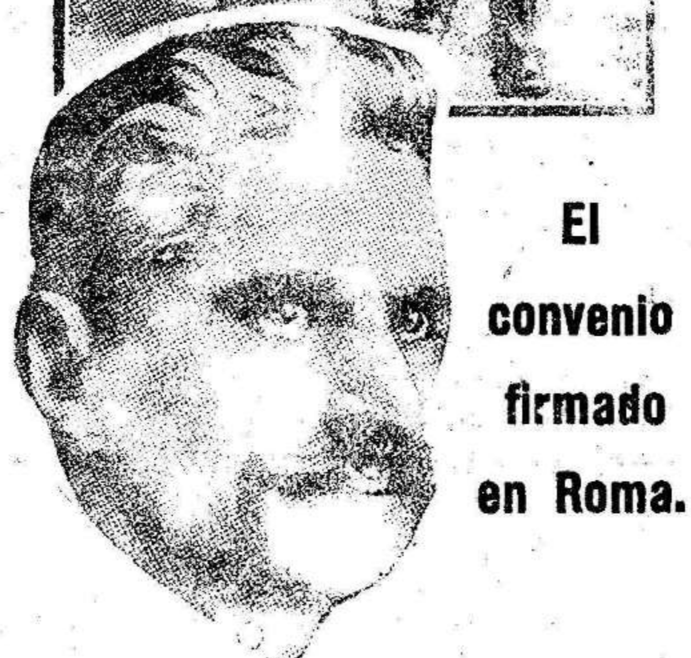
El convenio firmado en Roma.

Y perdonemos esta digresión incidental que nos ha sugerido el sol primaveral, siendo nuestro propósito evolutivo no hablar hoy más que sobre la glosa del refrán de la Candelaria, el cual estuvo a punto de quedar muy desacreditado este año.